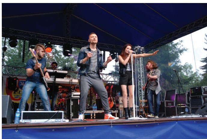
Koncert gwiazd wieczoru - Libera i Natalii Szroeder.