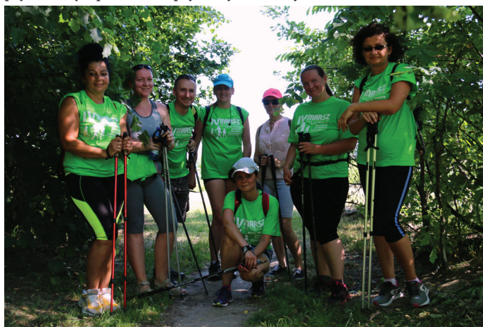
Uczestnicy IV marszu "Po zdrowie Nordic Walking".

z całej Polski. Ponad 380 uczestni- Pływackim Im. Krzysztofa Kanika”.