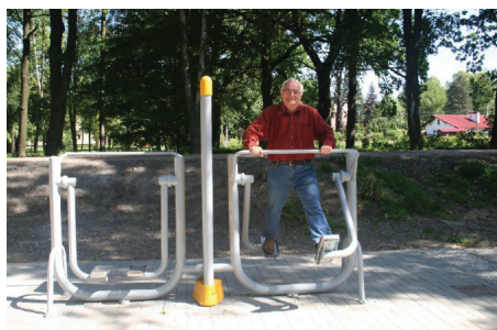
Siłownia zewnętrzna przy starym dworcu.

Wykonawca: Zakład Remontowo-Budowlany Jacek Matyszkiewicz z Goczałkowic-