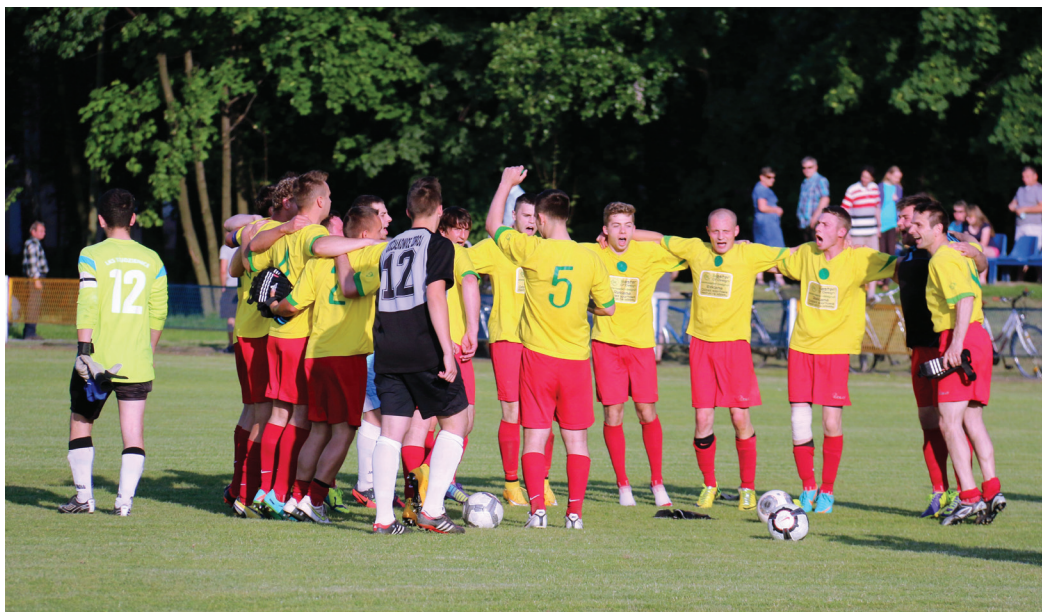
Piłkarska drużyna mężczyzn.