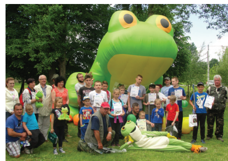
Laureaci Zawodów Wędkarskich.

Ponadto, po raz trzeci w trakcie trwania zabawy rozdano nagrody w konkursie plastycz-