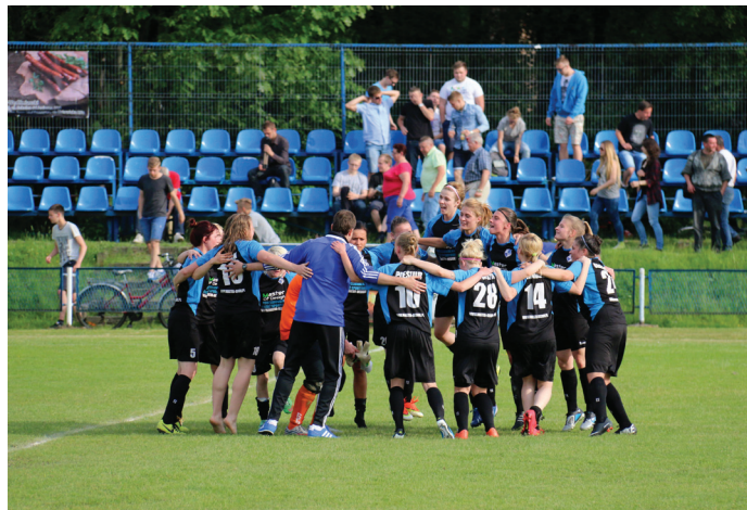
Piłkarska drużyna kobiet.

Jakby tego było mało, „królem strzelców” w „A klasie”, grupy tyskiej został goczałkowicki