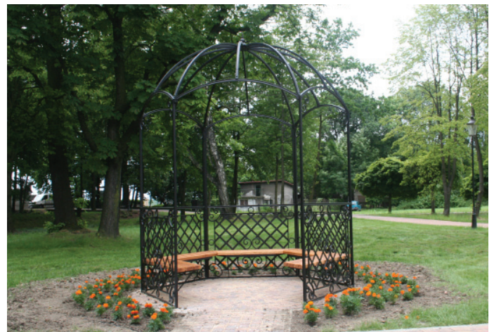
Nowe altany w Parku Zdrojowym.