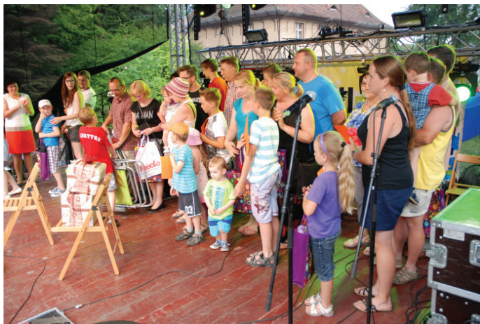
Rozstrzygnięcie VIII Goczałkowickich Potyczek Rodzin.