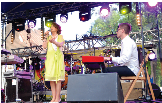
Koncert Haliny Frąckowiak.