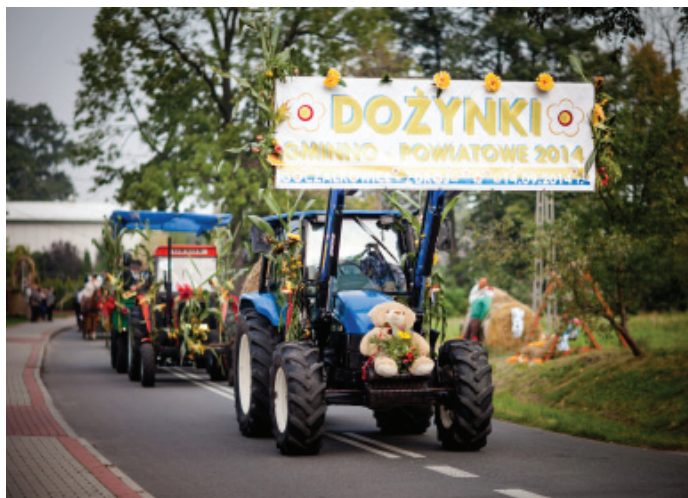
Przejazd Korowodu Dożynkowego ulicami Goczałkowic.

Korowód, w całej swej okazałości po kilkudziesięciu minutach przejazdu ukazał się oczom ludzi zgromadzonych na rozległym polu, przy koronie jeziora goczałkowskiego. Każdy przybyły pojazd pośród tłumów zebranych mieszkańców i przyjezdnych osób witał