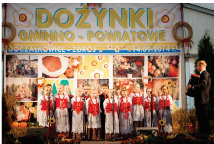
Występ dzieci z Koła Regionalnego, działającego przy SP1.