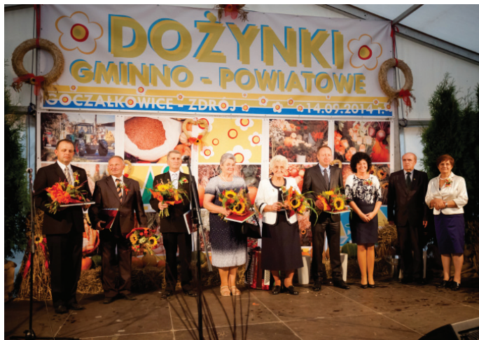
Wręczenie orderu "Dar Serca Matkom Wsi".