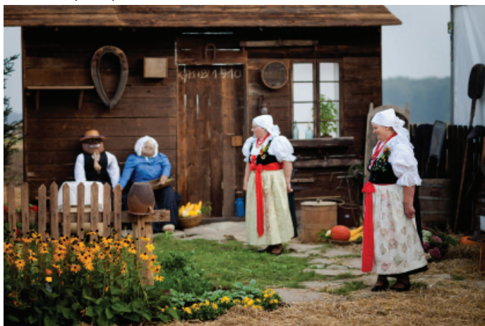
Dekoracje na miejscu obchodów dożynkowych.