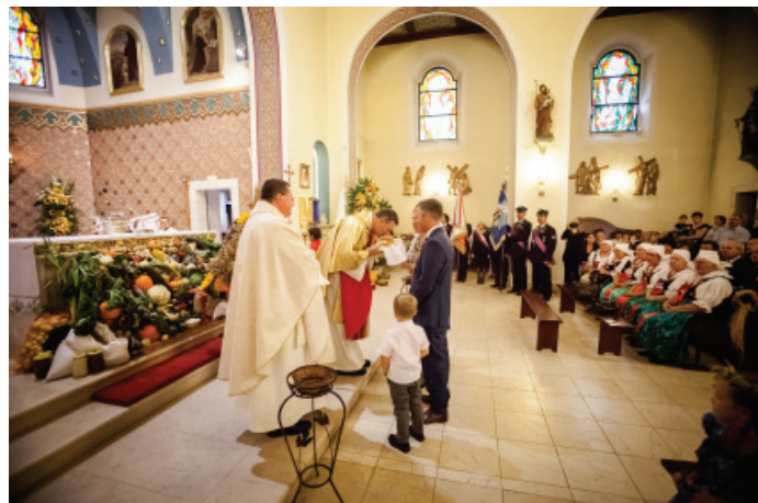
Dożynkowa msza św. w kościele parafialnym p.w. św. Jerzego.