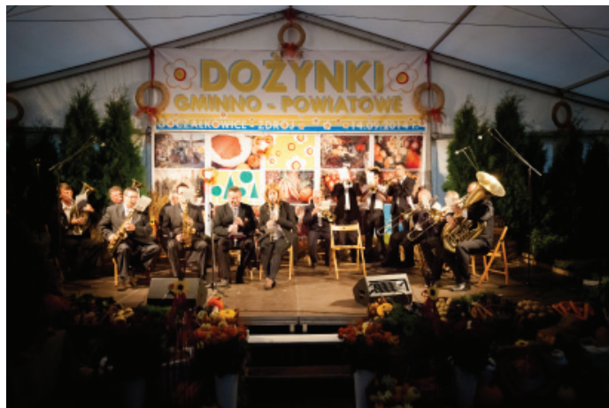
Koncert Goczałkowickiej Orkiestry Dętej.