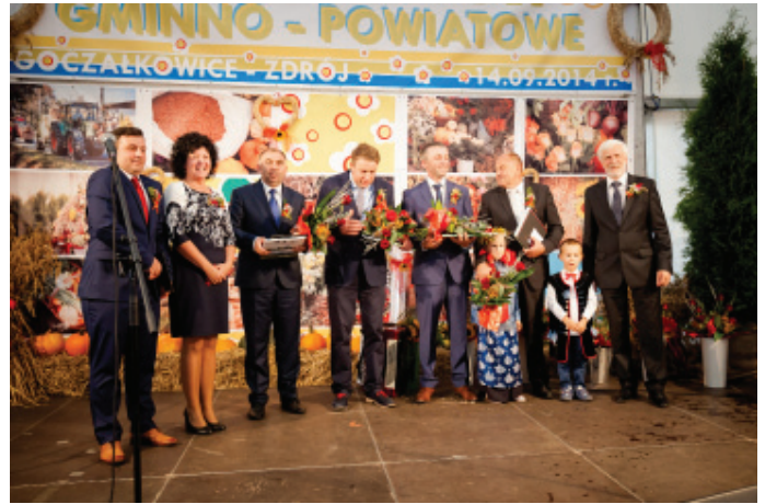
Rolnicy wyróżnieni odznaką "Zasłużony dla rolnictwa".