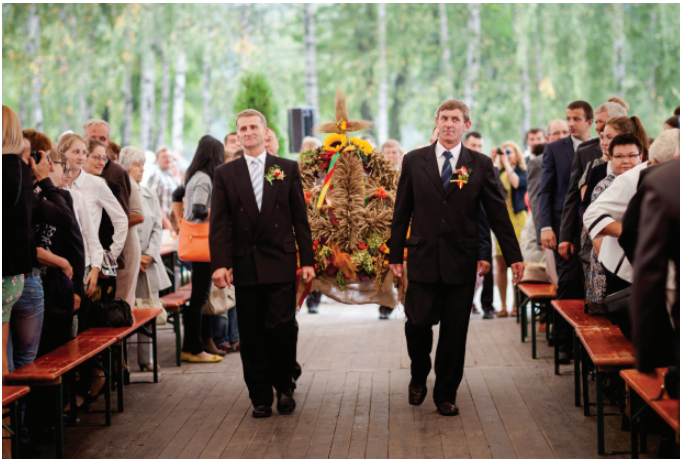
Wniesienie przez rolników Korony Dożynkowej na miejsce uroczystości obrzędowych.