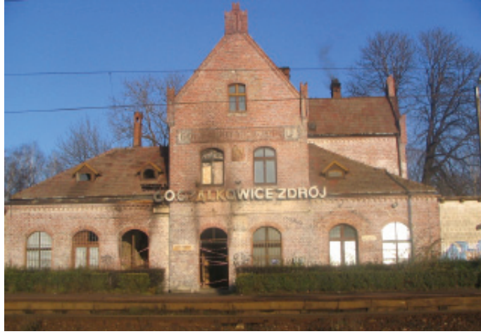
Planowany termin rozpoczęcia robót – do 14 dni po podpisaniu

Zawarcie umowy nastąpiło w dniu 10 września br. Wartość zamówienia 144.157 zł.