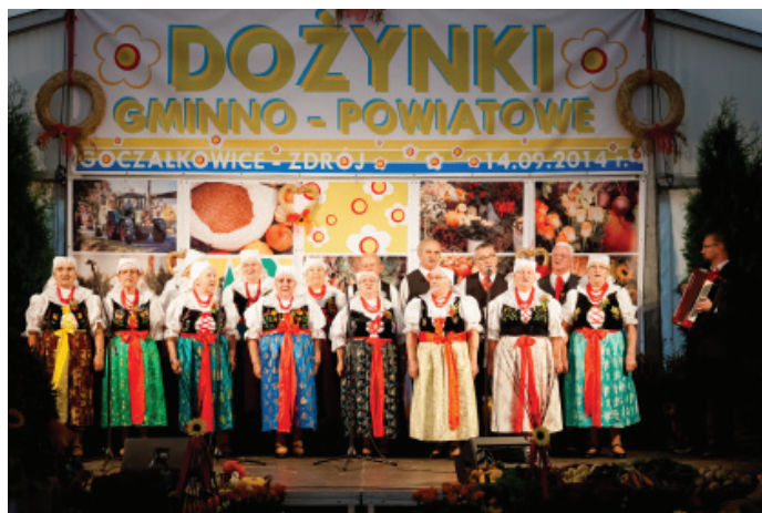
Występ Zespołu Folklorystycznego Goczałkowice.