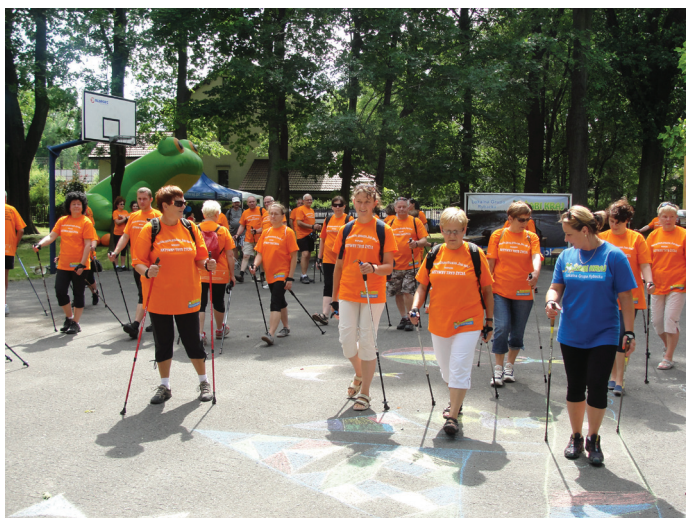
Uczestnicy marszu podczas ćwiczeń z instruktorem Nordic Walking.