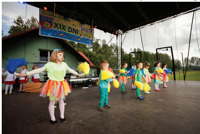
Prezentacja dzieci uczęszczających na warsztaty taneczne GOK-u.