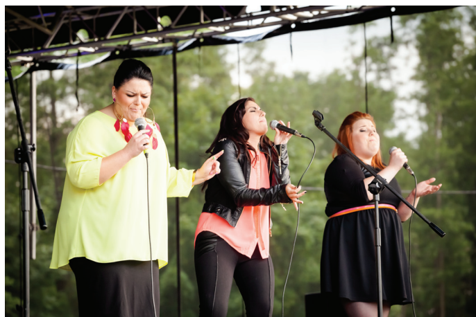
Występ zespołu The Chance.