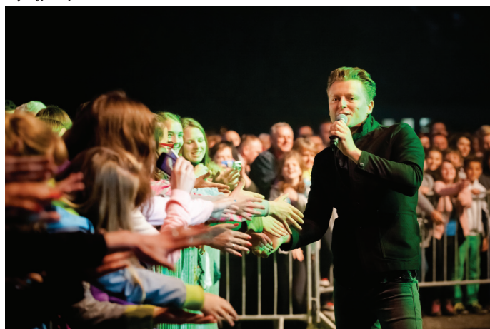
Koncert Rafała Brzozowskiego.