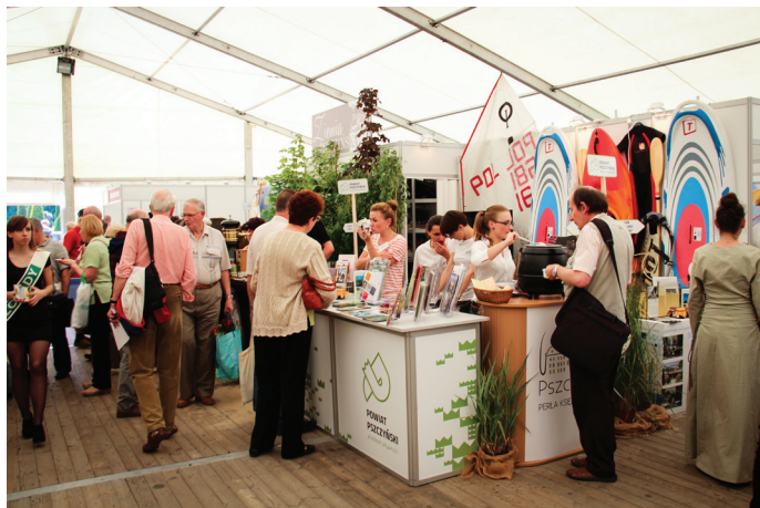
Stoisko promocyjne Ziemi Pszczyńskiej.

Gminny Ośrodek Kultury w Goczałkowicach-Zdroju