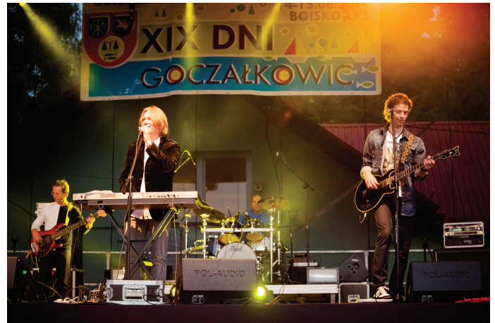
Koncert zespołu UNIVERSE.

W dalszej kolejności przyszedł czas na prezentację talentów dziecięco-młodzieżowego