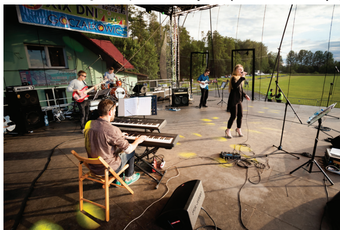
Koncert zespołu PLESSOUND.