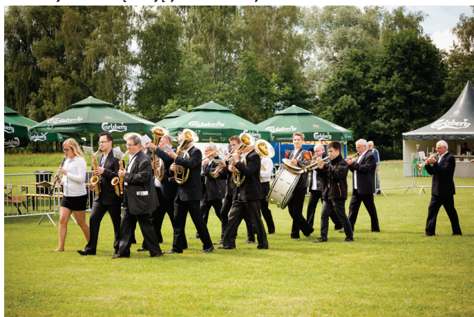
Koncert Goczałkowickiej Orkiestry Dętej.

Zespołu Folklorystycznego Jedyńka z Pszczyzny oraz zespołu Folklorystycznego Radość z Radowic. Na zakończenie bloku, organizatorzy XIX Dni Goczałkowic zaprosili do współpracy zespół Karlik, w którego skład wchodzi muzyki i wokaliści na co dzień pracujący w zespole Pieśni i Tańca Śląski oraz grupę PLESSOUND, która zaskoczyła wszystkich nowym repertuarem. Dobrze znani goczałkowickiej widowni artyści tym razem zaprezentowali się w zupełnie odmiennej aranżacji, wywodzącej się z ludowego nurtu regionu. Zarzucając folklorystyczne klimaty nadeszła pora na zaprezentowanie gwiazdy wieczoru – zespołu UNIVERSE.