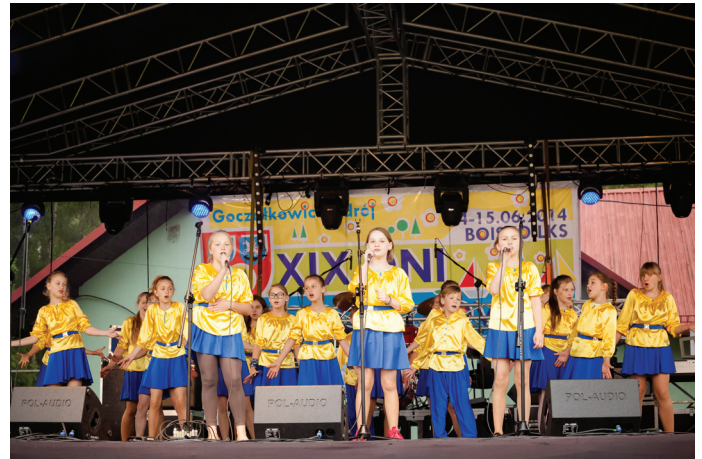
Prezentacja dzieci z Szkoły Podstawowej nr 1.