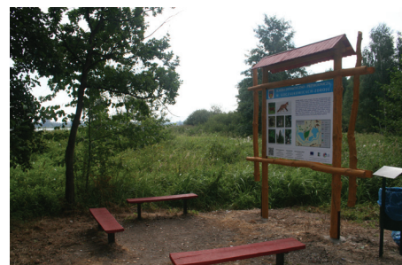
Oznakowanie ścieżek dydaktyczno-przyrodniczych.