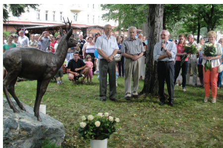
Odstonienie rzeźby Koziołka Sarny.