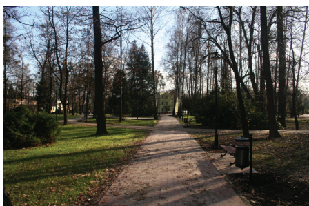
I etap rewitalizacji Parku Zdrojowego.