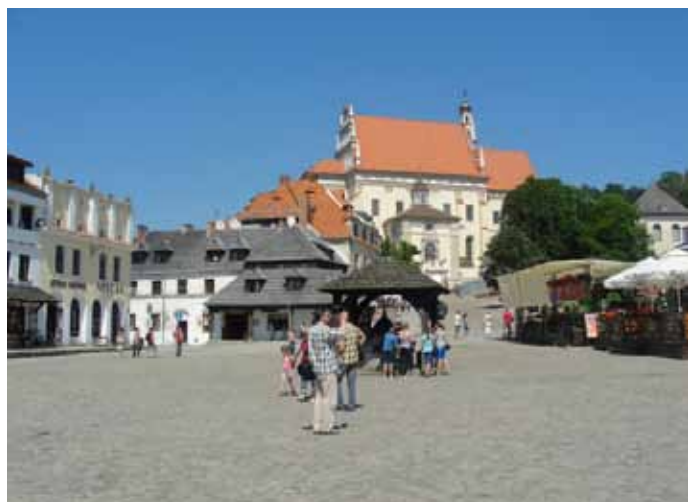
Rynek w Kazimierzu Dolnym.