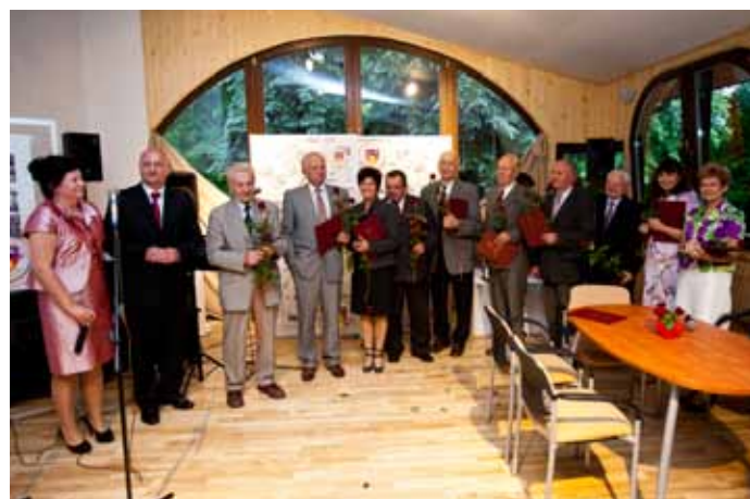
Uroczyste obchody XX-lecia - 01.06.2012 r.