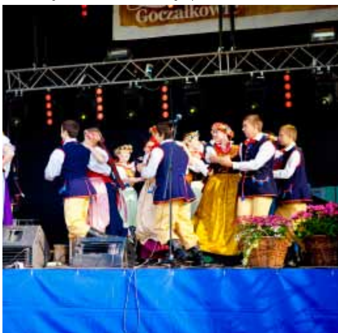
XVII Dni Goczałkowic - Goczałkowickie Spotkanie z Folklorem - 02.06.2012 r.