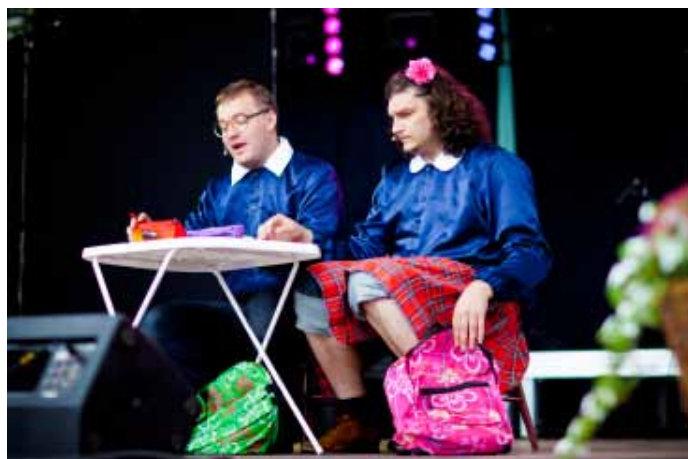
Występ kabaretu SMILE.

Gminny Ośrodek Kultury serdecznie dziękuje wszystkim, którzy wsparli organizację XVII obchodów Dni Goczałkowic, a byli to: – Bank Spółdzielczy w Pszczynie, – Bank Spółdzielczy w Tychach, – Górnośląskie Przedsiębiorstwo Wodociągowe, – Przedsiębiorstwo Górnicze