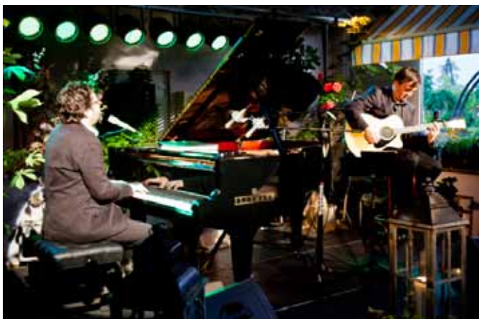
Koncert Grzegorza Turnaua i Jacka Królka - ogrody KAPIAS 01.06.2012 r.