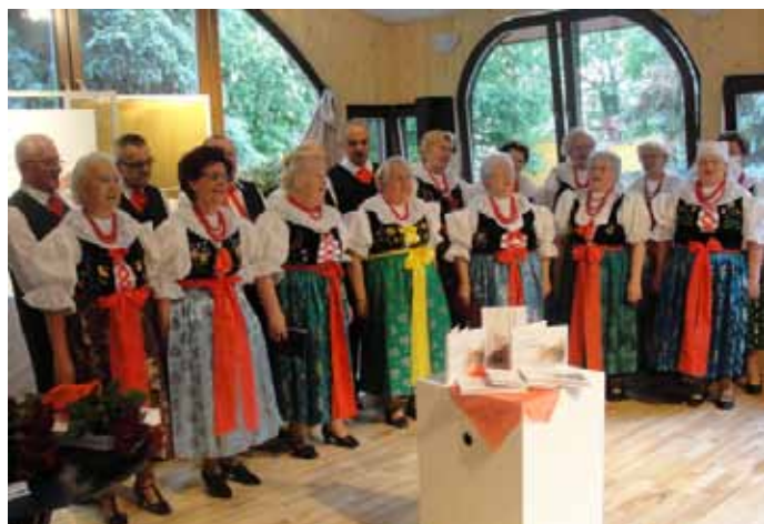
Występ Zespołu Folklorystycznego Goczałkowice w ramach Promocji Słownika.