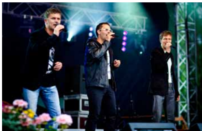
Koncert zespołu AVOCADO.