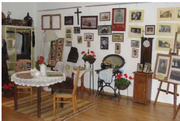
Wystawa "Wczoraj i dziś" towarzysząca promocji słownika.