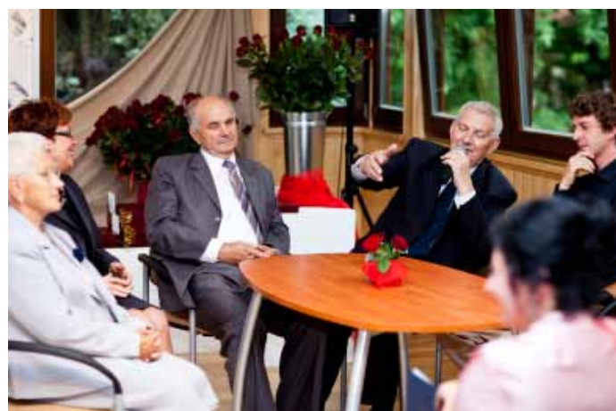
Uroczyste obchody XX-lecia - panel dyskusyjny.