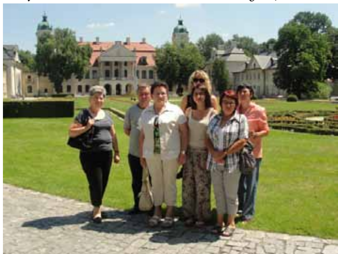
Z wizytą w Kozłówce - pałac Zamoyskich.