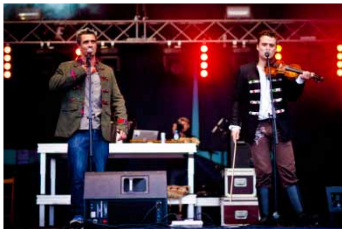
Koncert gwiazdy niedzielnej wieczoru - zespół Future Folk.

„SILESIA”, – Firma PROSEAT, – Centrum Filmowe HELIOS w Bielsku-Białej, – Muzeum Zamkowe w Pszczynie, – Zespół Sanatoryjno-Szpitalny GWAREK, – Gospodarstwo Szkółkarskie KAPIAS, – „Willa ANNA”, – Restauracja PROMENADA, – Restauracja MAJA,