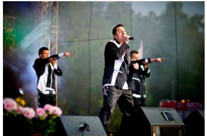
Koncert gwiazdy sobotniego wieczoru - zespołu BOYS.