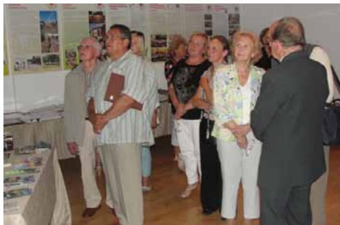
Wystawa poświęcona XX-leciu Gminy Goczałkowice-Zdrój - 26.05-26.06 2012 r.