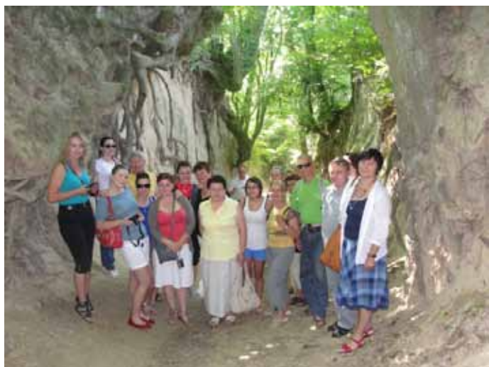
Kazimierz Dolny - Korzeniowe Doły.

ralny wyjazd, połową czerwca 2012 r., Gminny Ośrodek Kultury w Goczałkowicach-Zdroju zaprosił wszystkich miłośników podziwiania pomników historii oraz pereł polskiej architektury. Pierwszego dnia trzydniowej wycieczki 20 osobowa grupa, zanim dotarła do punktu docelowego swojej wyprawy – Kazimierza Dolnego, zboczyła nieco z trasy w kierunku Kozłówek. W tej niewielkiej wsi, położonej 35 km od Lublina, znajduje się zespół pałacowo-parkowy związany z dwoma znamienitymi rodami – Bielińskimi i Zamoyskimi. Kompleks należy do jednych z najlepiej zachowanych rezydencji w kraju. Zwiedzających (tym samym i nas) zachwylił bogatą kolekcją malarstwa, rzeźby, rzemiosła artystycznego oraz dbałością o najdrobniejsze szczegóły wystroju.