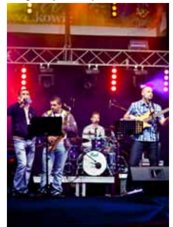
Koncert zespołu ALBI.

zespołu instrumentalnego Art Music Trio. Pod namiotem, rozstawionym na murawie boiska rozbrzmiewały dźwięki tak popularnych utworów jak: „Gdybym Miał Gitarę”, „My Cyganie”, „Ukraina”, „Hej Bystra Woda”, „Hej Góral Jo Se Góral” itp., które porwały „gości” do śpiewu i wspólnej zabawy.