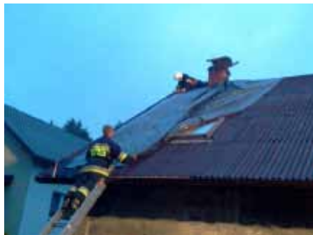
Strażacy OSP Goczałkowice w trakcie akcji.

Strażacy Ochotniczych Straży Pożarnych z gmin powiatu pszczyńskiego wraz z Państwową Powiatową Strażą Pożarną w Pszczyźnie pomagali zabezpieczać budynki mieszkalne przed zalewaniem na skutek podziurawionych dachów. Akcją dowodził Komendant