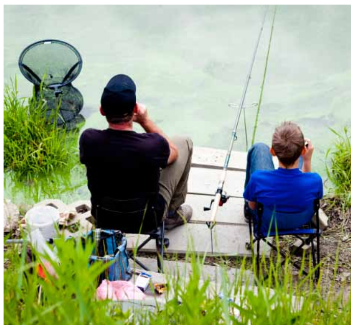
Zawody wędkarskie dla dzieci - staw Rontok 03.06.2012 r.