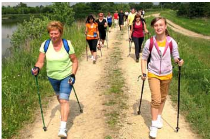
Marsz po zdrowie - Nordic Walking - 27.05.2012 r.