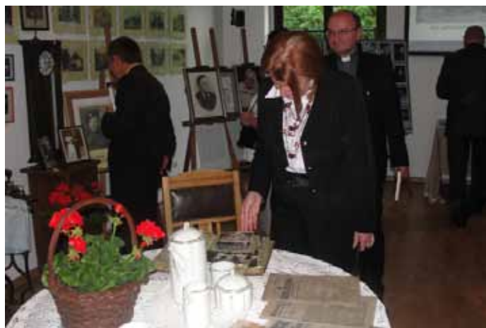
Zaproszeni goście w trakcie zwiedzania wystawy.