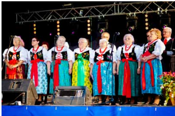
Goczałkowskie Spotkanie z Folklorem - Zespół Folklorystyczny Goczałkowice.

nie wręczono pięć nagród głównych i 10 wyróżnień). Kilkanaście minut później konferansjer – Wojciech Łala zaprosił widowie na „Goczałkowskie Spotkanie z Folklorem”. W ramach powyższego projektu, współfinansowanego ze środków Unii Europejskiej na scenie zaprezentowały się: Zespół Regionalny, działający przy SP nr 1 Zespół Folklorystyczny „Małe Jankowianki”, Zespół Pieśni i Tańca „Przygoda” z Rybnika, Zespół Śpiewaczy „Mizerowianki” oraz nieoceniony Zespół Folklorystyczny „Goczałkowice”, który swym występem zamknęły blok ludowy.