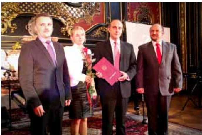
Właściciele firmy MOLBUD z odebraną nagrodą.