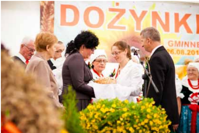
Uroczyste przekazanie chleba dożynkowego.

folklorystycznego Goczałkowice, który zaprezentował pieśni żniwne z pszczyńskiego regionu.