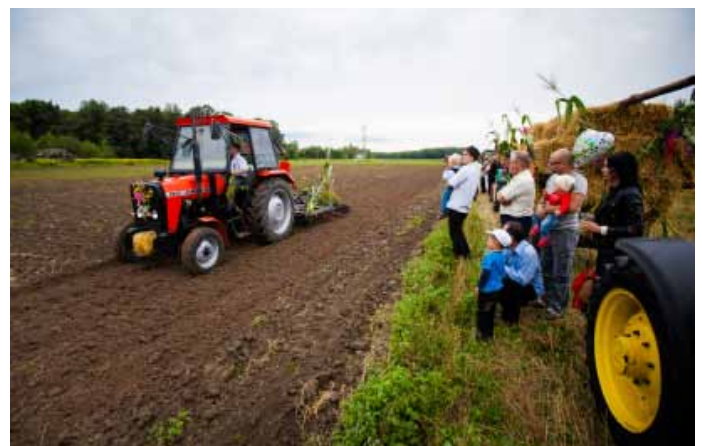
Pokaz maszyn rolniczych.