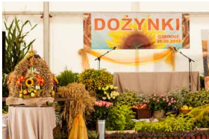
Tegoroczna dekoracja wraz z koroną dożynkową.