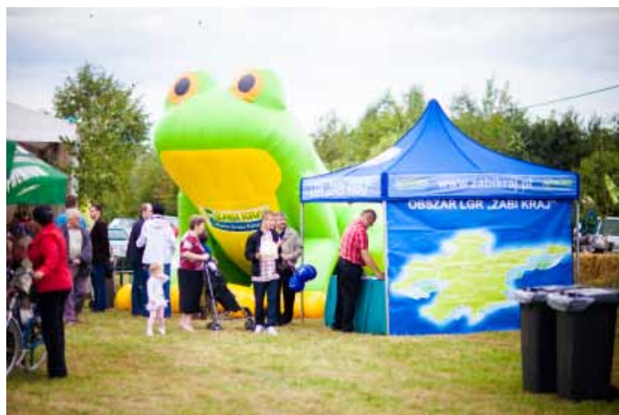
Stoisko Lokalnej Grupy Rybackiej "ŻABI KRAJ".