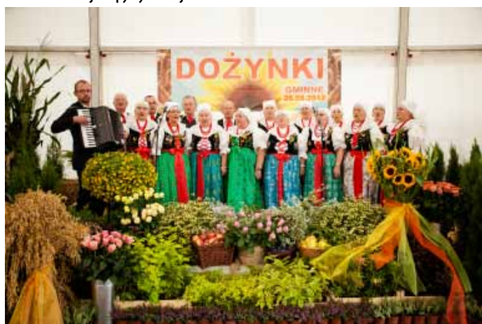
Występ Zespołu Folklorystycznego GOCZAŁKOWICE.