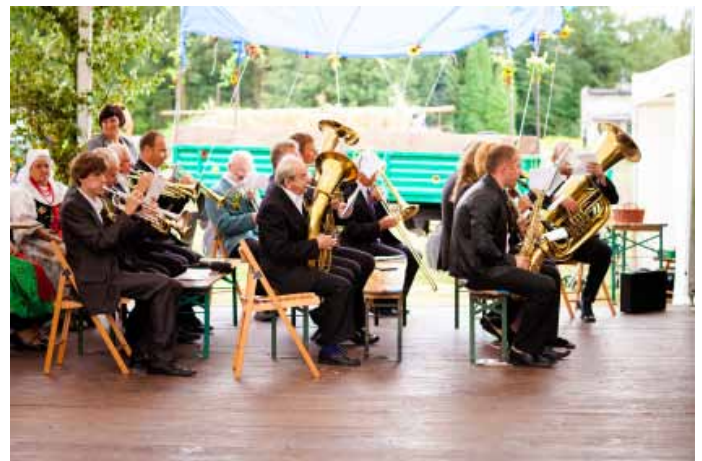
Goczałkowicka Orkiestra Dęta.