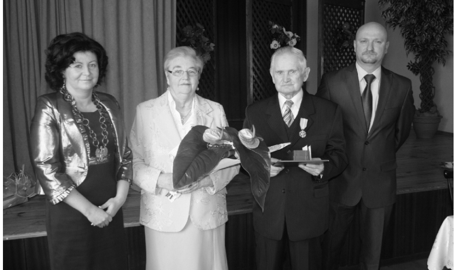
BABSKI COMBER 2011 - str. 11-12