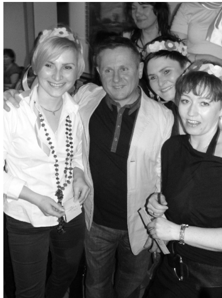
SPOTKANIE PG SILESIA - str. 5-6