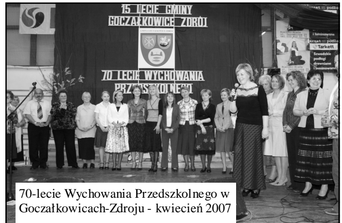
70-lecie Wychowania Przedszkolnego w Goczałkowicach-Zdroju - kwiecień 2007