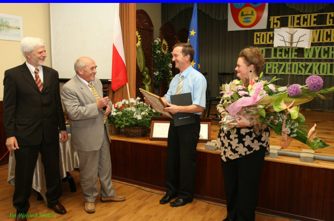
Wójt Gminy oraz Przewodnicząca Rady przyjmują gratulacje i życzenia od Starosty i Przewodniczącego Rady Powiatu Pszczyńskiego