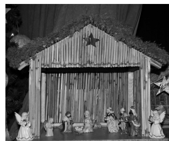
Jedna z betlejemek wykonana w tegorocznym przeglądzie zorganizowanym przez Przedszkole