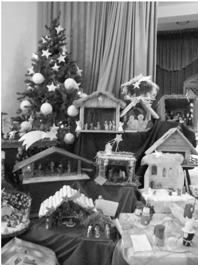
Betlejemki wykonane w tegorocznym przeglądzie