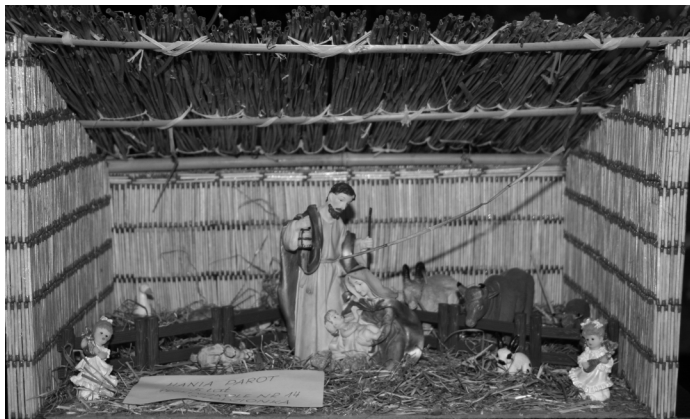
Jedna z betlejemek wykonana w tegorocznym przeglądzie zorganizowanym przez Przedszkole

Zajęcia w nowym roku rozpoczną się od 7.01.2008 r. Serdecznie zapraszamy!