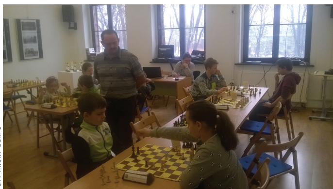
Zimowy Turniej Szachowy w siedzibie Gminnego Ośrodka Kultury.

roznawczą wycieczkę do zabytkowej kopalni Guido w Zabrze, gdzie uczestnicy mieli okazję odkryć tajniki pracy górników od czasów najdawniejszych po współczesne techniki wydobycia węgla kamiennego.