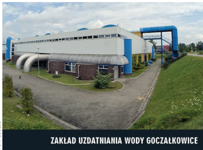
ZAKŁAD UZDATNIANIA WODY GOCZAŁKOWICE