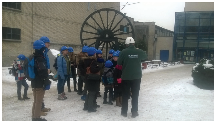
Wycieczka kulturoznawcza do kopalni węgla kamiennego Guido w Zabrze.

W trakcie trwania ferii w każdy poniedziałek zainteresowani mogli wziąć udział w bezpłatnych zajęciach języka angielskiego. Z kolei w popołudniowe czwartki dla nieco starszych dzieci i młodzieży zaplanowano warsztaty Kreatywnej Pracowni, na których podopieczni zapoznali się z tajemnicami zdobniczej metody – decoupage. We wtorek 17 stycznia najmłodsi wybrali się na zwiedzanie wnętrz pałacowych w pobliskiej Pszczynie połączonych z tematycznymi warsztatami przeprowadzonymi w odrestaurowanych Stajniach Książęcych. Dzień później, zorganizowano rodzinny wyjazd do teatru lalek Ateneum w Katowicach na spektakl „Krawiec Niteczka”, a w piątek kultu-