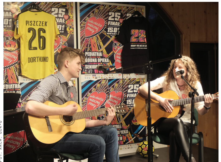
25 Finał WOŚP – występ podopiecznych warsztatów muzycznych GOK-u.