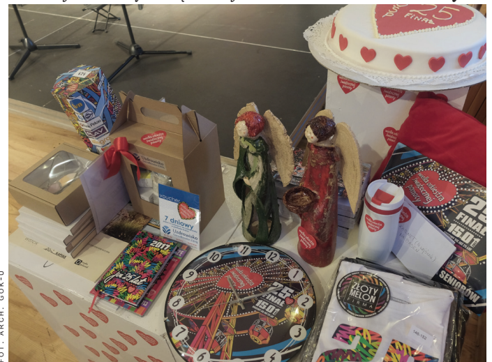
Licytowane w ramach 25 Finału WOŚP przedmioty.