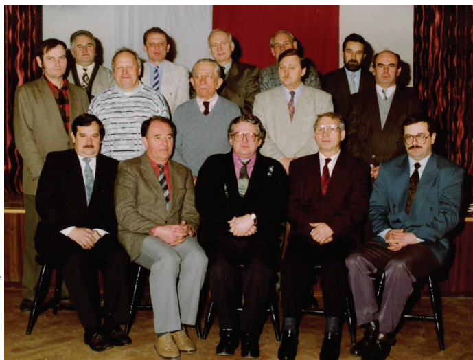
Członkowie Rady Gminy I kadencji.