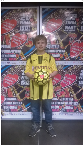
Szczęśliwy nabywca piłki i koszulki BORUSSII DORTMUND.