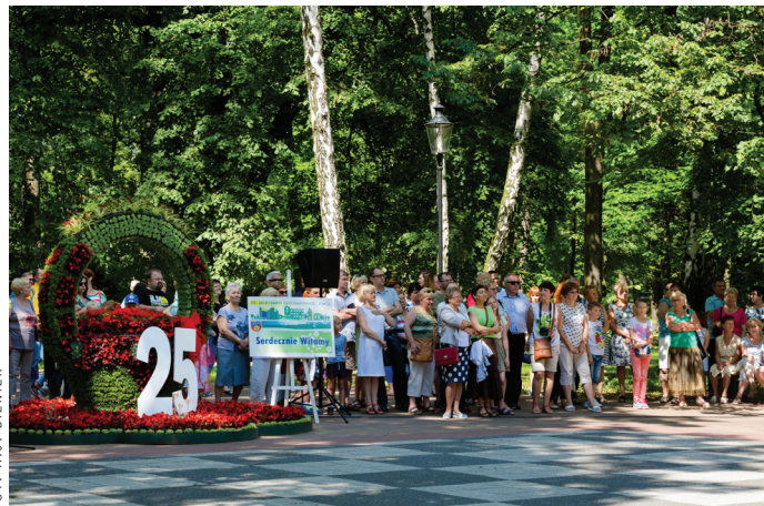
Uroczystość jubileuszu 25-lecia gminy w Parku Zdrojowym.

Za nami szereg wydarzeń i imprez. Dziękujemy wszystkim współorganizatorom naszego gminnego święta. Szczególne słowa uznania kierujemy do sponsorów strategicznych oraz osób i firm wspierających. Dzięki Państwa zaangażowaniu, przychylności i ofiarności obchody 25 – lecia samorządności Gminy i XXII Dni Goczałkowic mogły mieć tak