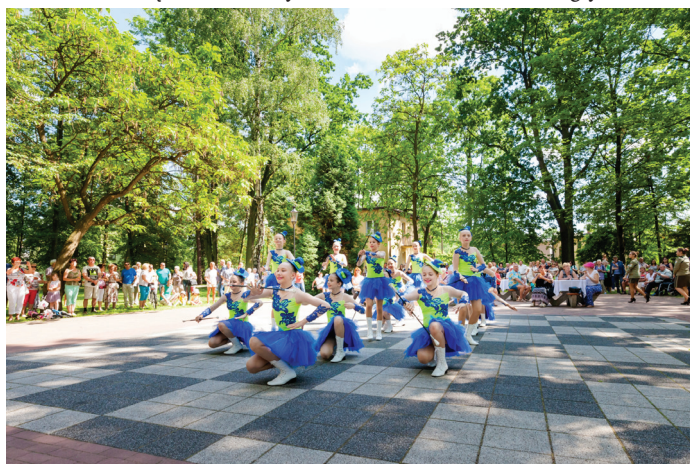
Występ MAŻORETEK w Parku Zdrojowym.

Gmina Goczałkowice, Przedszkole Publiczne nr1, Przedszkole Publiczne nr2, Szkoła Podstawowa nr1, Gimnazjum, Gminny Ośrodek Sportu i Rekreacji, Ochotnicza Straż Pożarna, Gminna Biblioteka Publiczna, Gminny Ośrodek Kultury.