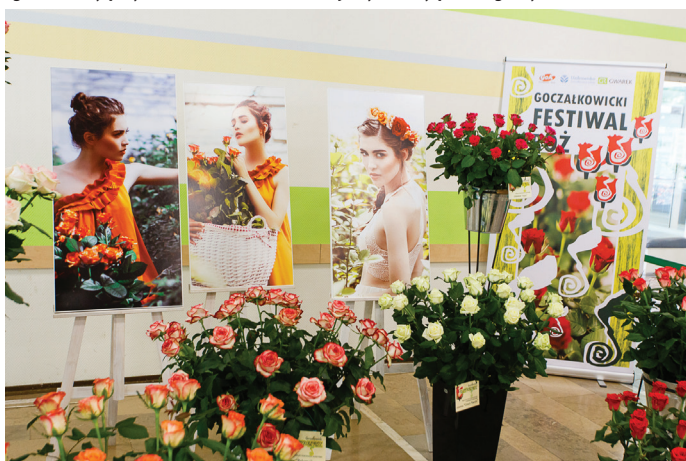
GWAREK - wystawa róż.