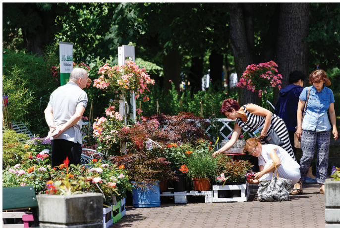
Ogród różany przy fontannie uzdrowskiej, wykonany przez Ogrody KAPIAS.