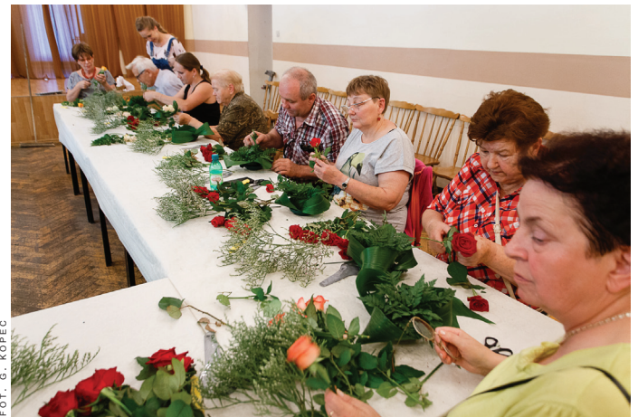
Warsztaty florystyczne w pawilonie "Wrzos".