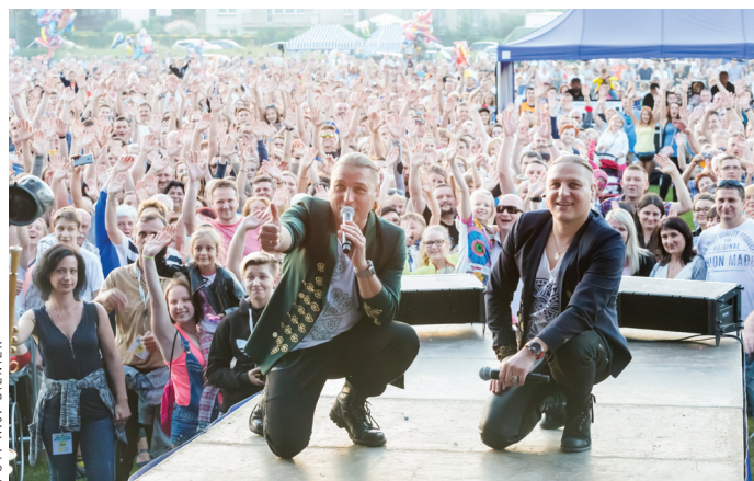
Koncert zespołu Golec uOrkiestra, na zdj. Łukasz i Paweł Golec.