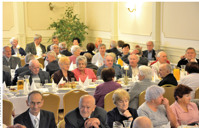
Jak co roku Dzień Seniora cieszył się dużym zainteresowaniem mieszkańców Goczałkowic-Zdroju.