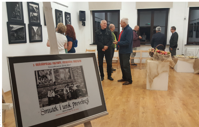
Wystawa fotografii w galerii Gminnego Ośrodka Kultury.

Tym sposobem, zainteresowani widzowie mogli uczestniczyć w wyjątkowo klimatycznych spotkaniach, obejmujących wernisaże przygotowane m.in. w galeriach Gminnego Ośrodka