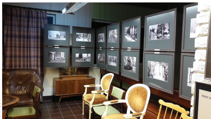
Wystawa fotografii w galerii Uzdrowiska.