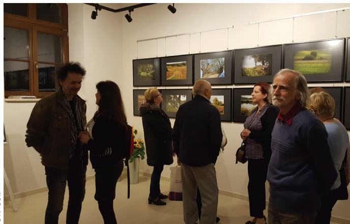
Wystawa fotografii w galerii "Starego Dworca".