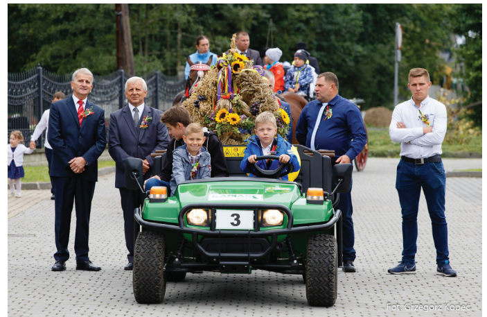
Korona Dożynkowa w asyście goczałkowskich rolników.