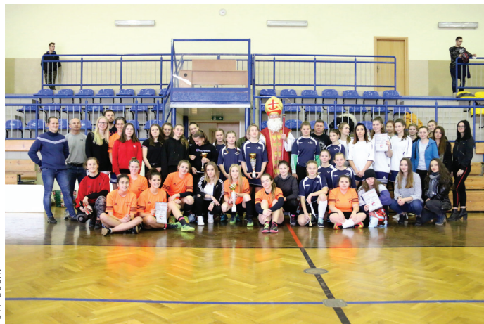
Na turnieju nie mogło zabraknąć samego św. Mikołaja, który dopingował drużyny.