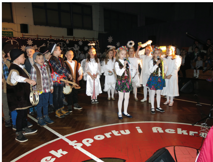
Koncert świąteczny z udziałem dzieci dostarczył wszystkim wielu wzruszeń.