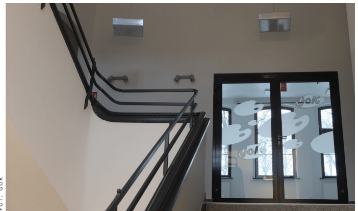
Widok na fragment korytarza na I piętrze budynku.

Ruszamy 7 stycznia, tuż po przerwie świątecznej.