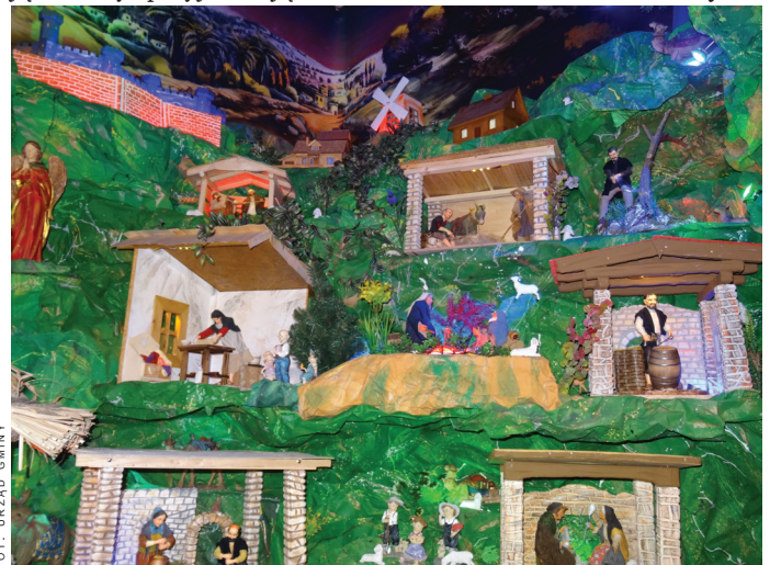
Część spośród ruchomych figur. Na zdjęciu widać m.in.: drwala i kobiety przy pracy.