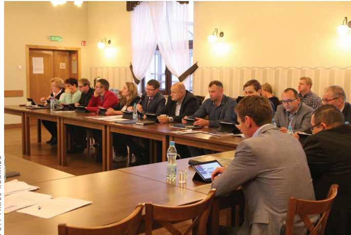
Podczas II sesji Rady Gminy.

Radni przyjęli też uchwałę określającą stawki podat-