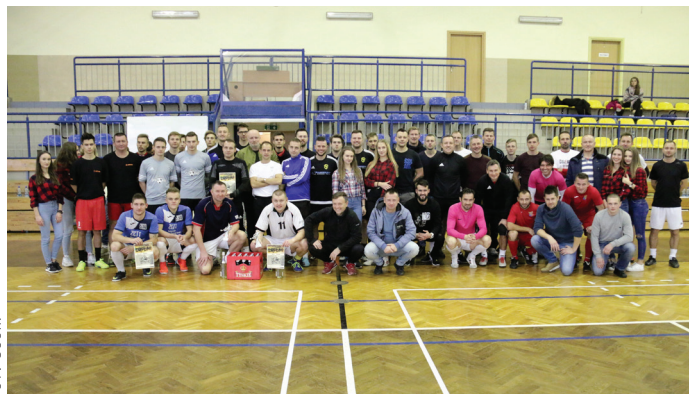
Na tegoroczne zawody w siatkonodze zgłosiło się 20 par.

Zawody organizowane przez Gminny Ośrodek Sportu i Rekreacji w Goczałkowicach-Zdroju przyciągnęły wielu zawodników z ciekawym piłkarskim życiorysem. Uczestnikami byli zawodnicy, którzy występowali na boiskach polskiej Ekstraklasy, medaliści Mistrzostw Polski i zdobywcy Pucharu Polski, mający za sobą grę w różnych reprezentacjach Polski czy w europejskich pucharach, ale również piłkarze i trenerzy znani z boisk ligowych niższych klas.