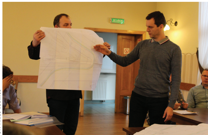
Podczas konsultacji rozmawiano na temat koncepcji przebudowy ul. Siedleckiej.

przedłużona do ul. Skłodowskiej w Pszczynie, w rejonie sie-