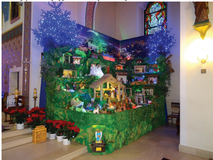
Stajenka w 2016 r. była pozbawiona nieba, które obecnie uzupełnia całość dekoracji.