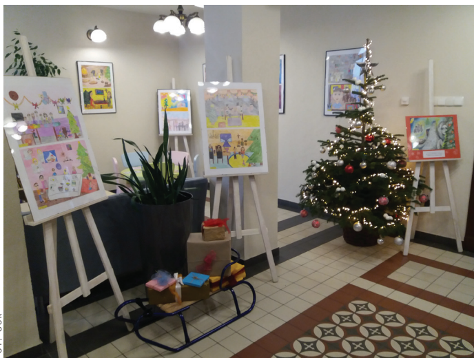
Wystawę można oglądać w galerii Starego Dworca na parterze.