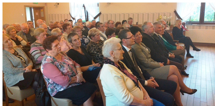
W jubileuszu wzięli udział członkowie koła oraz zaproszeni goście