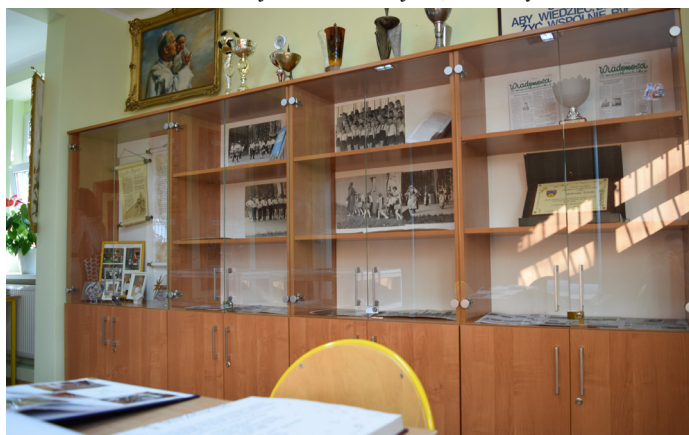
W SP nr 1 powstała sala pamięci, w której można podziwiać pamiątki po goczałkowickich szkołach.