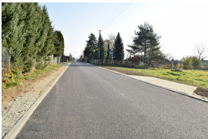
Ul. Sołeczka po przebudowie