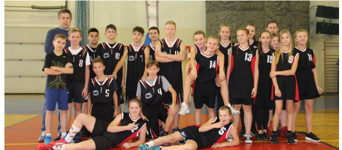
Reprezentacja SP nr 1 w Goczałkowicach

Klasyfikacja: 1. SP 6 Pszczyna, 2. SP 4 Pszczyna, 3. SP 1 Goczałkowice-Zdrój, 4. SP 1 Jaworze.