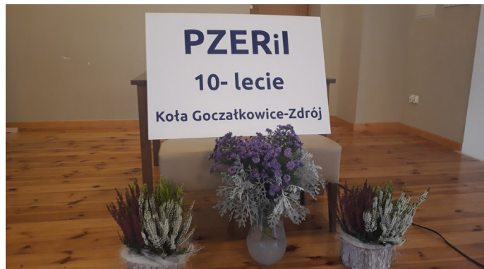
Jubileusz 10-lecia był okazją do podsumowania działalności koła

liwością aktywnego spędzania wolnego czasu na emeryturze.