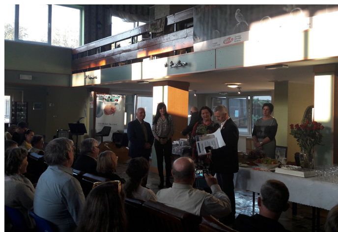
Wystawy w ramach IV Festiwalu Fotografii Ojczystej można obejrzeć do końca lipca w galeriach Starego Dworca, GOK-u oraz Uzdrawiska.