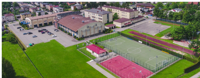
Nowe przedszkole powstanie przy kompleksie szkolno-sportowym przy ul. Wisławy Szymborskiej

Na podstawie opinii mieszkańców oraz analizy możliwych lokalizacji zdecydowano, że nowe przed-