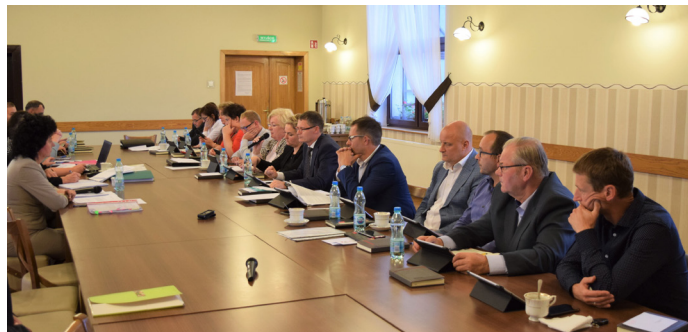
Uchwała została przyjęta podczas sesji Rady Gminy 29 października

„Proponowane regulacje rozwiązują co prawda problem dostępu do eksploatacji najważniejszych z punktu widzenia bezpieczeństwa energetycznego Państwa złóż węgla kamiennego i brunatnego, ale odbywa się to bez poszanowania prywatnej własności i interesów społeczności lokalnych, bez wiedzy o konsekwencjach oddziaływania przedsięwzięcia na środowisko, w sposób nakazowy. Zgodnie z projektem nowelizacji, przedsiębiorstwa górnicze przed uzyskaniem koncesji na wydobycie węgla, będą zobligowane do uzyskania decyzji ministra właściwego do spraw środowiska o utworzeniu „obszaru specjalnego przeznaczenia”, przy czym stroną tego postępowania w świetle proponowanego zapisu art. 42c ust. 2 będzie tylko i wyłącz-