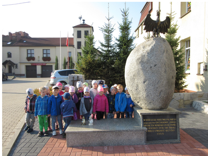
Dzieci przy mogile Powstańców Śląskich.

25 października 2019 roku przedszkolaki z grup Sowy i Wiewiórki udały się na cmentarz parafialny pod mogiłę Powstańców Śląskich - Fran-