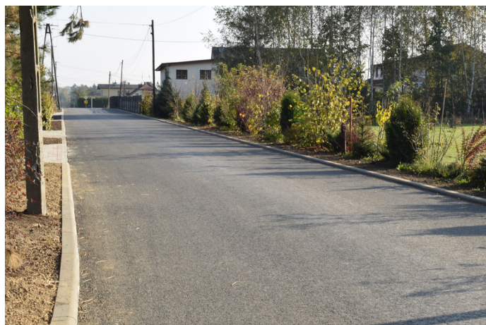
Ul. Solankowa po przebudowie