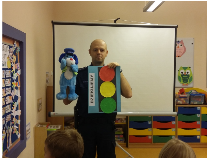
Gość przypomniał dzieciom m.in. zasady przechodzenia przez pasy.