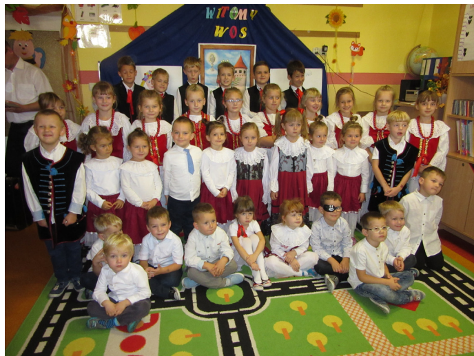
Przedszkolaki z członkami zespołu folklorystycznego.

W myśl tej zasady w Przedszkolu Publicznym nr 2 zorganizowano spotkanie z zespołem folklorystycznym działającym przy Szkole Podstawowej nr 1, który w większości, jak się okazało, składa się z wychowanków przedszkola. „Mali artyści” w pięknych śląskich strojach i przy dźwiękach akordeonu, zaprezentowali przedszkolakom śląskie piosenki wraz z układami tanecznymi. Przedszkolaki z wielkim zaciekawieniem wysłuchały