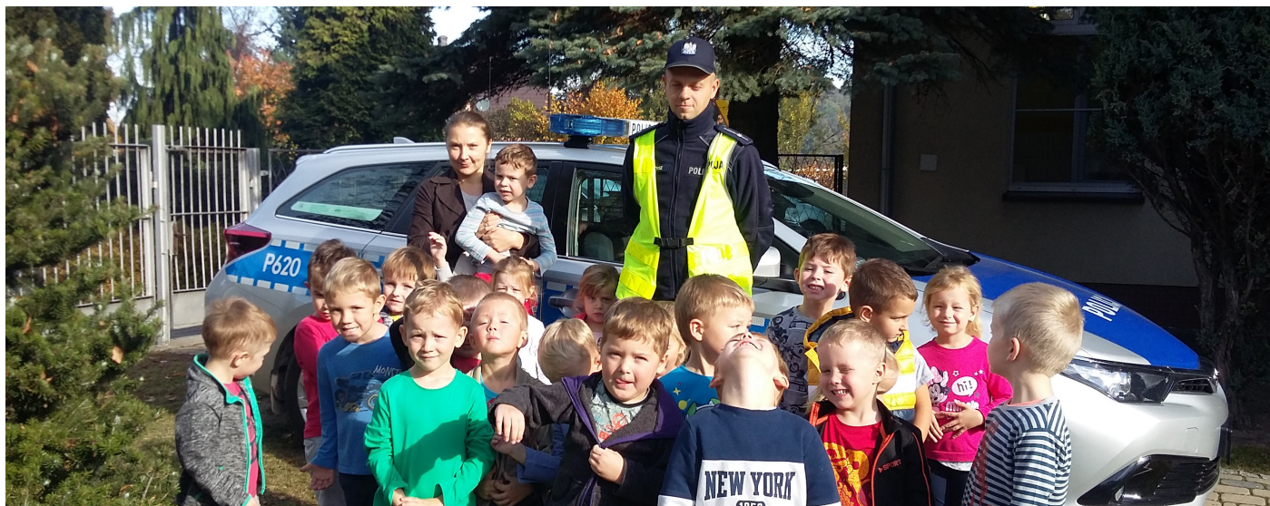
Przedszkolaki mogły obejrzeć radiowóz.