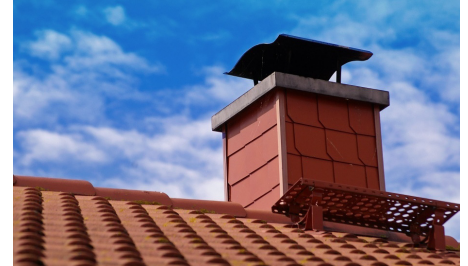
Prowadzenie kontroli palenisk to obowiązek gminy

Warto przypomnieć, że poza kontrolami wymaganymi przez Program ochrony powietrza, w gminie Goczałkowice-Zdrój prowadzone są też kontrole palenisk na podstawie zgłoszeń