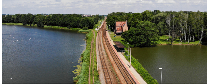
Cała inwestycja realizowana przez PKP PLK ma zakończyć się w 2023 r.

W ramach inwestycji zmodernizowana zostanie linia kolejowa Goczałkowice-Zdrój – Czechowice-Dziedzice – Zabrzeg. Projekt przewiduje wymianę prawie 47 km torów i 56 km sieci trakcyjnej. Na liniach zwiększy się prędkość pociągów osobowych do 160 km/h i towarowych do 120 km/h. Sprawniej pojadą pociągi na trasie z Katowic do Zebrzydowic i Wisły Głębce. Na kolejowym węźle Czechowice-Dziedzice