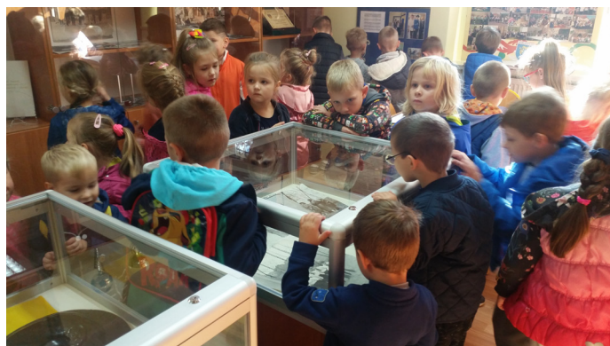
W Izbie Pamięci w Szkole Podstawowej nr 1.