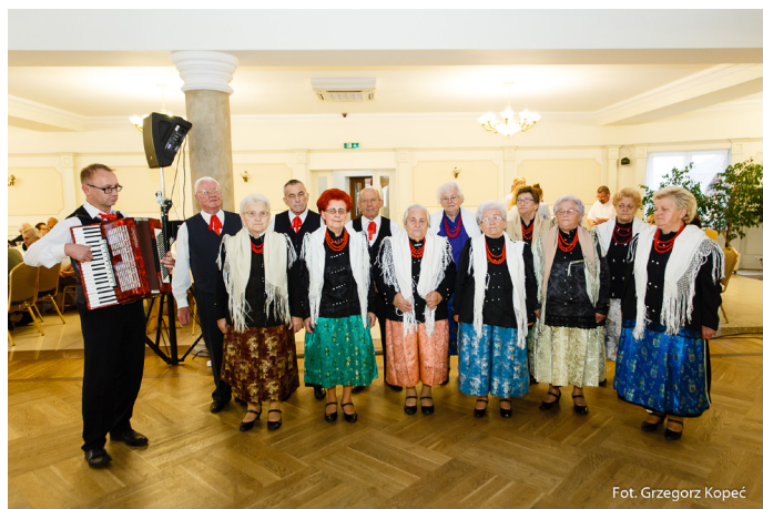
Przed Seniorami, tradycyjnie wystąpił Zespół Folklorystyczny Goczałkowice.