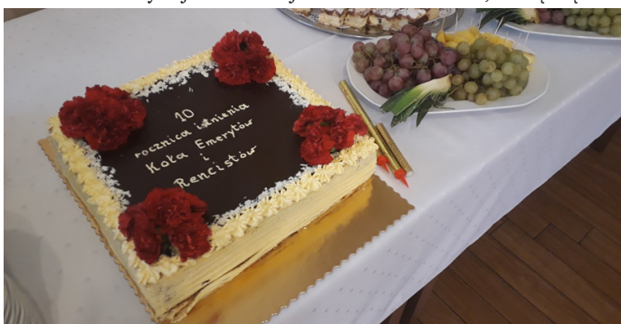
Na uroczystości nie mogło zabraknąć jubileuszowego tortu.

kilku osób, pośród których na szczególną uwagę zasługuje postać Małgorzaty Paszek oraz nieżyjącej już Heleny Wilczek. Początkowo świeżo utworzona filia zrzeszała wokół siebie 109 członków. Z czasem, dzięki ciężkiej pracy i pomysłowości liczba ta zaczęła sukcesywnie rosnąć, i na dzień dzisiejszy wynosi 235 osób, które czynnie uczestniczą w działaniach koła, ciesząc się moż-