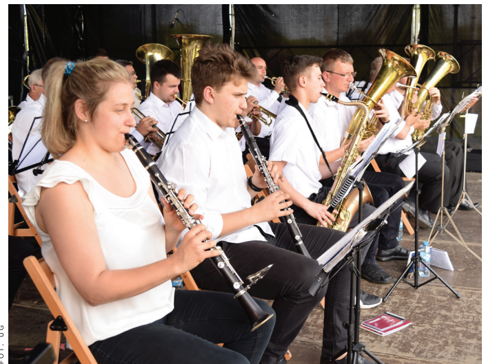
Występ Goczałkowickiej Orkiestry Dętej.

Za wspólną zabawę dziękują także współorganizatorzy: Gminny Ośrodek Kultury, Gminny Ośrodek Sportu i Rekreacji, Gminna Biblioteka Publiczna, Publiczne Przed-