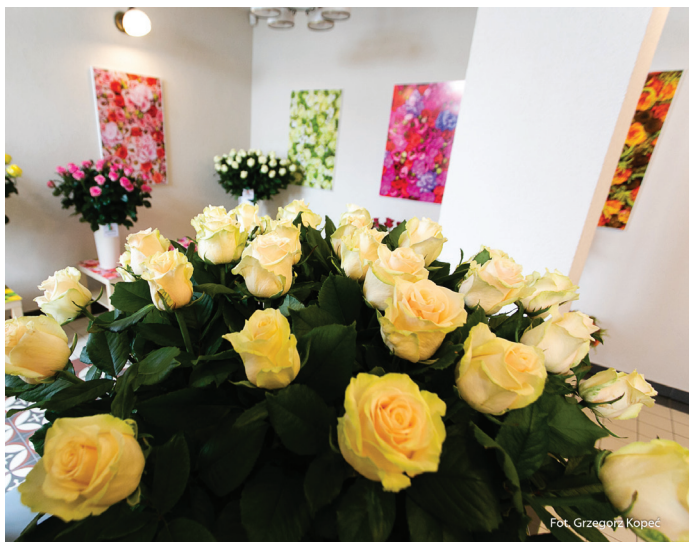
Festiwal Róż to przede wszystkim piękne kwiaty, których wystawę będzie można obejrzeć na "Starym Dworcu".

Lokalne gospodarstwa ogrodnicze po raz kolejny udowodnią, że róże to wyjątkowe kwiaty! W sobotę i niedzielę w godz. 10.00-20.00 na Starym Dworcu będzie można podziwiać zachwycające wystawy kwiatów. Ale to nie wszystko. Będą pokazy florystyczne, warsztaty florystyczne w Gminnym Ośrodku Kultury,