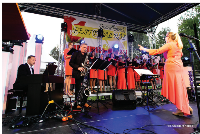
Co roku, w ramach imprezy odbywa się przegląd chórów amatorskich.