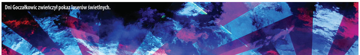
Dni Goczałkowic zwińczył pokaz laserów świetlnych.