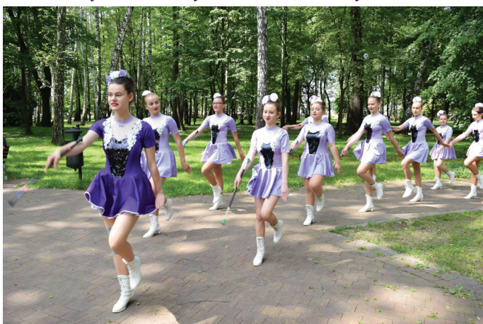
Na deptaku uzdrowskowym i w parku zaprezentowały się mażoretki "Nemezis".