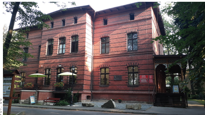
Budynek „Górnik” został odnowiony.