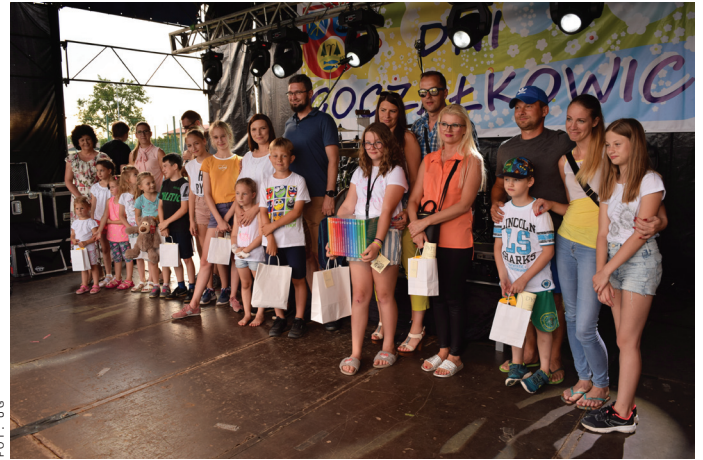
Już po raz VII w ramach Dni Goczałkowic zorganizowano Goczałkowickie Potyczki Rodzin.