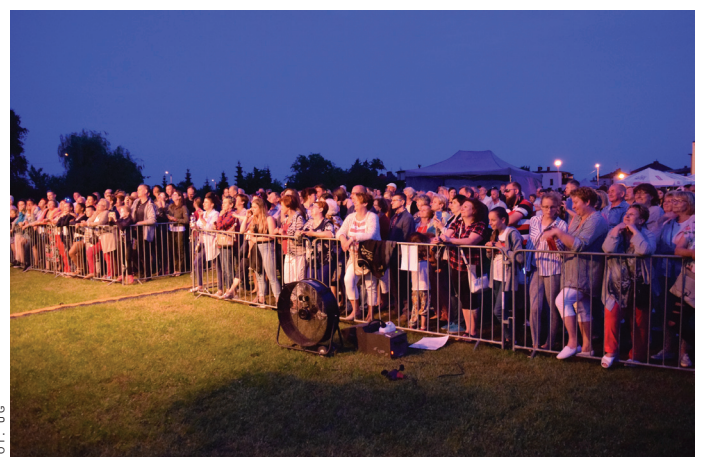
Publiczność świetnie się bawiła.