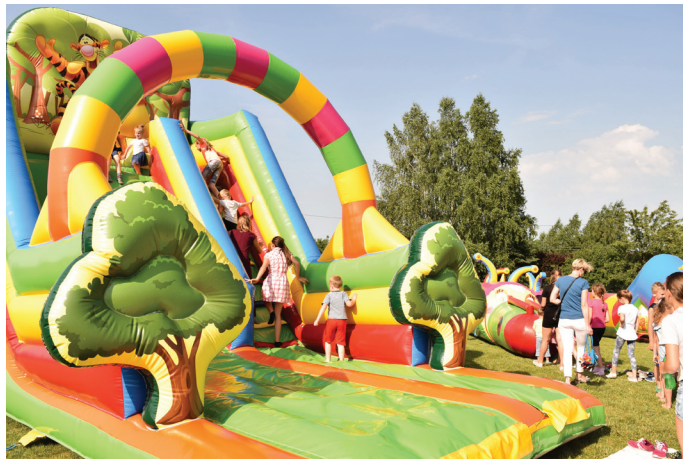
Na najmłodszych czekało wiele atrakcji, m.in. darmowe dmuchańce.