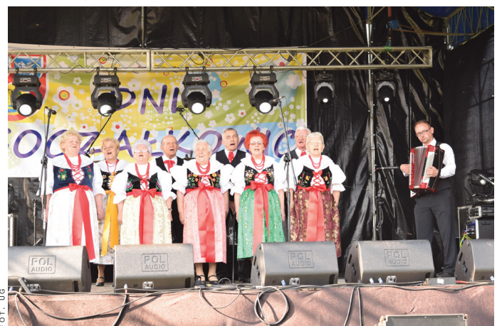
Na święcie gminy tradycyjnie zaprezentował się Zespół Folklorystyczny Goczałkowice.