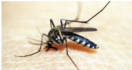
Jest sporo domowych sposobów na odstraszenie komarów.

Wiele osób twierdzi, że skutecznym sposobem na walkę z komarami jest odkomarzenie, którego często domagają się mieszkańcy. Rzeczywiście, wiele samorządów prowadzi takie zabiegi. W tym roku także w gminie Goczałkowice-Zdrój (w dniach 24-25 czerwca) przeprowadzona została akcja odkomarzenia terenów zielonych metodą naziemną. Specjaliści podkreślają jednak, że odkomarzenie należy przeprowadzać bardzo ostrożnie, bo – choć substancje zawarte w opryskach nie są szkodliwe dla ludzi – efektem może być nie tylko pozbycie się komarów, przy okazji giną też tak pożyteczne gatunki, jak np. pszczoły. Ponadto, zwraca się uwagę na to, że są takie ptaki, które potrafią zjeść dziennie nawet 20 tys. komarów, np. jerzyki. Dlatego warto pamiętać, że odkomarzenie realizowane przez samorządy nigdy nie będzie 100-procentowo skutecznym i całkowicie bezpiecznym zabiegiem przeciw komarom. Goczałkowice są gminą uzdrowiskową, dlatego najbardziej ekologicznym sposobem na walkę