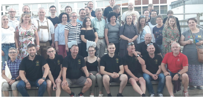
Do gminy partnerskiej pojechała 32-osobowa delegacja z Goczałkowic.