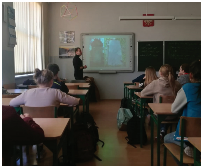
Dla uczniów przygotowano tematyczne warsztaty nawiązujące do historii Goczałkowicz.