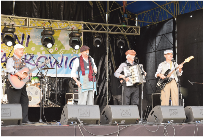
"Kapela z naszego miasteczka" zaprosiła widownię do wspólnej biesiady.