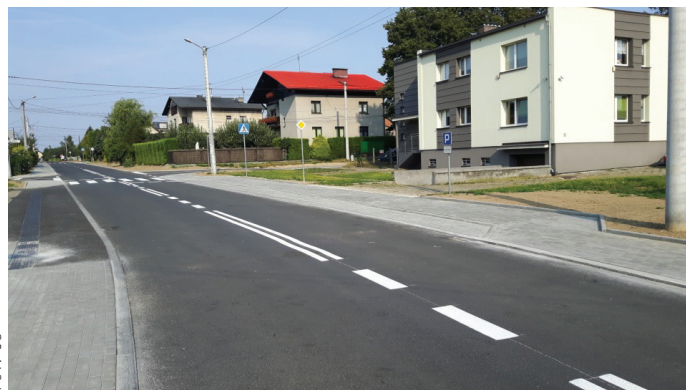
Ul. Korfantego, Żeromskiego po przebudowie.