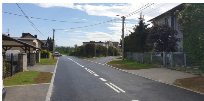
Przebudowa ul. Wiślniej zakończyła się w tym roku.

nych; realizacja Programu Ograniczenia Niskiej Emisji (kontynuowana w 2019 r.); projekty nowych zadań inwestycyjnych, tj. projekty dróg: ul. Siedlecka, łącznik ulic Borowinowa-Zielona, centrum przesiadkowe (zadania w trakcie realizacji).