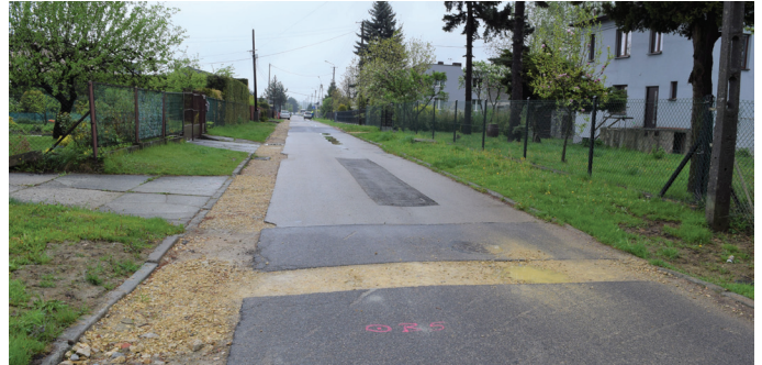
Ul. Sołecka zostanie przebudowana.

natomiast remont ul. Zielonej. Prace na odcinku ok. 300 mb tej drogi powiatowej realizować będzie Powiatowy Zarząd Dróg, ale środki na inwestycję przekazała gmina Goczałkowice-Zdrój. Jest ona niezwykle ważna, bo ul. Zielona stanowi istotny ciąg komunikacyjny, będący dojazdem do uzdrowiska.