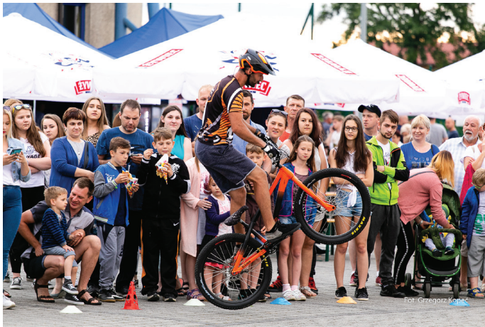
Jedną z atrakcji tegorocznych obchodów było pokazy akrobacji rowerowych.