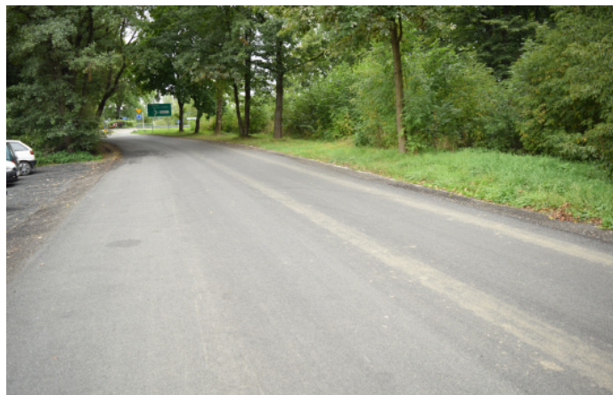
Remont tej drogi powiatowej był sfinansowany przez gminę Goczałkowice-Zdrój