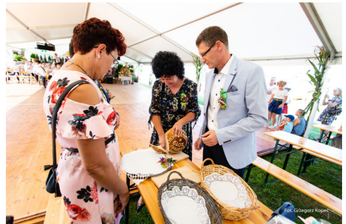
Dożynkowy chleb został pokrojony.