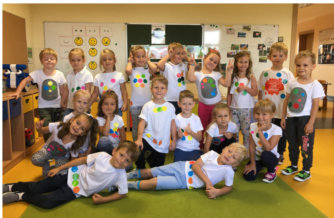
Dzieci świętują Dzień Kropki