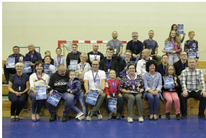
W akcji udział wzięło 73 uczestników

GOSiR informuje, że osoby, które nie odebrały swoich upominków, mogą to zrobić w godzinach pracy krytej pływalni. Upominki są do odbioru w kasie.