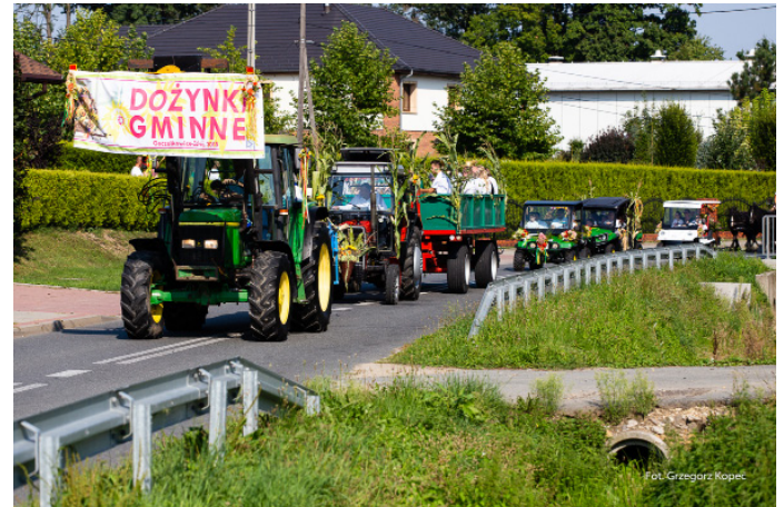
W korowodzie można było podziwiać dawne traktory oraz maszyny rolnicze.