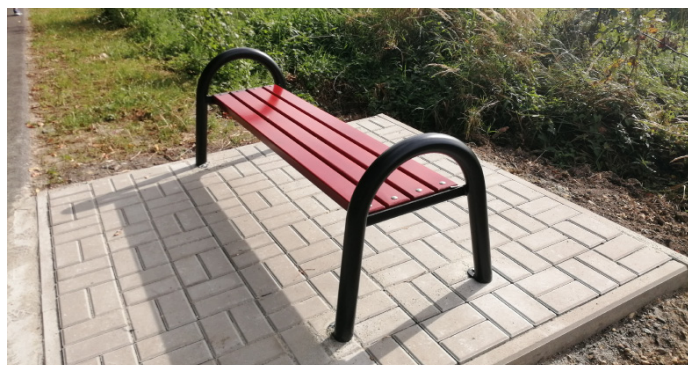
Jedna z nowych ławek