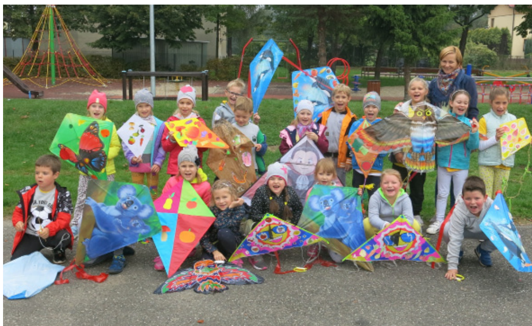
W ramach pożegnania lata, na szkolnym boisku uczniowie klas młodszych puszczali kolorowe latawce.

Kończy się lato w przepych bogate I zmienia, zmienia piękną swą szatę. Drzewa po świeżej, bujnej zieleni Wdziękują złote barwy jesieni. Pogodnie, cicho i uroczyście Spływają z wolna na ścieżkę liście, A gdy śpieszymy do szkoły drogą, Rażno szeleszczą, szumią pod nogą. Leopold Staff „Jesienne liście” [fragm.]