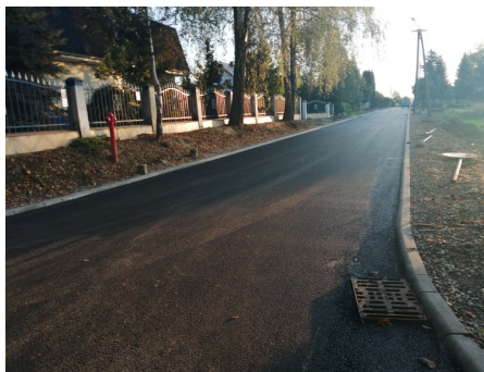
Pierwsze warstwy asfaltu na ul. Sołeckiej

Zakres prac na ul. Solankowej obejmuje przebudowę drogi na długości ok. 280 mb, o szerokości jezdni 5 mb, a także przebudowę odcinka ul. Rolnej na długości ok. 90 m. Wybu-