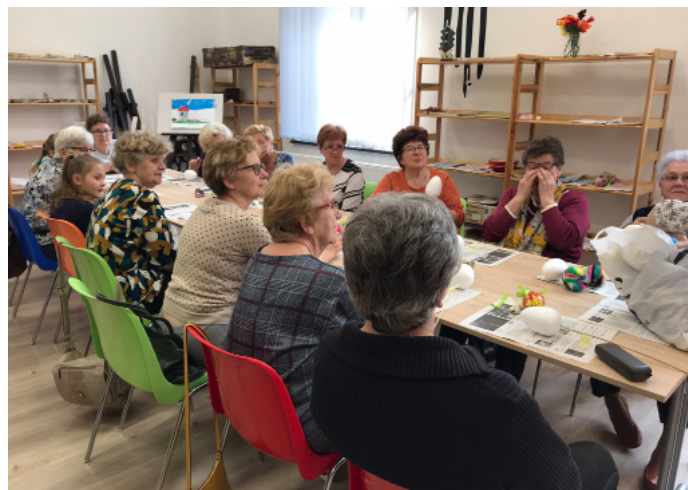
Klub Seniora oferuje wiele ciekawych zajęć, m.in. artystycznych.

Działalność Klubu Seniora cieszy się dużym zainteresowaniem wśród mieszkańców gminy. W ramach projektu seniorzy i seniorki mogą brać udział w interesujących zajęciach. W Klubie Seniora zajęcia odbywają się według miesięcznego harmonogramu, każdy