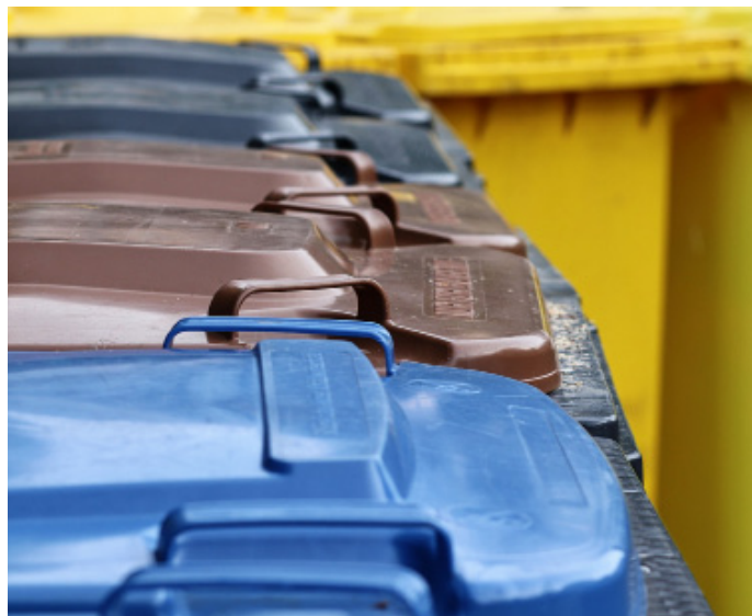
Nowa umowa ma obowiązywać od przyszłego roku.