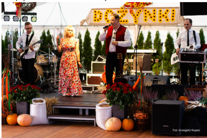
Duet Karo zaprosił do wspólnej zabawy przy śląskich szlagierach