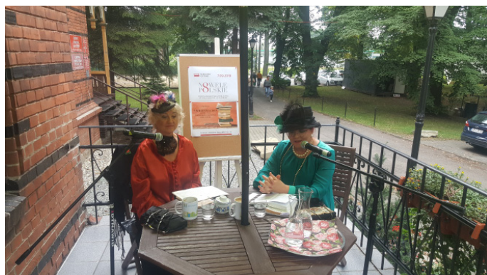
Narodowe Czytanie, to akcja która propaguje czytanie literatury polskiej.

Na goczałkowickiej werandzie, przy siedzibie biblioteki aktorki Teatru Polskiego w Białymostku zaprezentowały trzy spośród możliwych do wyboru utworów. Zebrani mogli zapoznać się z treścią „Katarzynki” Bolesława Prusa, „Dymu” Marii Konopnickiej, opowiadającego losy miłości matki do syna i trudach pracy w fabryce oraz „Sachema” Henryka Sienkiewicza, opisującego dramatyczne