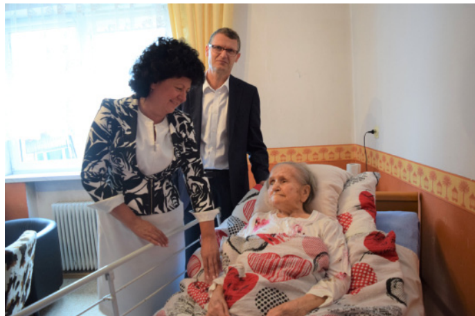
Najstarszą mieszkankę gminy w dniu urodzin odwiedzili wójt gminy i przewodniczący Rady Gminy

Setne urodziny to wyjątkowe święto – w rodzinie pani Małgo-