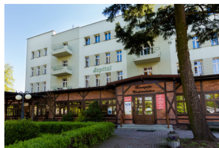
Goczałkowice nadal pozostaną gminą uzdrowiskową

śnia br. minister zdrowia potwierdził spełnienie przez obszar uzdrowiska Goczałkowice-Zdrój wymagań określonych w ustawie. – To ważna dla nas decyzja, ponieważ jako gminie uzdrowiskowej zależy nam na tym, aby w Goczałkowicach prowa-