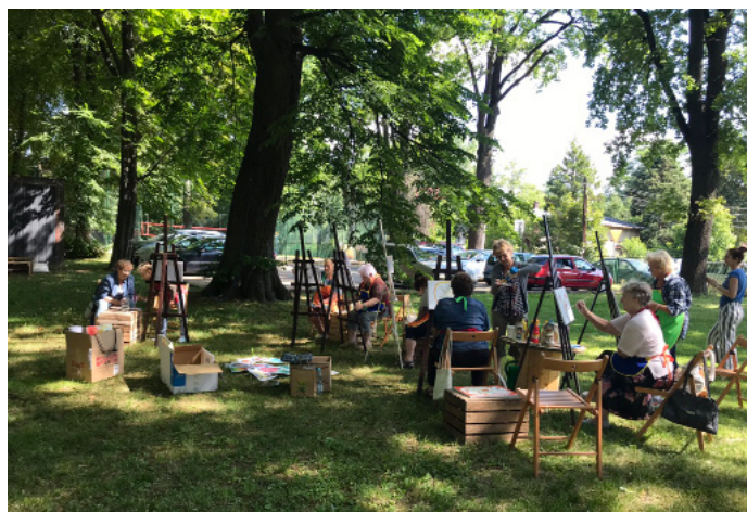
W trakcie letnich wakacji Seniorzy uczestniczyli w plenerze malarskim.

Zarząd Koła Emerytów Rencistów i Inwalidów w Goczałkowicach Zdroju