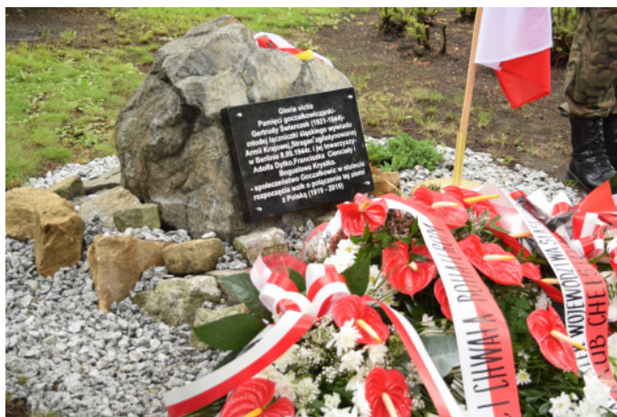
Tablica znajduje się w centrum uzdrowiska, w pobliżu wejścia do szpitala