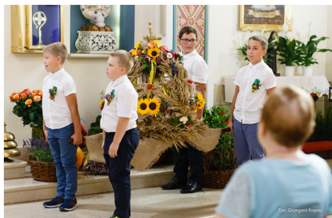
W upiększenie dożynek zaangażowali się także najmłodszy mieszkańcy.