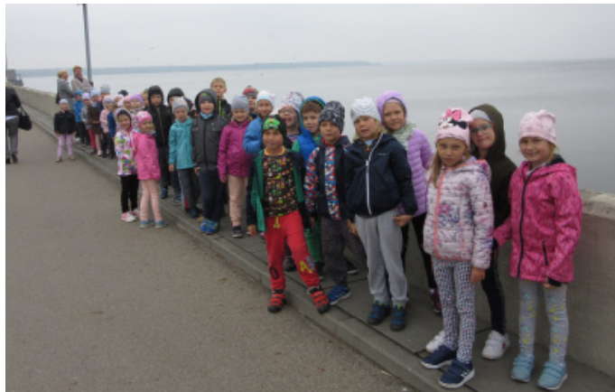
Podczas wycieczki na zaporę

W Centrum Edukacyjnym czekał już na nas przewodnik, który pokrótce zapoznał przedszkolaków z rolą zbiornika goczałkowic-