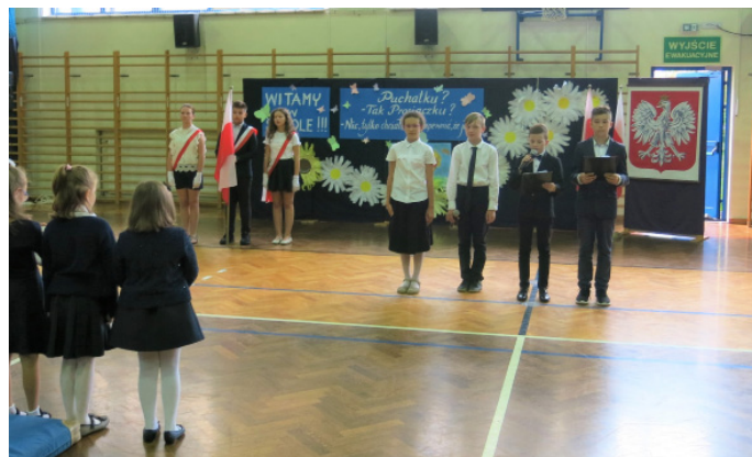
2 września rok szkolny w SP nr 1 w Goczałkowicach rozpoczęło 505 uczniów

Tradycyjnie przywitanie nowego roku szkolnego odbyło się na uroczystej akademii przygotowanej przez uczniów klas VI z wychowawcami. Podczas akademii uczczono 80. rocznicę wybuchu II wojny świato-