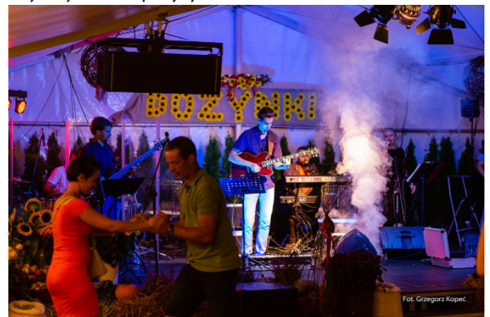
Wieczorem odbyła się zabawa taneczna z zespołem „Rytmmika”.