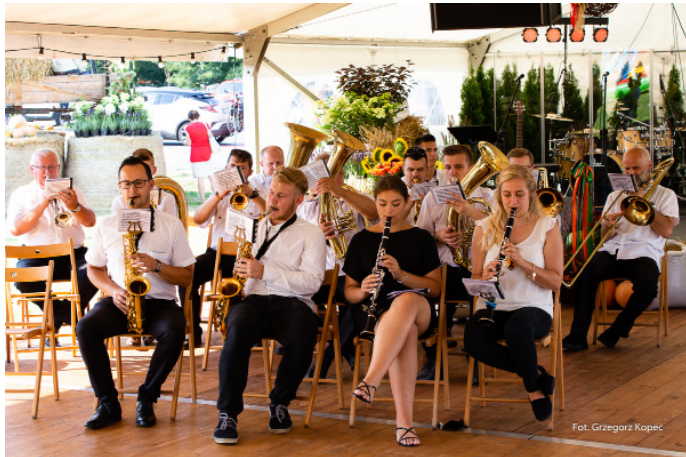
Gości przywitała Goczałkowicka Orkiestra Dęta.