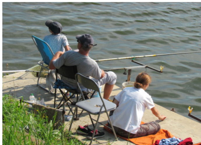
Spławikowe Zawody Wędkarskie to okazja do doskonałej zabawy zarówno dla dzieci, jak i dorosłych, którzy towarzyszą swym pociechom.