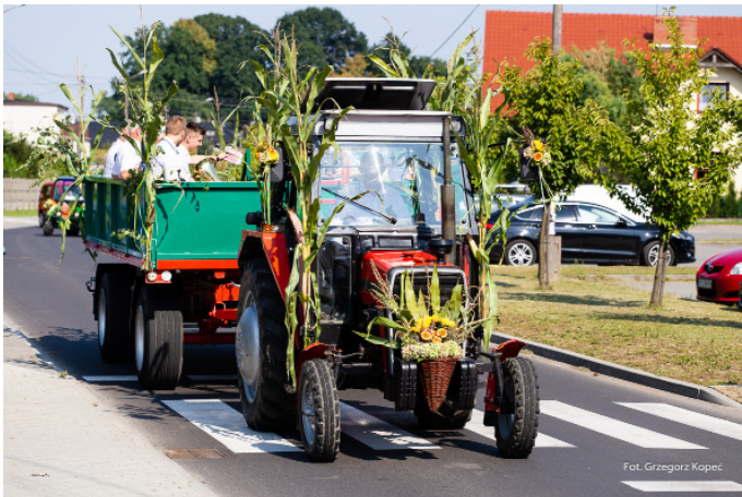
Po mszy św. korowód przejechał na teren przy barze „Makuś”.