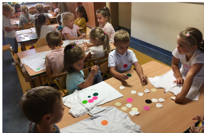
W tym dniu przygotowano wiele kreatywnych zajęć