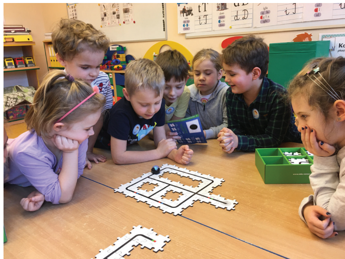
Przedkolaki podczas zajęć

Innowacja „Zakodowane piątki” wzbogacona jest o działania z ogólnopolskiego programu „Uczymy Dzieci Programować”, do którego nasze