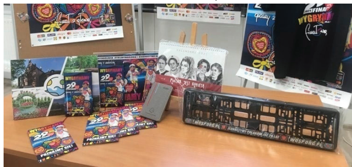
Na licytacjach można było zdobyć wiele cennych przedmiotów