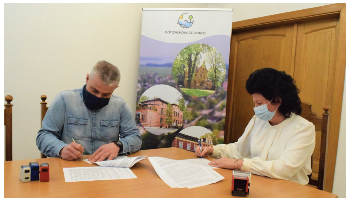
Wartość inwestycji to ponad 2,1 mln zł

przetarg na wykonanie robót wygrała firma Brigadon z Jaworzna. Prace kosztować będą 2 mln 113 tys. 500 zł.