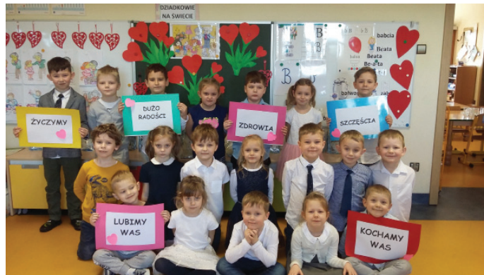
Z najlepszymi życzeniami dla babć i dziadków (Fot. PP 1)

„Moja babcia i mój dziadek to wspaniali są dziadkowie!” – te słowa rozbrzmiewały w całym przedszkolu tuż po powrocie dzieci z odpoczynku, jakim były ferie zimowe. Bo to właśnie w zimowy styczeń wpisane są wyjątkowe dni, które wzbudzają ogromne, radosne emocje. To święto Babci i Dziadka. Wszystkie przedszkolaki wiedziały i oczekiwały tego dnia. Wiadome jest, że Dziadkowie to wielki skarb dla wnuków, oni czynią ich dzieciństwo bardziej pełnym, udanym i szczęśliwym. Babcia i dziadek mają zawsze dla nich czas, umieją pocieszyć, są cierpliwi, zawsze rozumieją ich dziecięce rozterki, ale