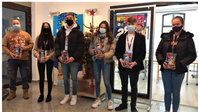
W Goczałkowicach kwestowało ośmioro wolontariuszy

Sztab 329 przy GOK w Goczałkowicach-Zdroju.