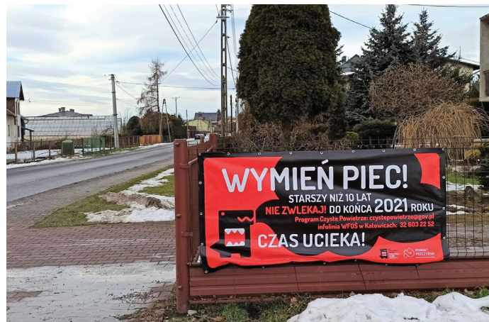
Na terenie gminy pojawiły się banery informujące o konieczności wymiany starych kotłów

ski Alarm Smogowy Nie Dokarmiaj Smoga, zostały przekazane przez powiat pszczyński.