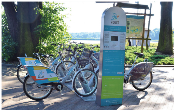
W Goczałkowicach ponownie będą dwie stacje: przy Starym Dworcu oraz przy koronie zapory

– Poprzednie 3 sezony funkcjonowania wypożyczalni pokazały, że cieszy się ona dużym zainteresowaniem zarówno mieszkańców, jak i turystów. W tym czasie w Pszczynie i Goczałkowicach