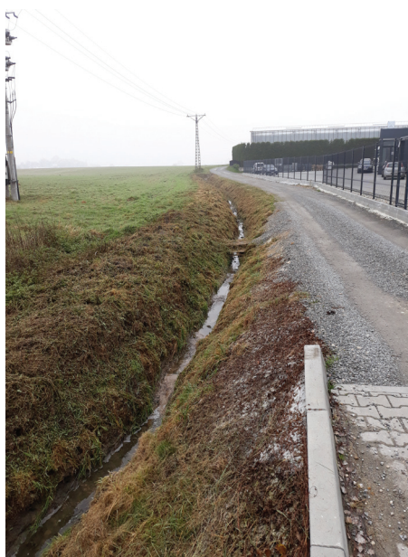
Rów przy Zakładach Mięsnych