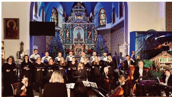
UG Koncert można obejrzeć w internecie

Koncert noworoczny z udziałem chóru parafialnego Semper Communio, zespołu Moonlight Band oraz kwartetu smyczkowego Escape został opublikowany na stronie internetowej Urzędu Gminy – goczalkowicezdroj.pl oraz Gminnego Ośrodka Kultury – gok.goczalkowicezdroj.pl.