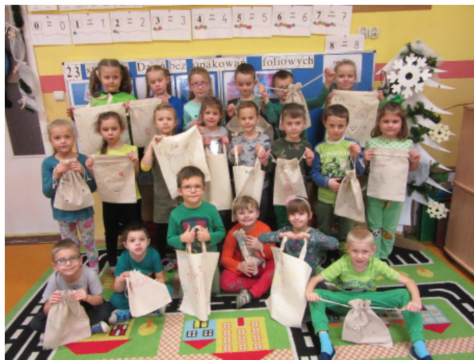
Dzieci wiedzą, jak ponownie wykorzystać opakowania z tworzyw sztucznych

zywały zagadki, słuchały wierszy, oglądały prezentowane ilustracje i zdjęcia zdegradowanego środowiska wodnego – wyciągały wnioski, segregowały elementy, brały udział w zabawach ruchowych. Trzeba przyznać, że świadomość ekologiczna naszych podopiecznych jest imponująca. Kiedy szukano rozwiązania na foliowe jednorazówki, dzieci wskazały wykorzystanie artykułów wielokrotnego użytku, jak koszyki wiklinowe, płócienne i lniane torby, siatki na zakupy, torby ekologiczne – biodegradowalne, a także ponowne wykorzystywanie reklamówek jako worków na śmieci.