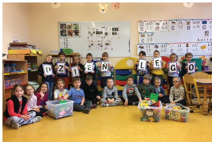
Dzieci miały świetną zabawę podczas zajęć z LEGO

działalności wykorzystywaliśmy właśnie LEGO. Usprawniając koordynację wzrokowo-ruchową i sprawność manualną,