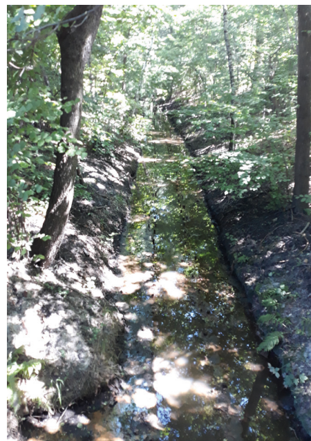
Rów Kanar

2. Wykonanie konserwacji gruntownej KANARU na długości 610,0 mb od ulicy Polnej w kierunku Zapory – usuwanie namułu dna średnią warstwą 0,4 m