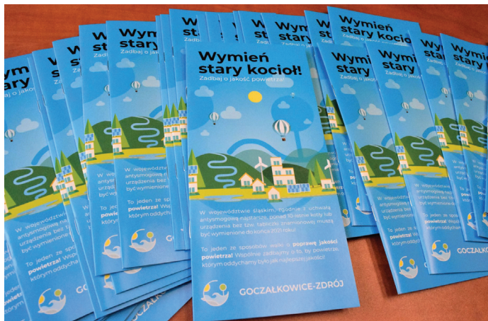
Broszury wydane przez Urząd Gminy to cenne źródło informacji na temat możliwości walki ze smogiem

mieszkańcy będą mogli skorzystać z dofinansowania do 80% i wymienić 104 kotły na ekologiczne. W ramach tego etapu planowane są również docieplenie ścian 10 budynków, docie-