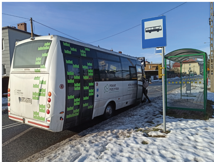
Linia jest współfinansowana przez gminę Goczałkowice-Zdrój

26 stycznia Rada Gminy Goczałkowice-Zdrój przyjęła