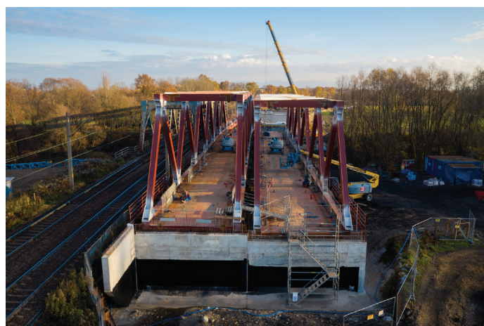
Prace na moście nad Wisłą, zdjęcie z listopada 2020 r.

Co istotne, modernizacja będzie połączona z realizowaną przez gminę Goczałkowice budową centrum przesiadkowego. W kolejnym eta-