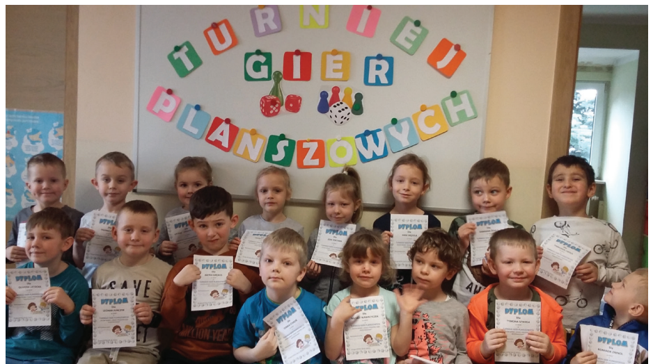
Gry planszowe to świetna rozrywka

Dzieci z grupy „Kotki” doskonaliły wszystkie te umiejętności w czasie trwającego tygodnia gier planszowych. Kotki miały okazję grać zarówno w parach, jak również w zespołach, dzięki czemu zaczęły rozumieć rolę odpowiedzialności za sukces drużyny. Dzieci nie tylko grały w gotowe gry planszowe, ale również same je tworzyły. Malowały ogromną planszę, ustawiały pułapki, wyklejały lub kolorowały