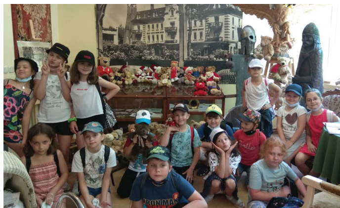
Dzieci mogły podziwiać różnego rodzaju misie