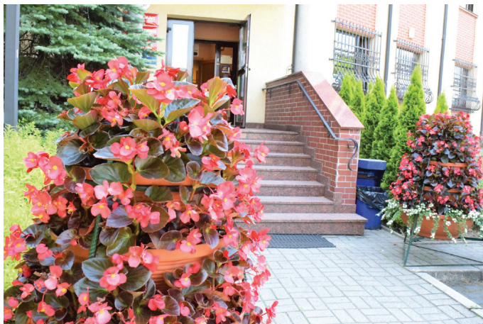
Kolorowo zrobiło się także przed urzędem