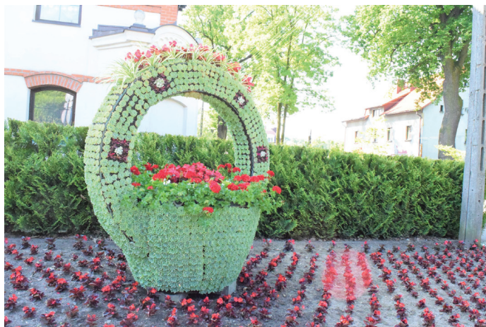
Kosz z pałąkiem przy Rondzie pod Bocianem