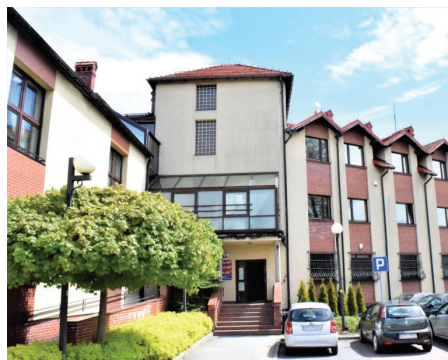
Punkt jest czynny przez trzy dni w tygodniu

Punkt został uruchomiony na mocy porozumienia zawartego pomiędzy gminą Goczałkowice-Zdrój a Wojewódzkim Funduszem Ochrony Środowiska i Gospodarki Wodnej w Katowicach. W Urzędzie Gminy