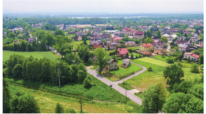
Gmina Goczałkowice-Zdrój konsekwentnie realizuje kolejne działania na rzecz poprawy jakości powietrza

Największym problemem jest benzo(a)piren. Wartość docelowa to 1 ng/m 3 , ale na wszystkich stacjach na Śląsku odnotowano przekroczenie tego zanieczyszczenia. – Główna przyczyna zanieczyszczenia powietrza w województwie śląskim jest jednoznaczna. To emisja z indywidualnego ogrzewania budynków mieszkalnych. W przypadku benzo(a)pirenu aż w 97% oddziałuje na złą jakość powietrza. W przypadku pyłu PM 2,5 to 81%, pyłu PM 10 – 68%. Inne przyczyny to transport, emisja punktowa, czyli z zakładów przemysłowych, hałd czy wyrobisk – zauważył A. Szczygieł. Zaapelował o realizację niezwykle ważnego zadania, jakim jest likwidacja do końca 2021 roku palenisk węglowych, które w 2017 r. miały 10 lat lub więcej i nie miały tabliczki znamionowej, zgodnie z uchwałą antysmogową. Jak podkreślił specjalista, różnica w jakości powietrza będzie odczuwalna. – Dotychczasowe działania prowadzone od 2010 r. i bardziej intensywne