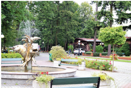
Uzdrowisko ma wiele planów na rozwój działalności