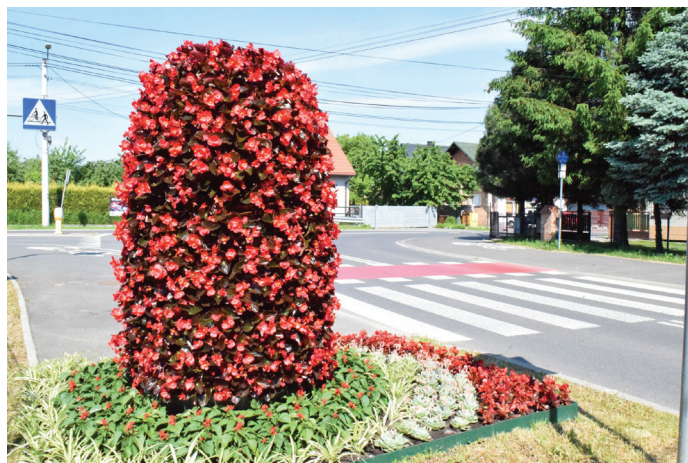
Piękna kompozycja przy zjeździe na zapórę