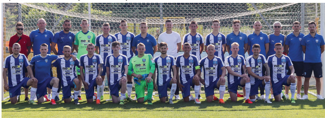
LKS Goczałkowice-Zdrój po pierwszym sezonie w III lidze