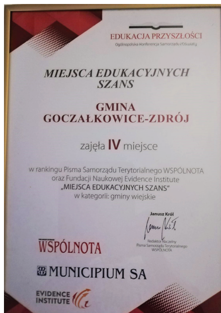
Goczałkowice zajęły wysokie miejsce w kolejnym prestiżowym rankingu

W rankingu zostały ujęte również dane z Głównego Urzędu Statystycznego. Szacując każdą składową rankingu wzięto pod uwagę dochody własne gmin w przeliczeniu na mieszkańca oraz procent osób bezrobotnych. W ten