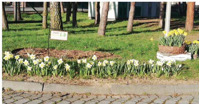
Rośliny zasadzone przy szkole w ramach akcji „Znaki Nadziei”