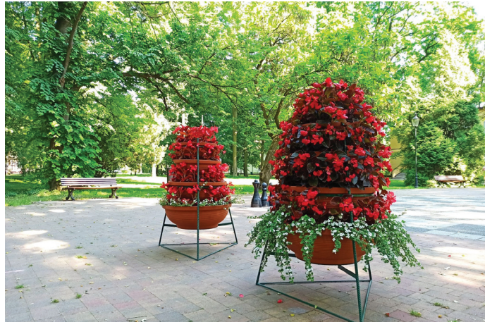
Kompozycje kwiatowych nie mogło zabraknąć w Parku Zdrojowym