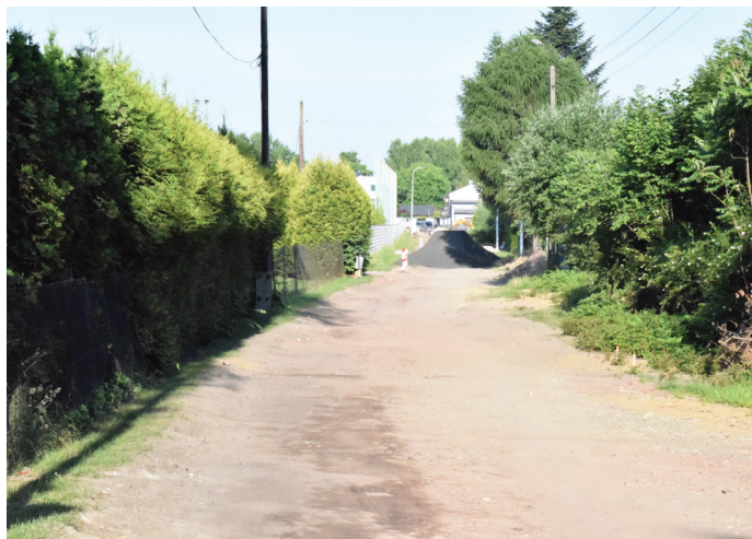
Ul. Krzyżanowskiego jest rozbudowana na długości 235 mb

Postępy widać też na budowie zbiornika retencyjnego przy ul. Zimowej. Zakończono już budowę kanalizacji deszczowej od ul. Głównej do budowanego zbiornika. Zbiornik jest wykopany w 75 procentach. Nadal