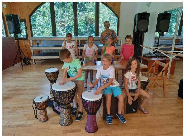
Warsztaty Perkusyjne były nowością w dotychczasowej ofercie GOK-u