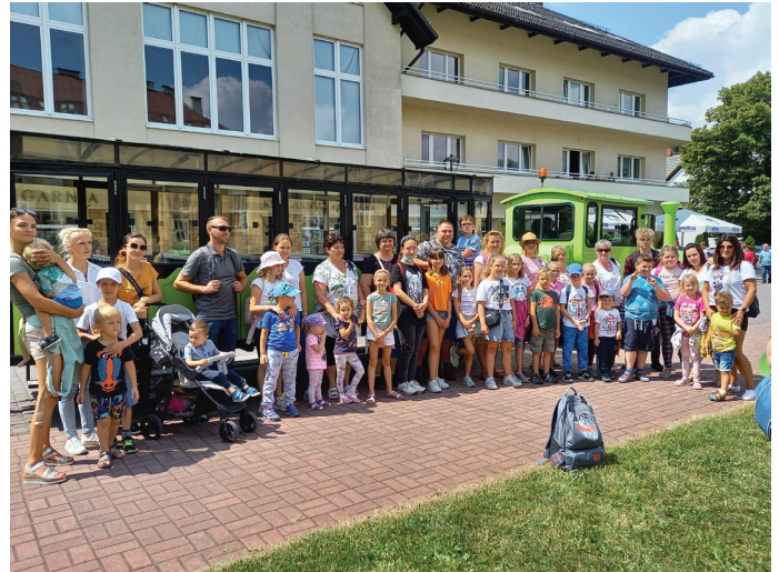
Jedną z wakacyjnych propozycji była przejażdżka Ciuchcią Wiślańską