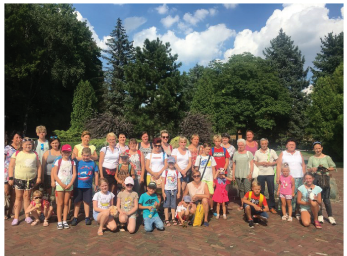
Na zakończenie zorganizowano wyjazd do ZOO w Chorzowie