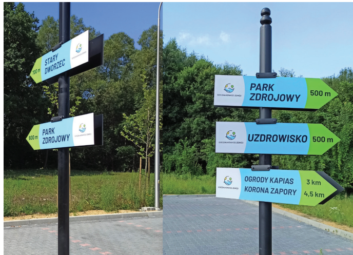
Tabliczki na parkingu przy łączniku kierują na atrakcje turystyczne