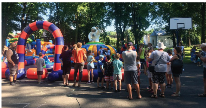
Wakacje powitano na boisku przed siedzibą GOK-u