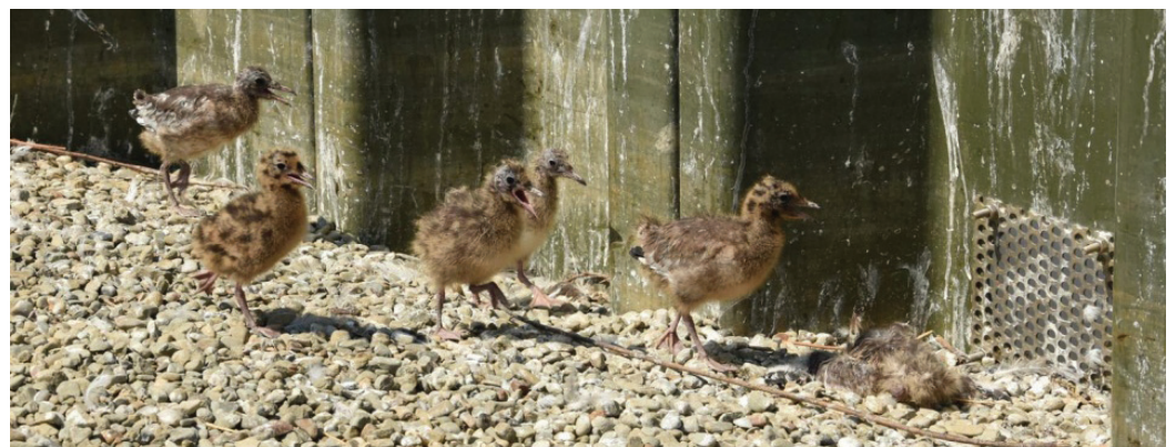
Pisklęta mewy śmieszki na nowej wyspie

W maju jako pierwsze na sztucznej wyspie swoje gniazda zaczęły budować śmieszki. W sumie dotąd gniazdowało tam ponad 200 par tej mewy. Rybitwy rzeczne również stwierdziły, że jest to dobre miejsce do lęgów i w czerwcu stwierdzono tam ponad 20 par lęgowych. Niespodziewanym gościem już w pierwszym roku istnienia wyspy okazała się rzadka mewa czarnogłowa. W Polsce gniazduje tylko 50-80 par tego gatunku, z czego