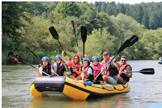
W imprezie udział wzięło 57 osób