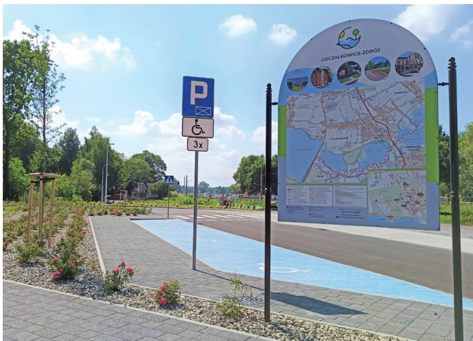
Tablica z mapami miejscowości na centrum przesiadkowym