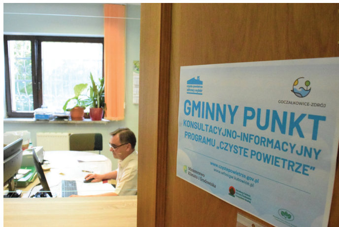
Punkt znajduje się na parterze Urzędu Gminy

Program „Czyste Powietrze” jest skierowany do właścicieli lub współwłaścicieli jednorodzin-