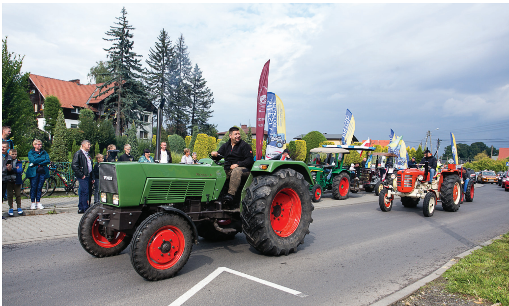
Korowód dożynkowy uświetnił przejazd Stowarzyszenia Miłośników Starych Traktorów i Maszyn Rolniczych "Silesia Traktor"

Goczałkowice dalej będą się rozwijały – przyznała. Dożynkowym chlebem podzielono się z uczestnikami święta plonów.