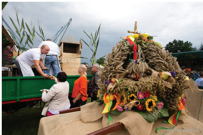
Korona Dożynkowa - wykonana ze zbóż zebranych z goczałkowickich pól