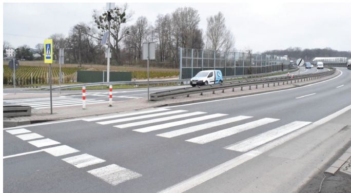
To przejście dla pieszych już nie istnieje

O zamiarze zlikwidowania przejścia informowaliśmy już w kwietniu br. W połowie listopada 2020 roku GDDKiA przeprowadziła pomiary ruchu pieszych na przejściu dla pieszych w rejonie skrzyżowania z ul. Borowinową. Obserwowano ruch w ciągu dwóch dni, w godz. 6.00-9.00 oraz 14.00-17.00. W wyniku badań, jednego dnia na przejściu zareje-