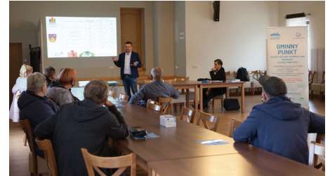
Podczas spotkania informacyjnego nt. programu „Czyste Powietrze”

Jednocześnie przypominamy, że mamy coraz mniej czasu na wymianę najstarszych kotłów! Od 1 września 2017 r. na terenie województwa śląskiego obowiązuje Uchwała Sejmiku Województwa Śląskiego z dnia 7 kwietnia 2017 r. w sprawie wprowadzenia na obszarze województwa śląskiego ogra-