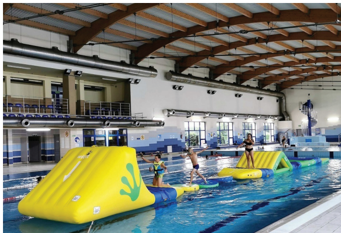
Na „Goczuś” dostępny był wodny tor przeszkód