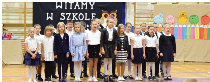
Podczas inauguracji roku szkolnego w SP nr 1