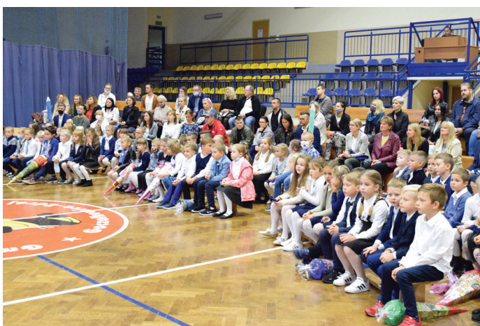
Rok szkolny rozpoczęło 64 pierwszoklasistów