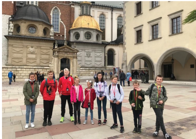
Klub Środowiskowy z wizytą w Krakowie.

Oprócz powyższych działań, w programie uruchomione zostały specjalistyczne usługi opiekuńcze i asystenta osoby niepełnosprawnej, które pośród lokalnej społeczności cieszyły się