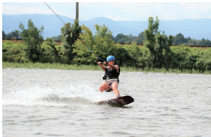
W sierpniu zorganizowano zajęcia na WakeParku