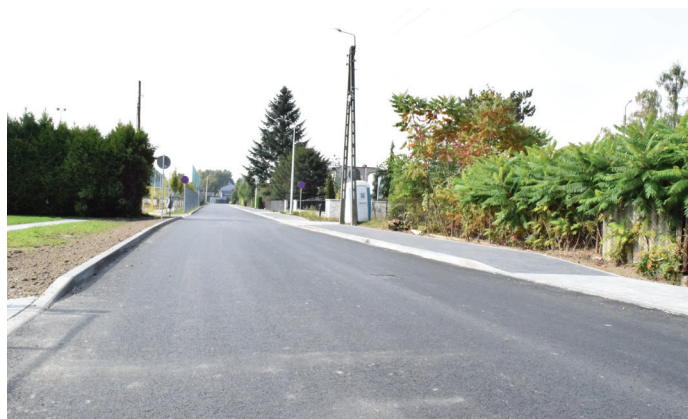
UG Droga już po zakończeniu prac

Inwestycja była realizowana w ramach drugiego etapu budowy centrum przesiadkowego. Prace za ponad 953 tys. zł wykonała Firma Handlowo-Usługowa „Diego” z Wisły Małej, która wygrała przetarg ogłoszony przez Urząd Gminy.