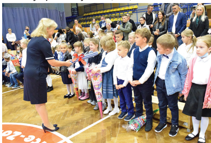
Uroczyste pasowanie na ucznia