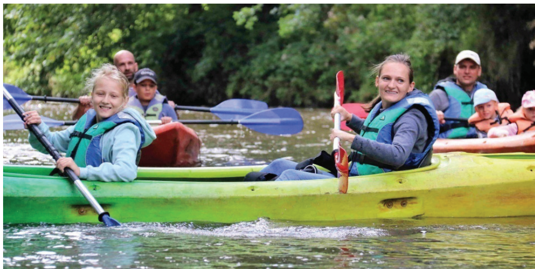
W wycieczce udział wzięły 52 osoby

Mimo że niektórzy po raz pierwszy brali udział w spływie kajakowym, trasa nie sprawiła większych kłopotów. Naturalne przeszkody w postaci przewróconych drzew, które są dziełem zamieszkałych na rzece bobrów stanowiły dodatkowe atrakcje w czasie spływu, a uczestnicy nawet z tym poradzili sobie perfekcyjnie.