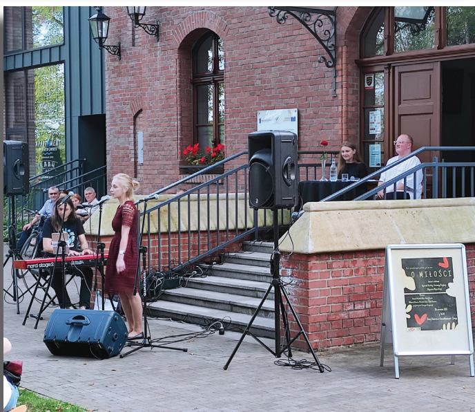
Wspaniały koncert odbył się przed Starym Dworcem