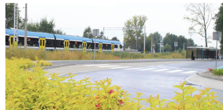
Biletomat będzie dużym ułatwieniem dla podróżujących

Urządzenie pojawi się dopiero po zakończeniu inwestycji kolejowej oraz po wybudowaniu przejścia podziemnego łączącego oba perony. Prace prowadzone są przez PKP PLK. Spółka informuje, że mają potrwać do końca przyszłego roku.