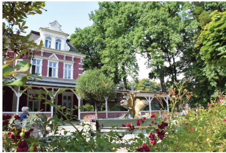
Goczałkowice znalazły się wśród finalistów konkursu!

Po raz pierwszy do konkursu zgłosiły się: Goczałkowice-Zdrój i Brześć Kujawski, a także Kraków-Swoszowice, który jest jedy-