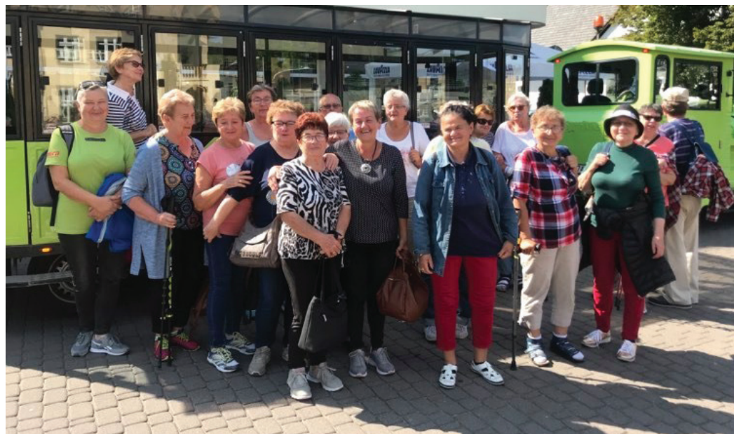
Wycieczka seniorów Ciuchcią Wiślańską po stolicy Beskidu Śląskiego