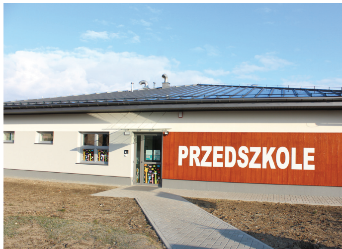
Przedszkole znajduje się w sąsiedztwie basenu i szkoły podstawowej