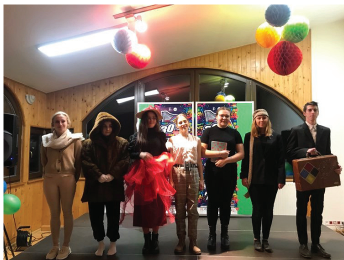
Przedstawienie "Mały Książę" - na scenie podopieczni Stowarzyszenia Taka Team

stacjonarnych na Hali Sportowej i w sklepie Wielobranżowym „Matko” przy ul. Głównej 6.