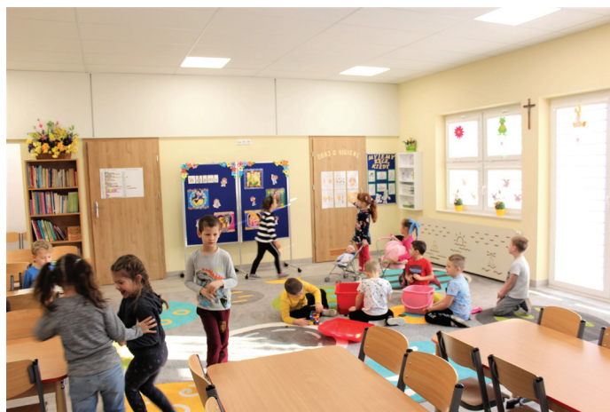
Placówka pomieści 125 dzieci