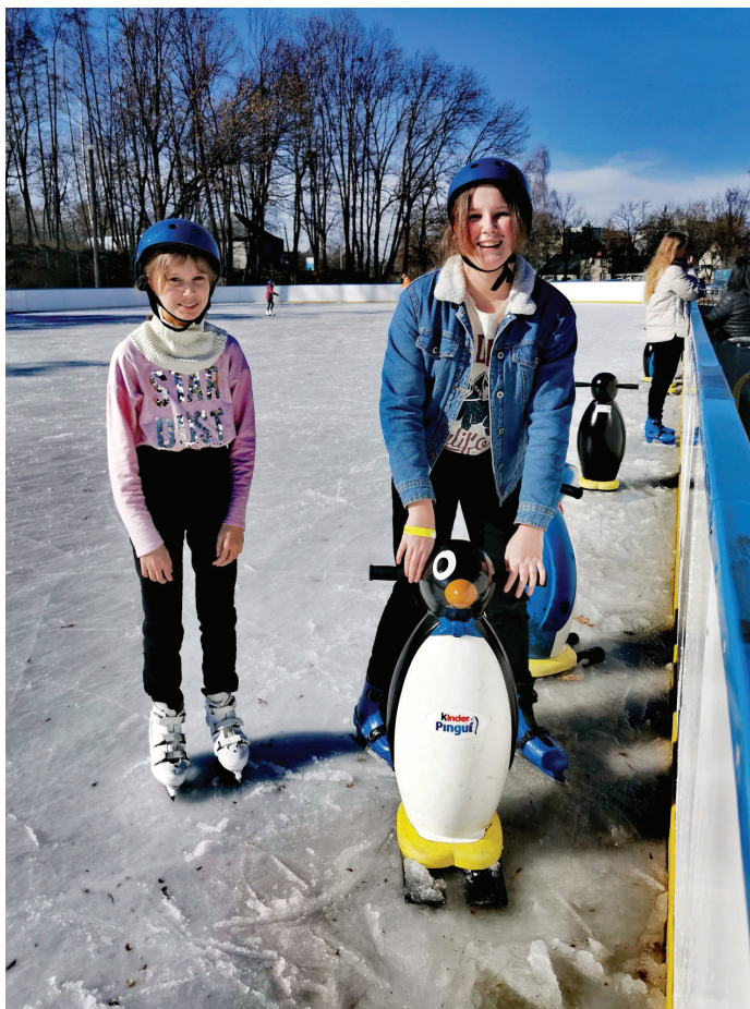
W trakcie zimowej przerwy dzieci mogły też poszaleć na lodowisku

i UMKS Goczałkowice-Zdrój (w kategorii orlik). Zmagania młodzików wygrał Pasjonat Dankowice. W turnieju orlików – zgodnie z unifikacją PZPN-u – klasyfikacja nie była prowadzona. Wszystkie turnieje futsalu oraz turniej trójek koszykarskich zostały rozegrane w hali „Goczus” w Goczałkowicach-Zdroju.