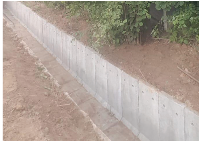
Rów R-A, rejon ul. Letniej