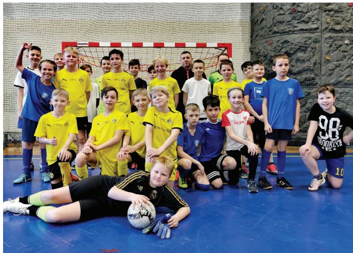
W trakcie ferii nie brakowało turniejów sportowych

Weekendy wypełnione zostały Goczałkowickimi Turniejami Futsalu. W pierwszym tygodniu zaprezentowali się młodzicy (roczniki 2009-2010), w drugim orliki (2011-2012). W obu imprezach zagrało po sześć drużyn klubowych, w tym reprezentanci LKS-u Goczałkowice-Zdrój