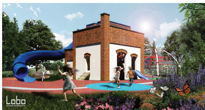
Tak będzie wyglądał nowy plac zabaw