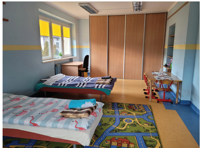
W byłym przedszkolu nr 2 przygotowano miejsca dla Ukraińców

Ośrodek Pomocy Społecznej w Goczałkowicach-Zdroju zachęca do udziału w akcji „Rodzinny parasol”, która ma na celu długoterminową pomoc rodzinom i osobom z terenów objętych wojną na Ukrainie. To Ty decydujesz, w jakim zakresie chcesz pomóc. Poszukujemy mieszkańców Goczałkowic-Zdroju, którzy wspólnie tworząc tzw. „rodzinny parasol” mają możliwość regularnie wspierać osoby z terenów objętych wojną na Ukrainie będących w potrzebie poprzez: udostępnienie lokalu mieszkalnego (np. mieszkanie, część domu), pokrycie kosztów utrzymania jak opłacanie rachunków związanych z mieszkaniem i pobytem, zakup i dostarczanie artykułów żywnościowych lub przygotowanie posiłków, wsparcie osobiste jako pomoc w formie wolontariatu, materialne zaopatrzenie w postaci najpotrzebniejszych rzeczy: środki medyczne i opatrunkowe, koce, śpiwory, łóżka polowe, odzież. Wszystkich zainteresowanych prosimy o kontakt telefoniczny pod nr telefonu: 32 212-70-55, 796-102-816 lub e-mailowo: ops@goczalkowiczdroj.pl oraz określenie oferowanej pomocy.