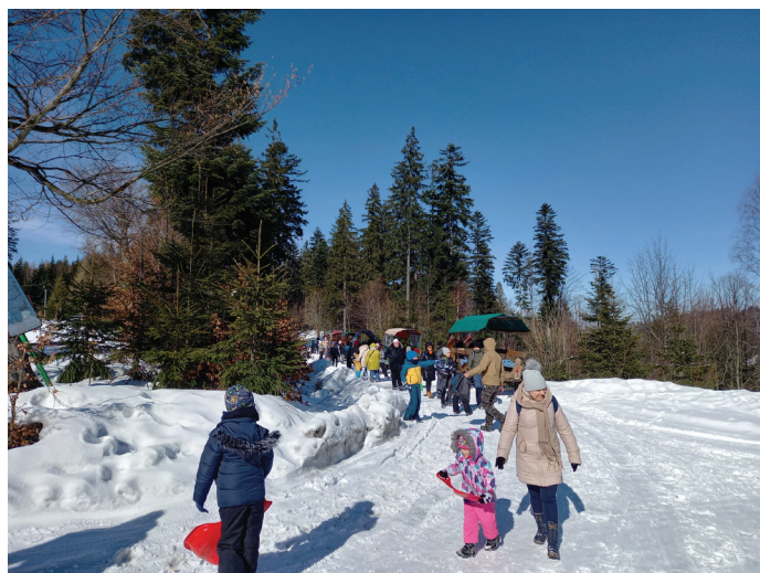
Na kuliżu oprócz śnieżnego szaleństwa czekała na uczestników piękna pogoda