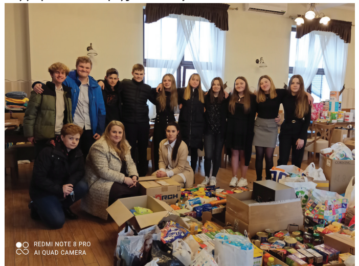
W zbiórkę zaangażowała się też społeczność SP nr 1