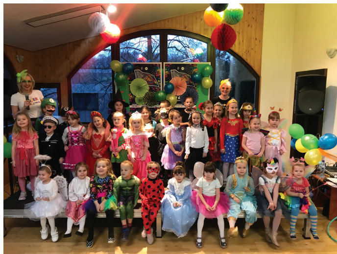
Bal przebierańców to wielka atrakcja dla najmłodszych

Wraz z zakończeniem ferii, zapraszamy do udziału w naszych stałych warsztatach: tanecznych, plastycznych, językowych, muzycznych, językowych itp. oraz do udziału w naszych propozycjach plenerowych i wyjazdach wakacyjnych.