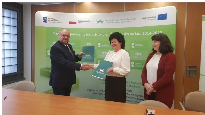
Umowę podpisano 25 lutego