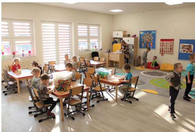
Dzieci spędzają czas w nowoczesnym i bezpiecznym obiekcie