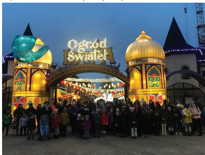
Na wyjazd do Ogródu Świąteł z Goczałkowic udało się ponad 100-osobowa grupa