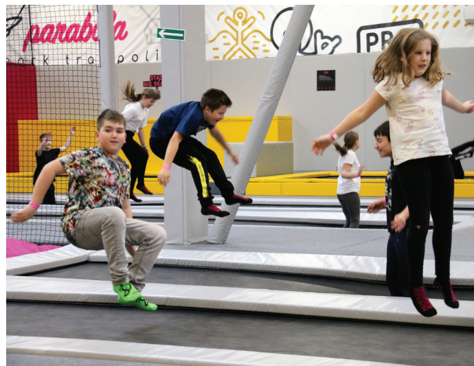
Dużym zainteresowaniem cieszył się wyjazd do parku trampolin