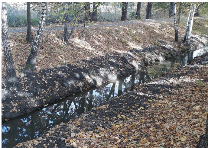
Kanał Kanar, odcinek między torami PKP a „Rybaczówką”