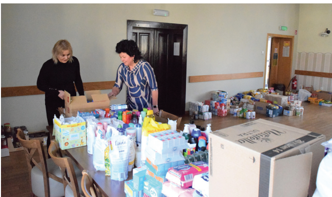
Mieszkańcy chętnie przekazywali dary na rzecz ludności z Ukrainy