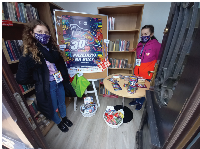
Za sukcesem każdego finału zawsze stoją wolontariusze

Oprócz zwyczajowych form wsparcia osoby, które nie miały możliwości osobiście wziąć udział w finałowym koncercie mogły wesprzeć działalność fundacji za pomocą eSkarbonki oraz w dniach poprzedzających wydarzenie, wrzucając datki do puszek