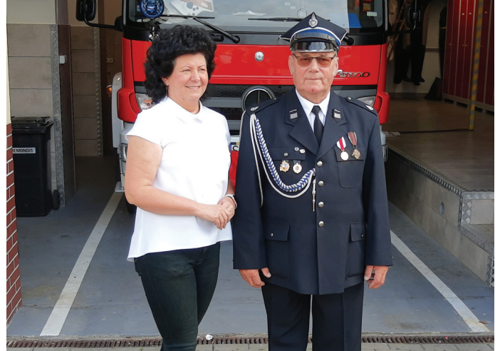
UG ▲ Nowy prezes OSP to także radny Rady Gminy (Fot. UG)

OSP Goczałkowice-Zdrój liczy obecnie 56 członków.