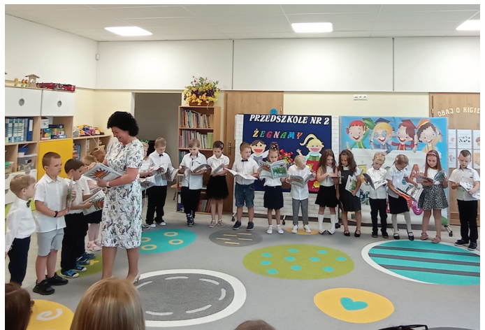
Podczas wizyty w przedszkolu nr 2