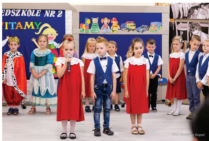
Na tę wyjątkową okazję dzieci przygotowały piękny występ

wienia zagospodarowano teren przy przedszkolu. Powstały plac zabaw, chodniki, dojazdy, infrastruktura techniczna. Wartość