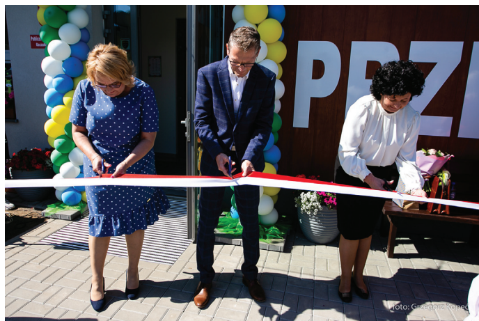
Wydarzenie rozpoczęło uroczyste przecięcie wstęgi

W nowym przedszkolu znajduje się 125 miejsc dla dzieci (5 oddziałów). Powierzchnia zabudowy budynku przedszkola wynosi 806 m kw. Sale wyposażone są w zaplecze sanitarne oraz magazyny na leżaki, w przedszkolu znajduje się również sala do organizacji spotkań z rodzicami, kuchnia, część administracyjna, szatnie, zewnętrzny plac zabaw. W ramach zamó-