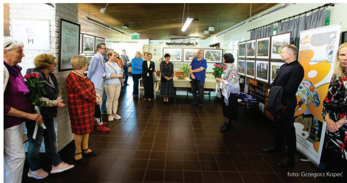
Podczas wernisazu wystawy