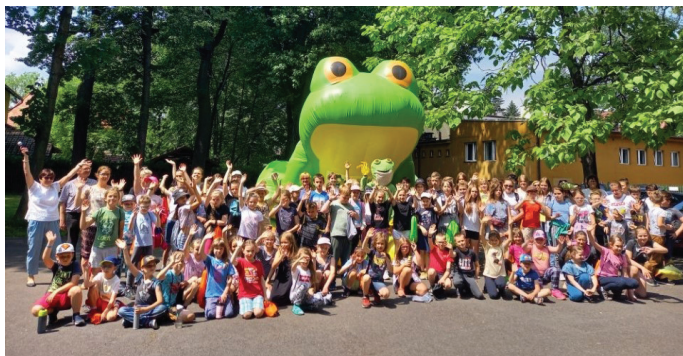
W zabawie udział wzięło 9 drużyn

W tym roku do współpracy w ramach organizacji kolejnej edycji imprezy zaproszone zostały goczałkowickie instytucje kultury, które przygotowały dla najmłodszych integracyjną „Zabią Grę Terenową”. We wspólnej zabawie wzięło udział łącznie 9 drużyn reprezentujących SP nr 3 w Pszczynie, szkołę CETIR