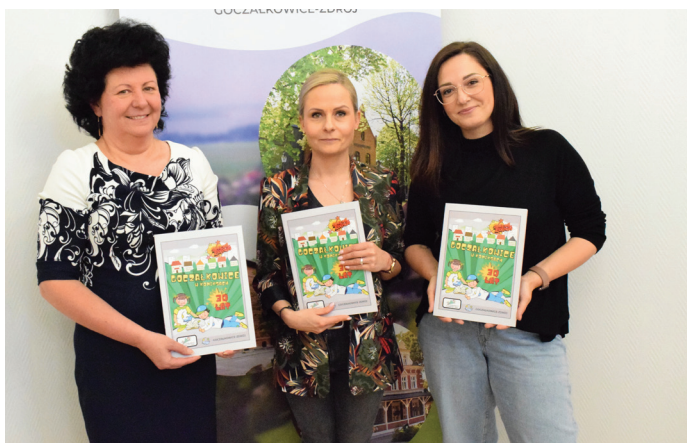
Wójt z autorkami wyjątkowego komiksu