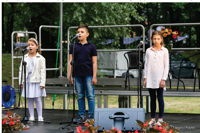
Na małym scenie swój talent zaprezentowali uczestnicy warsztatów wokalnych