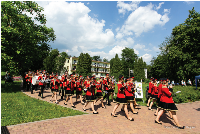
Przemarsz orkiestry i mażorettek przez uzdrowisko był spektakularny