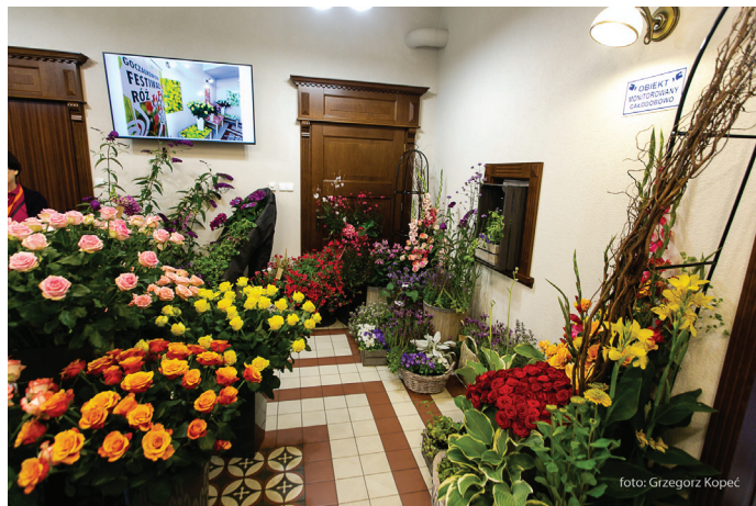
Tegoroczną wystawę zaaranżowało atelier florystyczne Alessandro