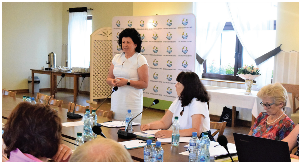
Za udzieleniem absolutorium i wotum zaufania zagłosowali wszyscy radni obecni na sesji

Wśród najważniejszych zadań realizowanych w ubiegłym roku były: budowa nowego przedszkola, budowa zbiornika retencyjnego w rejonie ul. Zimowej,