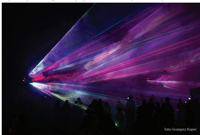
Pokaz laserowy uświetnił piątkowy wieczór