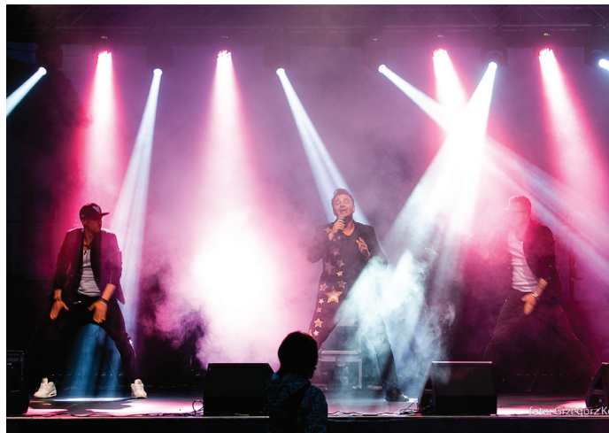
Zespół Weekend zachęcił do wspólnej zabawy

W niedzielę wydarzenia jubileuszowe przygotowane przez Gminny Ośrodek Kultury i Gminną Bibliotekę Publiczną miały miejsce w Parku Zdrojowym. Przed południem ruszyła Parkowa Gra Terenowa. Uczestnicy musieli odnaleźć 10 jubileuszowych kamieni i na podstawie wskazówek podać nazwiska Honorowych Obywateli Gminy. W zabawie udział wzięło ponad 70 drużyn. Dziękujemy goczałkowickim przedsiębiorcom