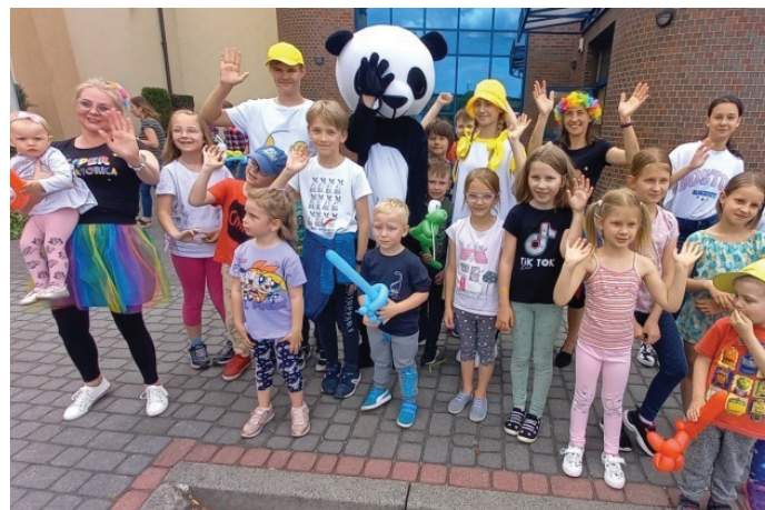
To była świetna niespodzianka na Dzień Dziecka