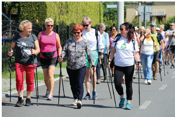
Miłośnicy nordic walking skorzystali z pięknej pogody