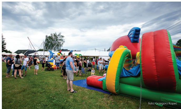
UG ▲ Na dzieci czekały dmuchańce

Podczas festynu mogliśmy podziwiać występy formacji Dance Kids i uczestników warsztatów wokalnych GOK-u. Dla najmłodszych przygotowano darmowe dmuchańce i zabawy taneczne. Wieczorem odbyła się zabawa z DJ-em Szłapą. Festynowi towarzyszył zlot food trucków.