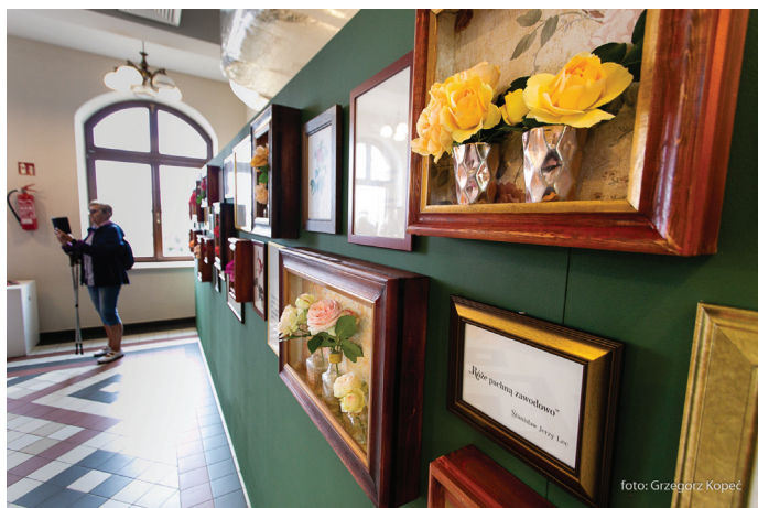
Wystawa "Portret Róży" przyjechała gościnnie do Goczałkowic z Kutna