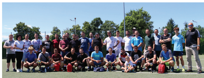
Zawody piłkarskie mieszkańców wygrała drużyna Stado