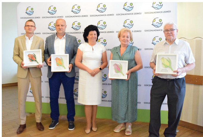
Goczałkowickie Róże otrzymali radni najdłużej zasiadający w Radzie Gminy

- Rok 1992 miał bardzo duże znaczenie w moim życiu pry-