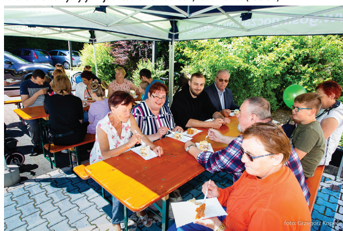
Tortem częstowali się mieszkańcy, którzy przyszli pod urząd