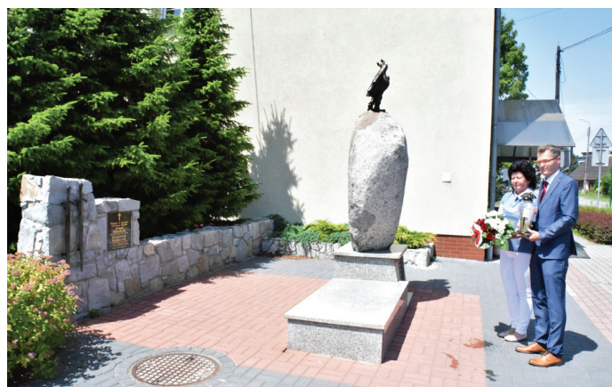
UG ▲ Dla uczczenia powstańców pod pomnikiem złożono kwiaty i znicz