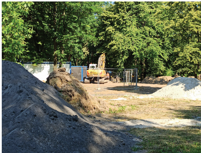
Przy ul. Uzdrowskiej i Zielonej powstaje parking na prawie 100 miejsc

B udowa centrum przesiadkowego w Gminie Goczałkowice-Zdrój przy ul. PCK - etap 3 to kontynuacja działań podjętych kilka lat temu. W ramach inwestycji wybudowana zostanie droga dojazdowa, powstanie parking samochodowy na 30 miejsc, parking rowerowy (wiata na rowery), wiata dla oczekujących, zatoka dla busów, dojścia dla pieszych i rowerzystów. Wykonane będzie także odwodnienie. Wszystko powinno być gotowe w listopadzie 2022 roku. Centrum przesiadkowe przy ul. PCK będzie stanowiło lustrzane odbicie oddanego do użytku w 2020 roku parkingu przy ul. Parkowej, który znajduje się po drugiej stronie torów. Oba miejsca połączy przejście pod torami, które budowane jest w ramach