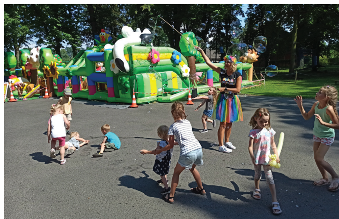
GOK ▲ Dmuchańce i wspólne zabawy cieszyły się dużym zainteresowaniem

Najmłodszy piękny, słoneczny dzień spędzili na ciekawych i wesołych rozrywkach. Pośród przygotowanych niespodzianek znalazły się kolorowe dmuchańce utrzymane w wiejskim klimacie, trampoliny do skoków Eurobungee oraz stoiska animacje z malowaniem brokatowych tatuaży oraz modelowaniem balonów. Ponadto, animatorzy z zaprzyjaźnionej firmy Eden Kids koordynowały wspólną zabawę, tańce i gry zespołowe. Na zakończenie, DJ Szłapa zaprosił młodzież na dyskotekę „pod chmurką”.