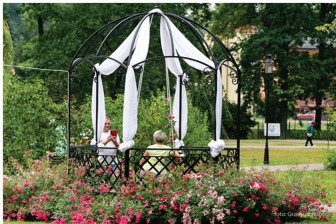
Wystrój alatek wykonały goczałkowickie kwiaciarnie i ogrody pokazowe