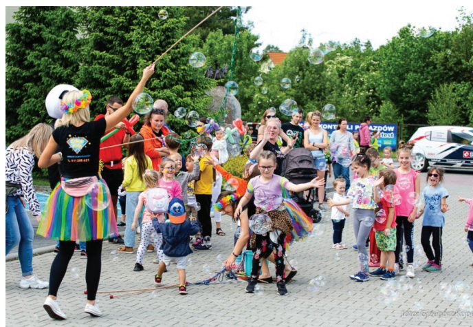
W różnych miejscach w gminie GOK zaprosił dzieci do zabawy