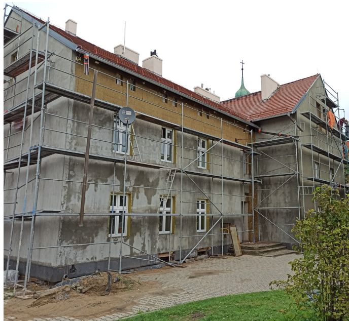
UG ■ Inwestycja przy ul. Szkolnej 70 poprawi efektywność energetyczną budynku (Fot. UG)

Na dwie ostatnie inwestycje gmina pozyskała dofinansowanie w ramach Rządowego Funduszu Polski Łądz: Program Inwestycji Strategicznych w łącznej wysokości ok. 4,6 mln zł.