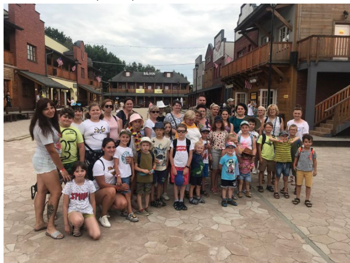
W westernowym klimacie