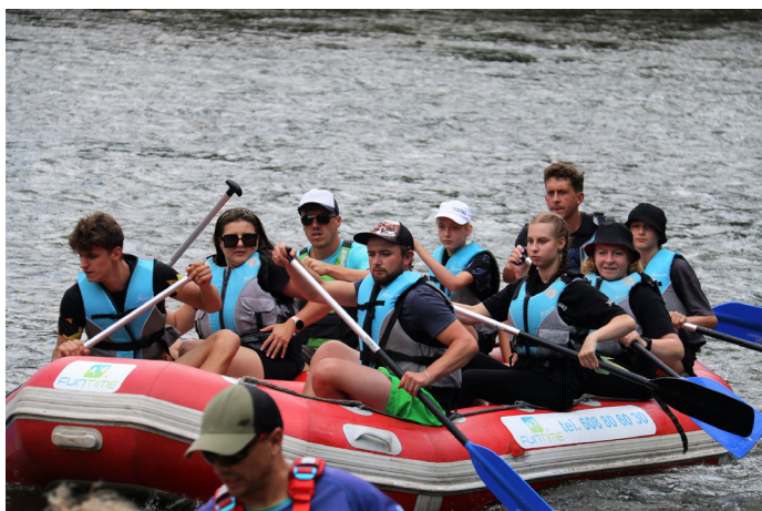
W spływie pontonowym udział wzięło 57 osób