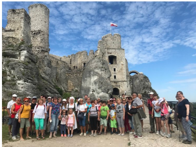
Szlakiem Orlich Gniazd

Na zakończenie postanowiliśmy nieco zmienić klimaty i pokusić się o obejrzenie wyjątkowej atrakcji, jaką można