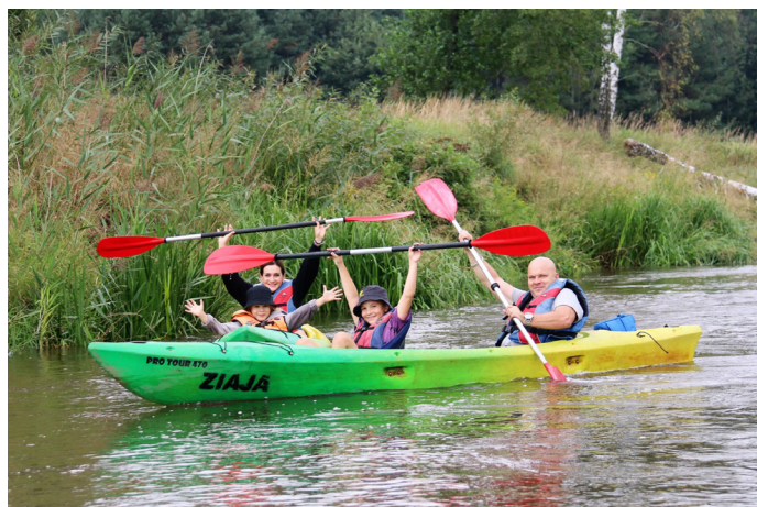
Uczestnicy spływu kajakowego pokonali 10-km odcinek rzeki Mała Panew