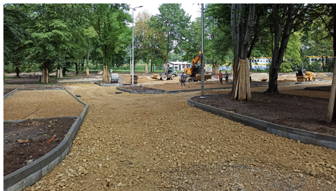
W pobliżu uzdrawiska powstaje parking na prawie 100 miejsc