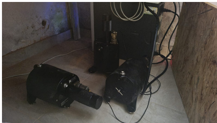
Seismograf znajduje się na terenie nieruchomości przy ul. Brzozowej

W pierwszej połowie roku ponownie odczuwalne były silne wstrząsy w znacznej części gminy. Ku zdumieniu mieszkańców okazało się, że zostały one odnotowane jako wstrząsy o zerowym stopniu odczuwalności. To wywołało dyskusję podczas kwietniowej sesji Rady Gminy, w której udział wzięli też przedstawiciele czechowickiej kopalni. Obecni