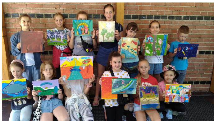
Kreatywne warsztaty plastyczne

po kilku latach rewitalizacji ponownie odwiedzić na terenie Śląskiego Parku Rozrywki.