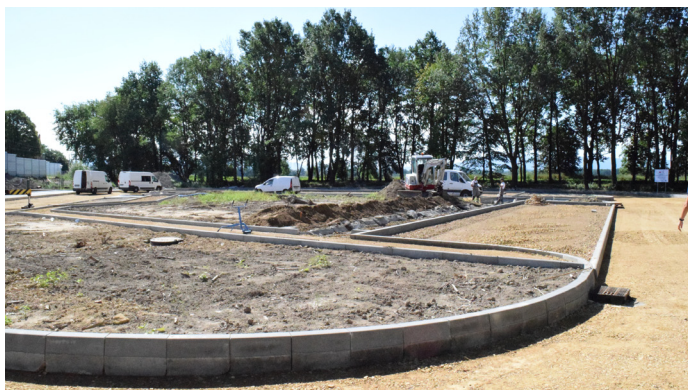
Budowa centrum przesiadkowego przy ul. PCK