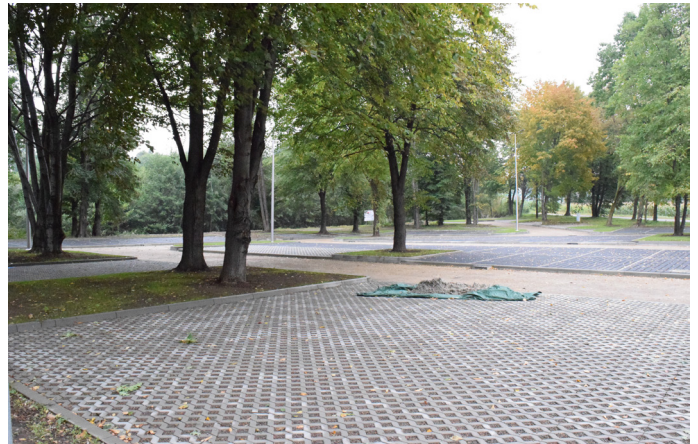
Nowe miejsca parkingowe powstają przy stawie Maciek Mały