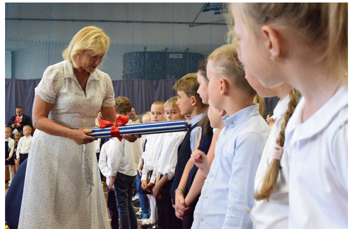
Pasowanie na ucznia było niezwykle doniosłym momentem