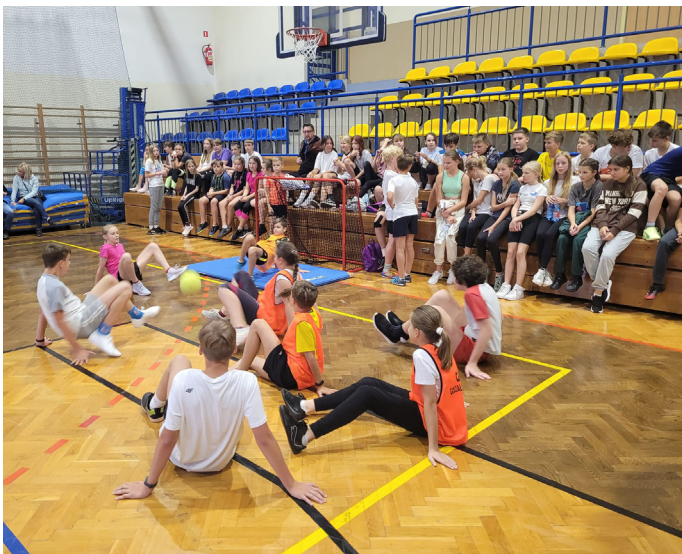
To był dzień pełen aktywności sportowej