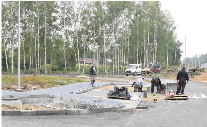
Centrum przesiadkowe przy ul. PCK połączone będzie z centrum przesiadkowym przy ul. Parkowej przejściem podziemnym pod torami