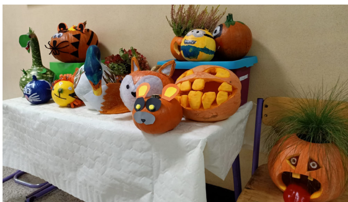
Uczniowie przygotowali piękne dekoracje z dyni (Fot. SP nr 1)