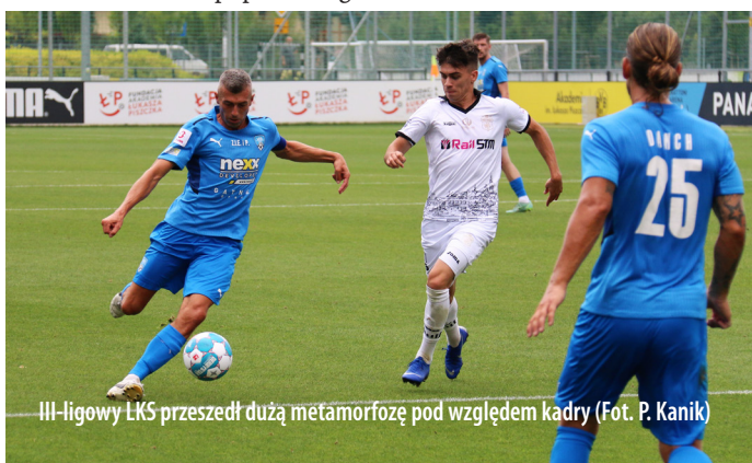
III-ligowy LKS przeszedł dużą metamorfozę pod względem kadry