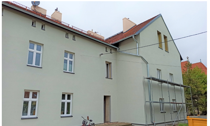
Termomodernizacja poprawi efektywność energetyczną gminnego budynku