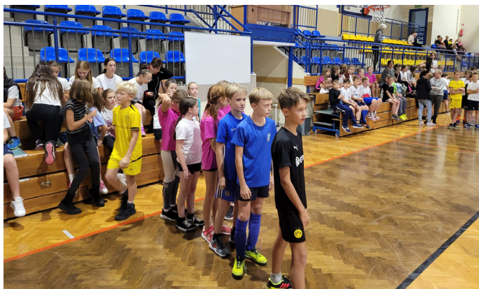
Ze względu na pogodę, nie odbył się pieszy rajd po Goczałkowicach