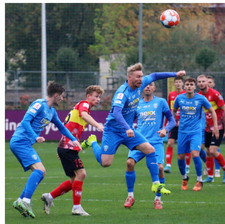
Pierwsza drużyna LKS-u kończy rundę tuż nad strefą spadkową III ligi