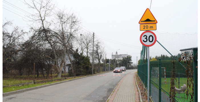
O nowej organizacji ruchu informują znaki drogowe