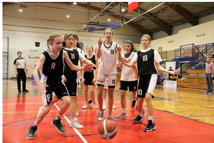
10 listopada w zawodach wzięło udział pięć drużyn

Klasyfikacja: 1. SP 2 Pawłowice, 2. SP 1 Goczałkowice-Zdrój, 3. SP 1 Jaworze, 4. ZSP Kaniów, 5. ZSP Osiek.