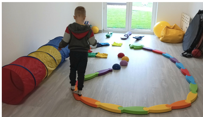
W nowej siedzibie przedszkola znajduje się sala do integracji sensorycznej

Dotyk – to jeden z najwcześniej rozwijających się zmysłów. Poza funkcją ochronną, zmysł dotyku