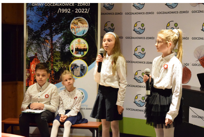
Świętowanie rozpoczęliśmy Wieczornicą w GOK-u