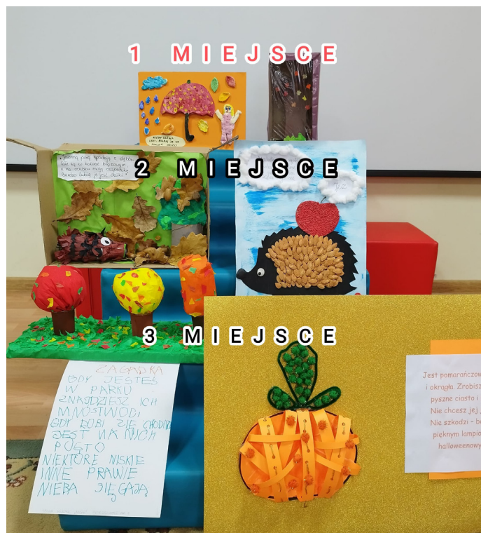
Prace nagrodzone w konkursie

Logopedki mgr Karolina Siedlaczek, mgr Weronika Stasicka