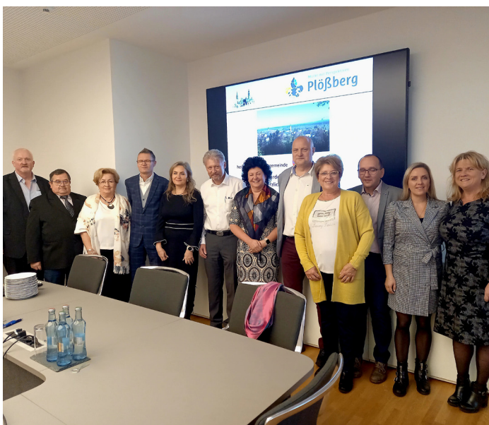
Podczas wizyty w ratuszu