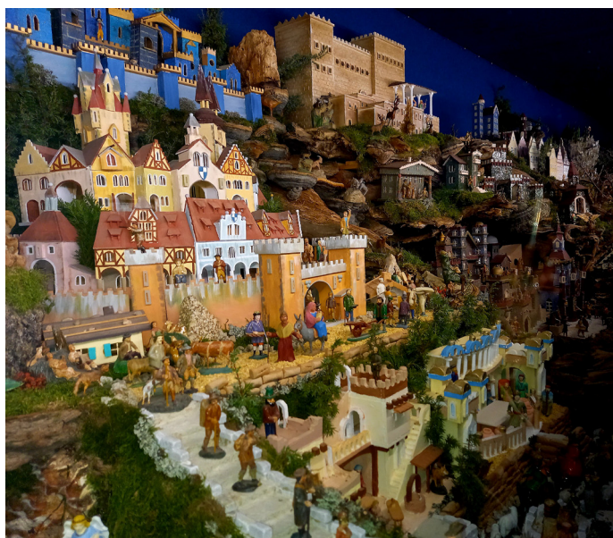
Wystawa szopek jest organizowana co 5 lat