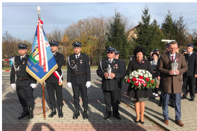
11 listopada złożyliśmy kwiaty pod pomnikiem „Ku czci poległych za Ojczyznę”