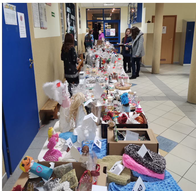
SP nr 1 Wybór ozdób, kartek czy ciast był bardzo duży

Organizatorzy z całego serca dziękują za włączenie się w organizację kiermaszu. Dochód z kiermaszu został przekazany radzie rodziców naszej szkoły.