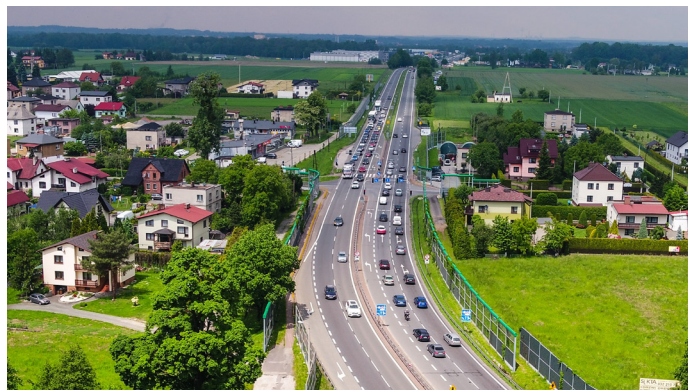
Widok z lotu ptaka na DK 1 w Goczałkowicach-Zdroju

Nowy system pracy sygnalizacji spowodował duże korki na ul. Brzozowej i Głównej. – Bezspornym jest, że bezpieczeństwo użyt-