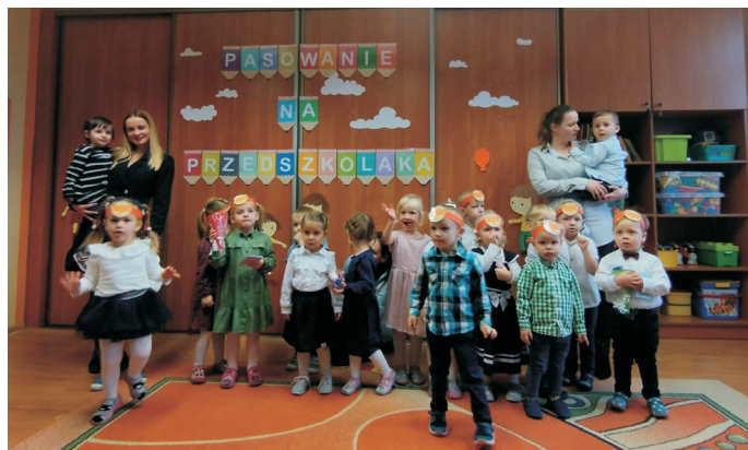
Dla wszystkich dzieci było to ogromne przeżycie, a dla rodziców powód do dumy (Fot. PP nr 1)