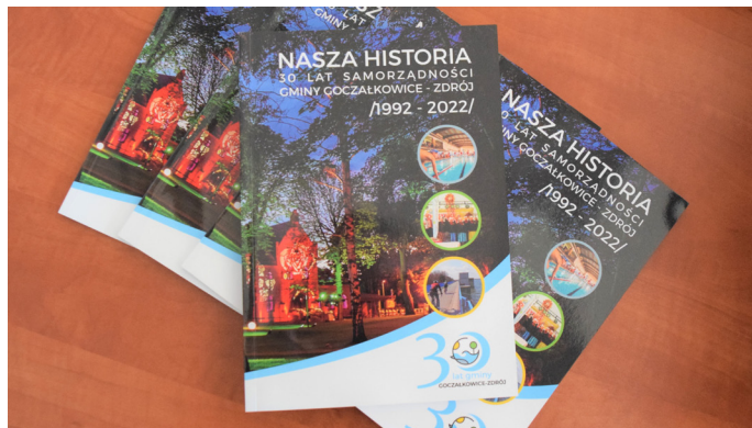
Z okazji 30-lecia gminy ukazała się publikacja o historii naszej miejscowości