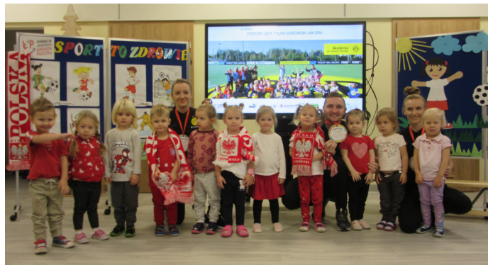
Goście zachęcali do aktywności fizycznej

Aby dowiedzieć się, jaka będzie tematyka spotkania, dzieci wzięły udział w zabawie dydaktycznej – posegregowały przedmioty na te o charakterze sportowym i pozostałe. Następnie oddaliśmy głos przybyłym. Trenerzy wystąpili z prezentacją, podczas której zwrócili uwagę na wpływ uprawiania sportu na prawidłowy rozwój zarówno fizyczny, jak i umysłowy dzieci, zachęcali przedszkolaki do aktywności ruchowej oraz zaprosili małych sportowców do wspólnych ćwiczeń. Nasi miliusińscybiegali, podskakiwali, wykonywali skłony, przysiady, wymachy. Również przedszkolaki miały swoje 10 minut – mogły zadawać pytania gościom. Uczestnicy spotkania byli ciekawi, czy wygrali oni