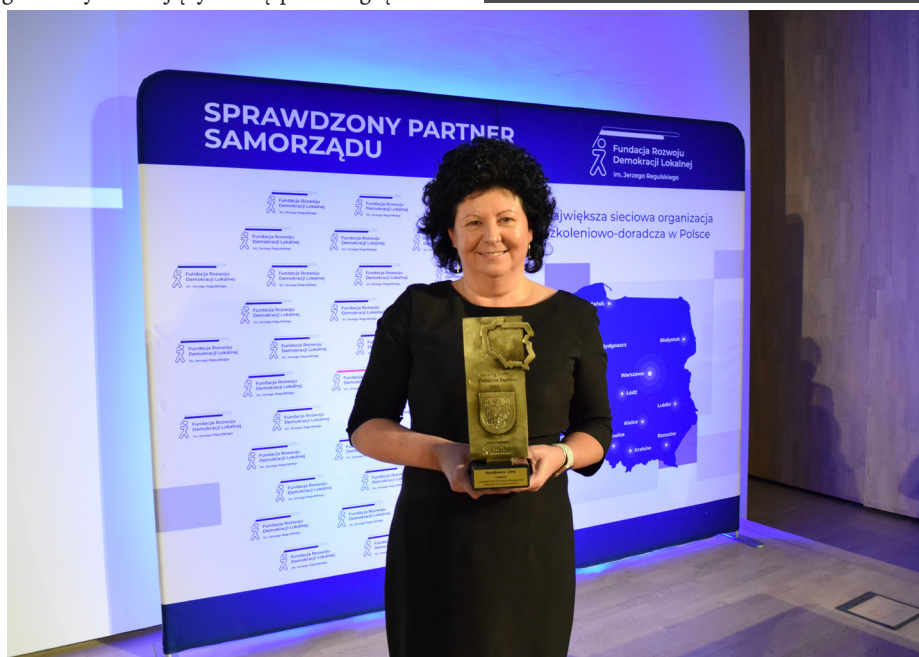
Gmina Goczałkowice-Zdrój zajęła I miejsce drugi rok z rzędu