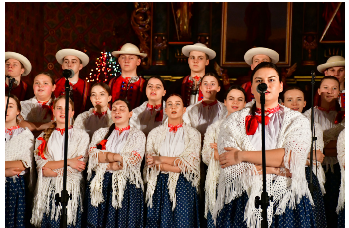
„Istebna” to jeden z najstarszych zespołów folklorystycznych w kraju