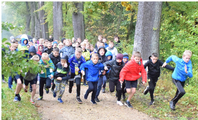
W ubiegłym roku powrócił Goczałkowicki Bieg św. Huberta

W 2022 roku GOSiR zorganizował bądź współorganizował zawody sportowe i rekreacyjne w 10 dyscyplinach sportowych. Imprezy te mają zasięg: gminny, powiatowy, wojewódzki. W sumie zorganizowanych zostało