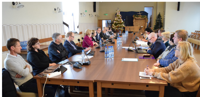
Budżet został przyjęty na sesji Rady Gminy 20 grudnia

Ogromną część budżetu stanowią wydatki na inwestycje. Na ten cel przeznaczonych zostanie aż 21 mln 611 tys. 235 zł, czyli 29% wszystkich wydatków. Dzięki temu uda się zrealizować szereg ważnych dla mieszkańców zadań (szczegóły poniżej). W budżecie znajdują się te zadania, na które gmina ma przyznane dofinansowanie lub złożyła wnioski o ich dofinansowanie. W trakcie roku budżetowego, w miarę ogłaszania nowych konkursów na dotacje i pojawiania się nowych możliwości finansowania potrzebnych gminie zadań (szczególnie w ramach programów rządowych lub konkursów o dotacje unijne), budżet będzie ulegał zmianom.