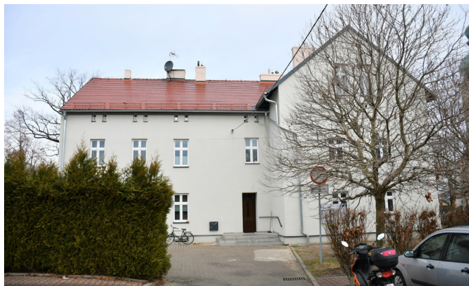
To kolejna inwestycja proekologiczna na terenie gminy

Zrealizowana przez Urząd Gminy Goczałkowice-Zdrój inwestycja pozwoli na zmniejszenie kosztów ogrzewania, przyczyni się do zwiększenia komfortu cieplnego w mieszkaniach, a także do zmniejszenia emisji zanieczyszczeń. - Sukcesywnie poprawiamy stan naszych gminnych obiektów. Termomodernizacja budynku wielorodzinnego jest kolejnym działaniem gminy, którego celem jest ograniczenie zanieczyszczeń powietrza poprzez poprawę efektywności energetycznej. Istotny jest także walor estetyczny. Budynek znajdujący się w sąsiedztwie kościoła pw. św. Jerzego Męczennika prezentuje się teraz bardzo