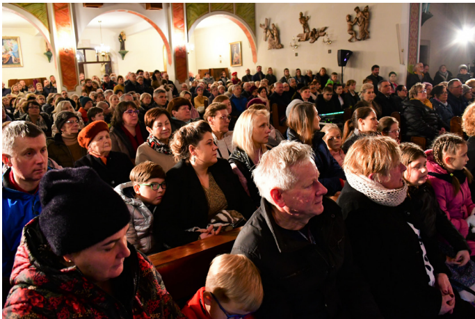
Koncert cieszył się ogromnym zainteresowaniem