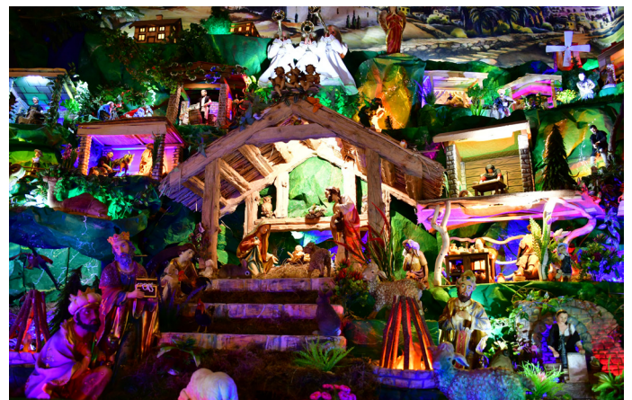
W szopce znajduje się 25 ruchomych figur