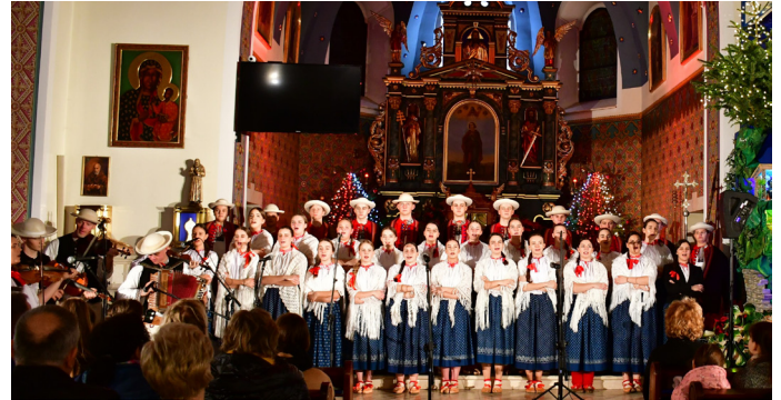
Zespół „Istebna” wystąpił w kościele parafialnym