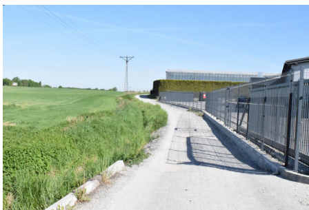
Miejsce, w którym wybudowany zostanie łącznik ulic Źródlanej i Spokojnej

- poprawa układu komunikacyjnego poprzez przebudowę ul. Robotniczej oraz budowa ul. Warzywniej wzdłuż drogi krajowej nr 1 (z udziałem