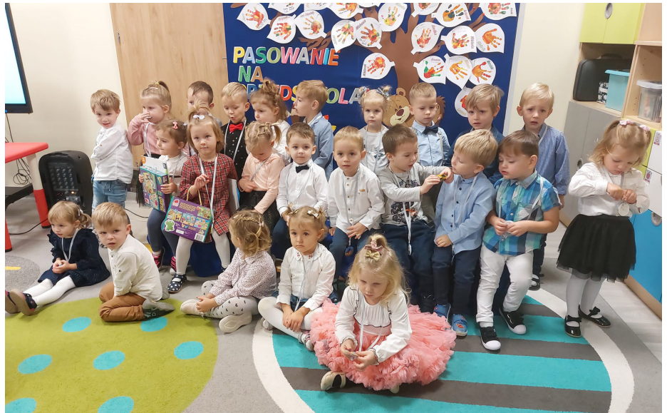
To był szczególny dzień dla dzieci, które po raz pierwszy we wrześniu przekroczyły próg przedszkola

Uroczystość rozpoczęła pani dyrektor witając przybyłych rodziców. Po wejściu na salę dzieci utworzyły koło i również przywitały się z gośćmi „Piosenką na powitanie”. Następnie słowami wiersza zaprosiły rodziców na pasowanie. Podczas trwania programu artystycznego udowodniły, że bardzo dobrze wiedzą, jak należy poruszać się bezpiecznie po ulicy deklamując wiersz „Światelko” oraz wykonując inscenizację ruchową do piosenki „Samochody”. Przedszkolaki mają świadomość, jak ważna jest higiena i porządek, zaśpiewały rodzicom piosenkę „Bakterie”, ilustrując jej tekst i rytmicznie wyklaskując rytm. Dzieci znają nazwy wielu owoców i warzyw, wiedzą, jak robi się zdrowe przetwory i znają ich smak. Potrafiły pięknie maszerować i tańczyć w parach do piosenki „Buraczek i cebulka”. Na zakończenie zaprezentowały „Taniec z listkiem”, który zakończył prezentację umiejętności, jakie osiągnęły dzieci podczas zajęć