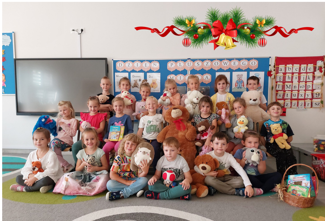
Dzieci radośnie świętowały urodziny

Dzieci z grupy „Misie” przedstawiły kolegom przyniesione do przedszkola misie. Następnie