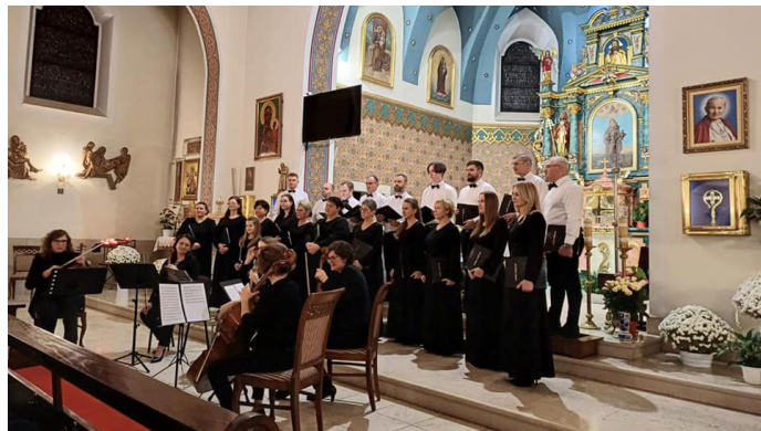
UG ▲ Piękny koncert został zorganizowany z okazji dnia św. Cecylii, patronki muzyki

Koncert został zorganizowany przez chór Semper Communio oraz Gminny Ośrodek Kultury w Goczałkowicach-Zdroju.