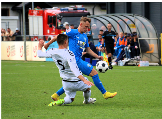
LKS po rundzie jesiennej zajmuje 9. miejsce