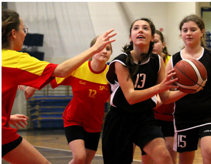
W turnieju udział wzięło pięć drużyn