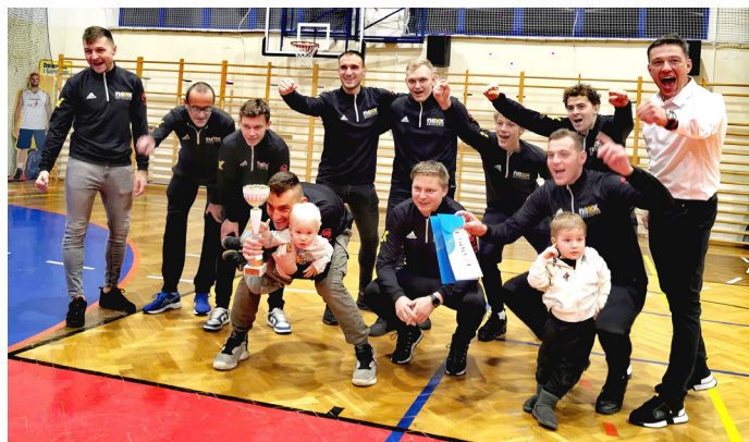
Turniej wygrała drużyna NEXX Goczałkowice-Zdrój

Turniej finałowy Pucharu Polski w Futsalu na szczeblu województwa śląskiego, hala sportowa „Goczus” w Goczałkowicach-Zdroju, 25 listopada 2023 roku.