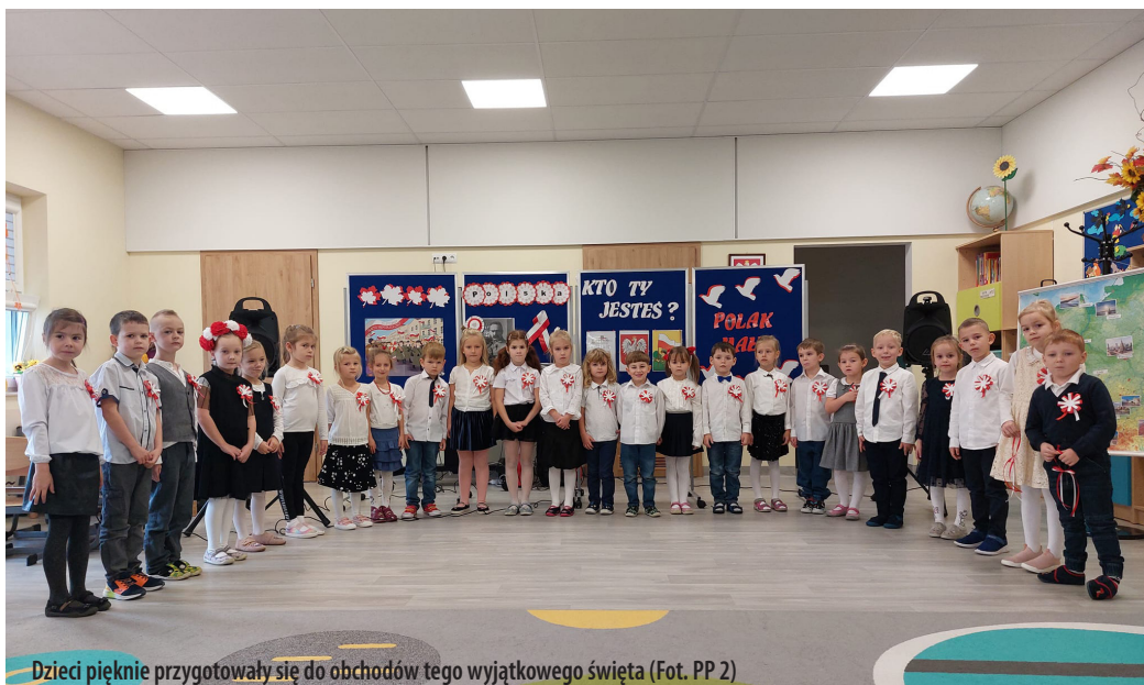
Dzieci pięknie przygotowały się do obchodów tego wyjątkowego święta (Fot. PP 2)