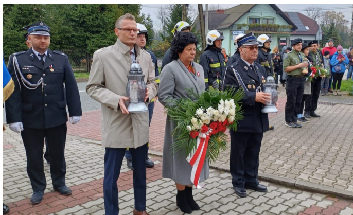
11 listopada spotkaliśmy się pod pomnikiem przy OSP