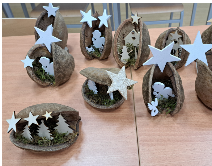
Prace przygotowane na świąteczny kiermasz