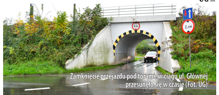
Zamknięcie przejazdu pod torami, w ciągu ul. Głównej przesunęło się w czasie

Bieżące informacje na temat realizacji inwestycji kolejowej realizowanej w gminie Goczałkowice-Zdrój będziemy publikować na stronie internetowej Urzędu Gminy goczalkowiczdroj.pl oraz na Facebooku.