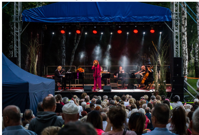
Za nami jubileuszowa, 10. edycja Goczałkowickiego Festiwalu Róż

Działania zmieniające Goczałkowice-Zdrój na lepsze są doceniane w całym kraju! W 2023 roku otrzymaliśmy szereg nagród i wyróżnień. Zostaliśmy najbardziej ekologiczną gminą uzdrowską w konkursie Stowarzyszenia Gmin Uzdrowskich RP oraz Grupy ERGO Hestia. Zajęliśmy I miejsce w ogólnopolskim rankingu aktywności gmin w programie „Czyste Powietrze” za cały 2022 rok. Ponadto, gmina zajęła II miejsce w Rankingu Gmin Śląska w kategorii gmin do 20 tys. mieszkańców.