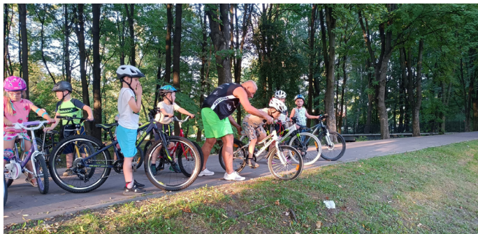
Jesienią na zajęciach rowerowych spotkaliśmy się osiem razy

Przy Starym Dworcu spotykaliśmy się co poniedziałek, od września do listopada. Bardzo piękna pogoda jaką mieliśmy jesienią sprawiła, że spotkaliśmy się w tym okresie osmiokrotnie.