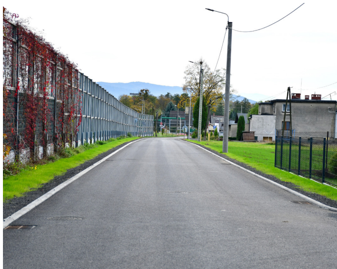
Nowa droga wzdłuż DK 1 to duże ułatwienie dla mieszkańców

Kolejne duże inwestycje przed nami! W kończącym się roku gmina otrzymała z Polskiego Ładu prawie 8,3 mln zł dofinansowania na I etap rozbudowy ul. Siedleckiej wraz z budową połączenia z ul. Skłodowskiej-Curie w Pszczynie. Realizowany będzie też remont budynku Publicznego Przedszkola nr 1, wraz z dostosowaniem do przepisów przeciwpożarowych. Pozyskaliśmy na ten cel 300 tys. zł. Gmina otrzyma też prawie 1 mln zł dotacji do Zgromadzenia Sióstr Boskiego Zbawiciela „Salwatorianek” na remont budynku klasztoru i kaplicy.