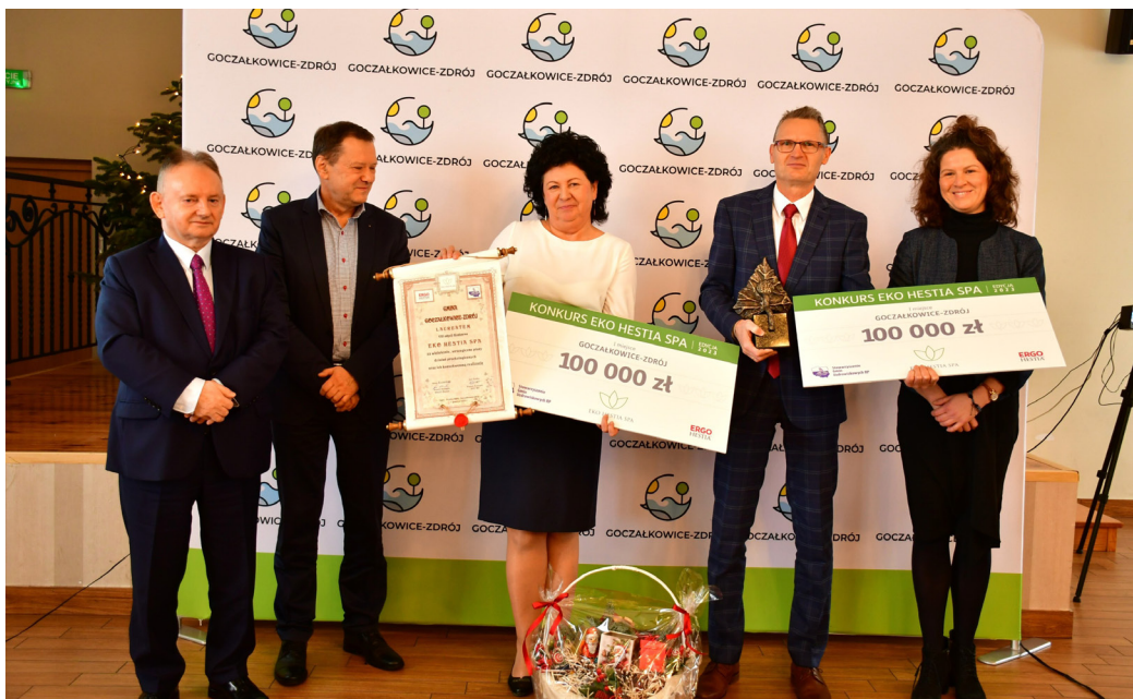
Goczałkowice-Zdrój zostały najbardziej ekologiczną gminą uzdrawiskową w kraju

Partnerem merytorycznym konkursu EKO HESTIA SPA jest największa polska organizacja, zrzeszająca miejscowości posiadające status uzdrawiska – Stowarzyszenie Gmin Uzdrawiskowych RP.