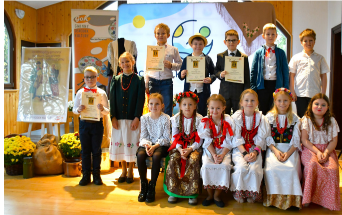
Gratulacje dla uczestników konkursu

Na utrwalanie „godki” śląskiej, zwłaszcza wśród najmłodszego pokolenia ważny wpływ mają inicjowane przez miłośników tradycyjnej kultury: zespoły regionalne, liczne przeglądy i konkursy gwarowe, które stwarzają sposobność do odkrywania źródeł swego pochodzenia i budowania tożsamości.