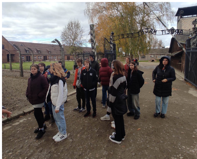
A. Jeruzel / Uczniowie szkoły w obozie Auschwitz-Birkenau

6 listopada uczniowie klas VIII Szkoły Podstawowej nr 1 w Goczałkowicach-Zdroju odwiedzili Miejsce Pamięci, jakim był największy niemiecki nazistowski obóz koncentracyjny i zagłady w czasie II wojny światowej, Auschwitz-Birkenau.