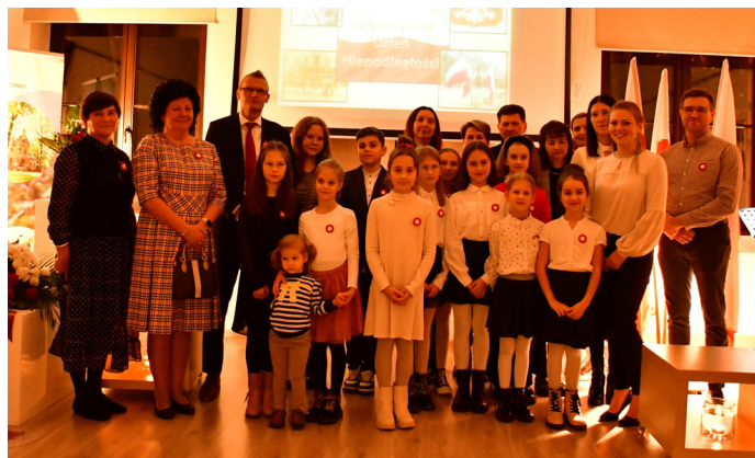
Świętowanie rozpoczęliśmy Patriotyczną Wieczornicą