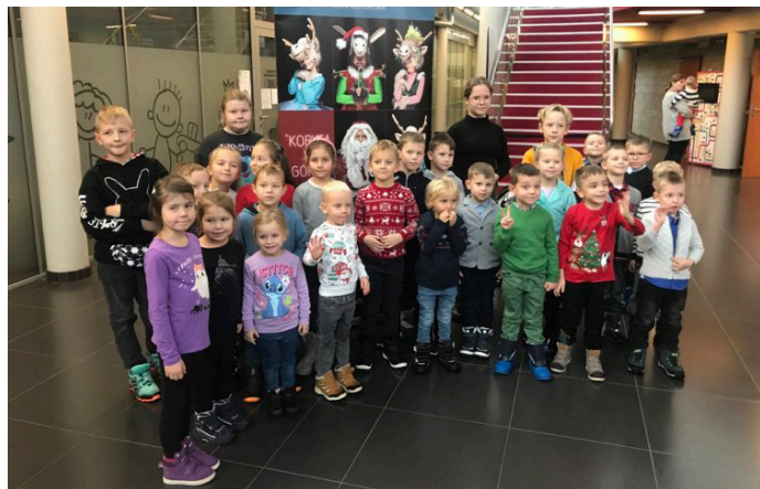
GOK ▲ W rodzinnym wyjeździe wzięło udział ponad 50 osób.

Na zakończenie wszystkim dzieciom, które wybrały się w tą wyjątkową podróż św. Mikołaj wręczył piękne prezenty przygotowane przez organizatora.