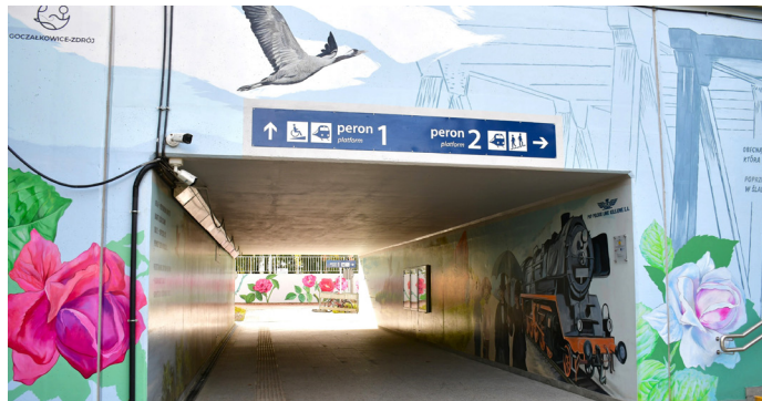
UG Mural zdobi nowe przejście pod torami na stacji w Zdroju