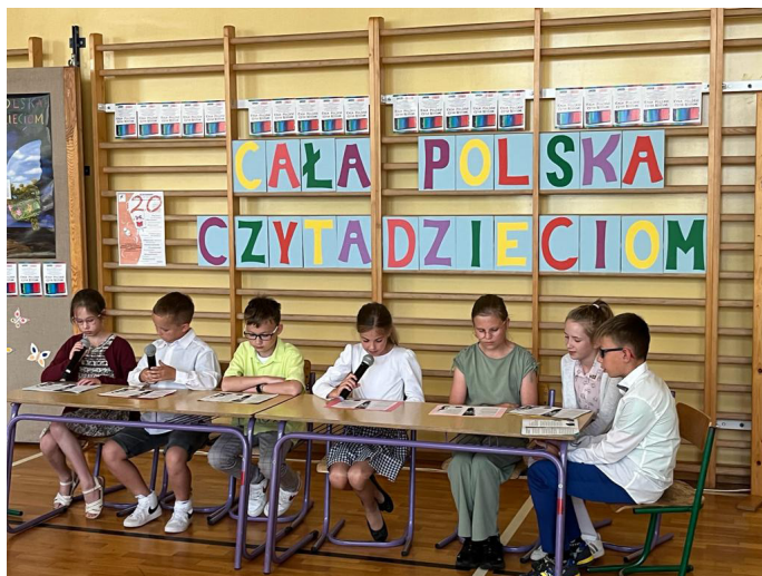
To już 20. edycja akcji w goczałkowickiej szkole

Tegoroczne spotkanie poświęcone zostało wartościom, którymi powinniśmy kierować się w życiu. Wiersze „O wartościach” Małgorzaty Strzałkowskiej zaprezentowali swoim koleżankom i kolegom reprezentanci wszystkich klas I-III. Rymowany morał płynący z każdego tekstu skierowali do swoich młodszych kolegów i koleżanek uczniowie klasy 6b. Niespodzianką na koniec spotkania była piosenka „Lubię wracać tam gdzie byłam”