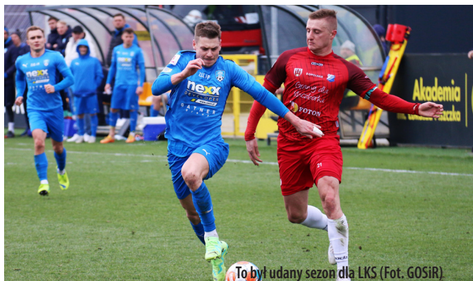
To był udany sezon dla LKS