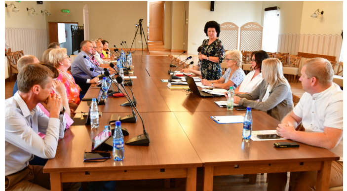
Rada Gminy udzieliła wójtowi absolutorium i wotum zaufania jednogłośnie

Ogromna część wydatków, bo niemal 20% to wydatki na inwestycje. Na ten cel przeznaczono 12 mln zł. Powstało centrum przesiadkowe przy ul. PCK oraz parking przy ul. Uzdrowskiej i Zielonej. W Parku Zdrojowym wybudowany został bezpieczny plac zabaw. Termomodernizację przeszedł budynek przy ul. Szkolnej 70. Dokończono budowę nowego przedszkola, przebudowę