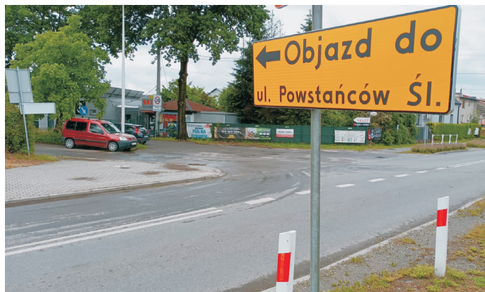
Inwestycja obejmuje rozbudowę drogi na długości ok. 1,4 km