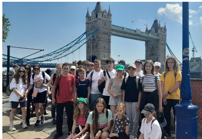
Do Londynu pojechało 24 uczniów

GMINNY OŚRODEK KULTURY W GOCZAŁKOWICACH -ZDROJU ZAPRASZA