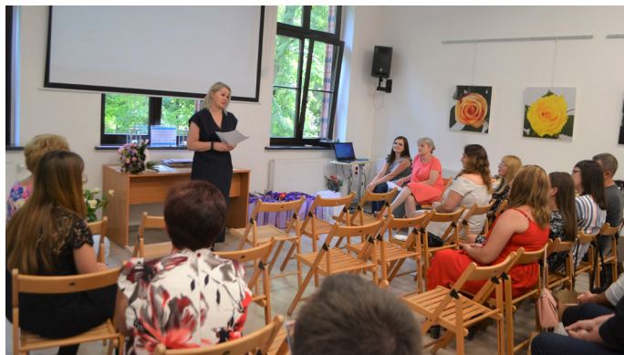
Podsumowanie projektu było okazją do wspomnień i podziękowań

Projekt był współfinansowany ze środków Unii Europejskiej w ramach Regionalnego Programu Operacyjnego Województwa Śląskiego na lata 2014-2020. Jego wartość to 103 tys. 67 zł, a uzyskane przez Ośrodek Pomocy Społecznej dofinansowanie to 87 tys. 606 zł 95 gr.