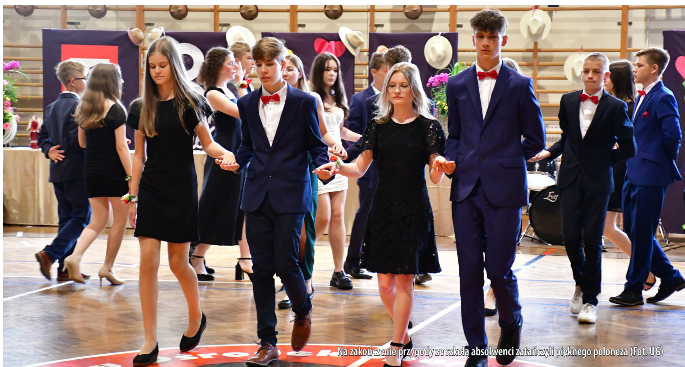
Na zakończenie przygody ze szkołą absolwenci zatańczyli pięknego poloneza