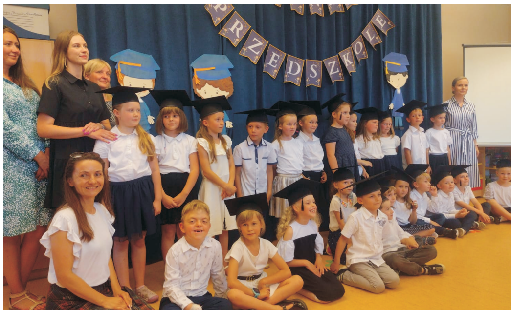
„Pszczółki” zakończyły przygodę z przedszkolem. Teraz czas na szkołę podstawową (Fot. PP 1)