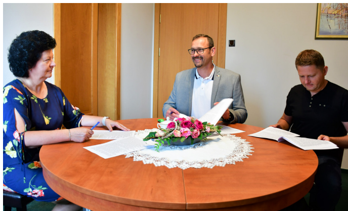
Prace w szkole kosztować będą prawie 1,7 mln zł