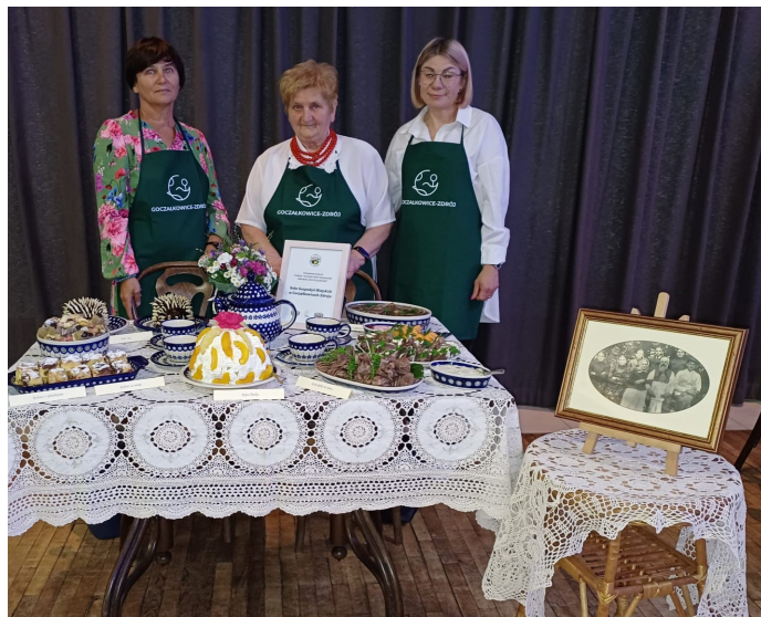
UG ▲ Nasze panie zaprezentowały się wyśmienicie

Konkurs został zorganizowany przez Powiat Pszczyński, Śląski Ośrodek Doradztwa Rolniczego w Częstochowie, Powiatowy Zespół w Pszczynie i Gminę Suszecz.