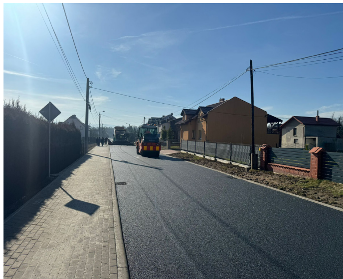
Coraz bliżej zakończenia także innej dużej inwestycji, wartej 8,3 mln zł. Chodzi o rozbudowę ul. Powstańców Śląskich z budową chodnika, nowego mostu oraz parkingu