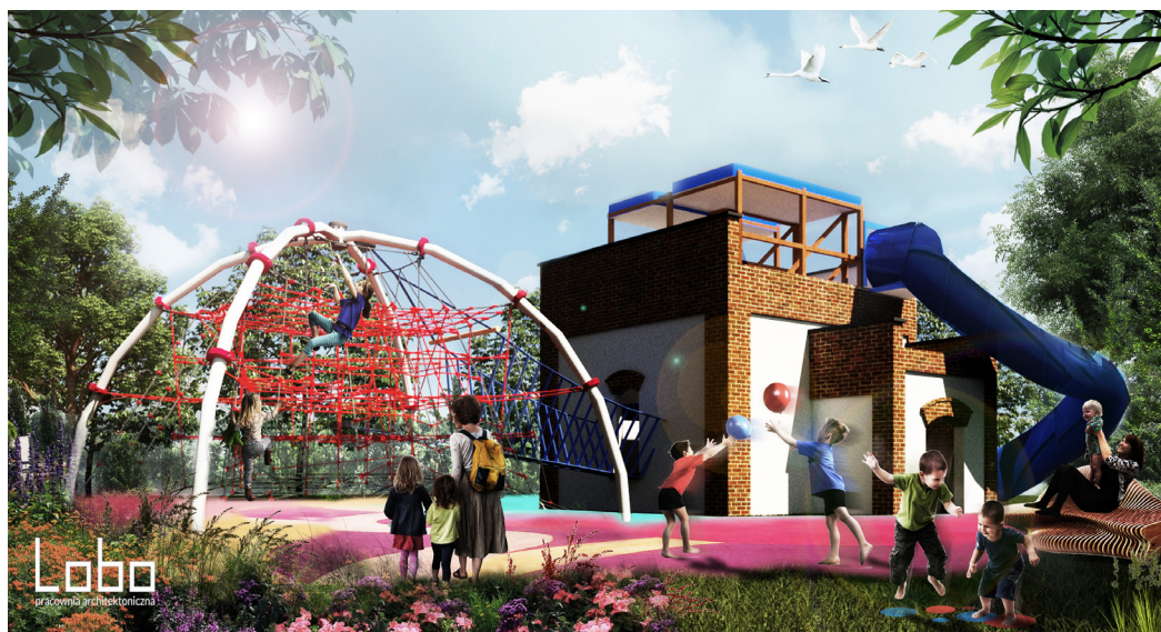
Wizualizacja placu zabaw, który ma powstać na Kolonii Brzozowej

Pierwsza uchwała związana jest z placem zabaw na Kolonii Brzozowej. Już wcześniej informowaliśmy, że w 2021 roku gmina kupiła działkę u zbiegu ulic Staropolanka i Solankowej. Przygotowane zostały koncepcja placu zabaw oraz odpowiednia dokumentacja. Na tym etapie okazało się, że konieczna jest zmiana miejscowego planu zagospodarowania przestrzennego. Bez zmiany planu gmina nie uzyska zgody ze Starostwa Powiatowego w Pszczynie na rozpoczęcie prac budowlanych. Dlatego niezwłocznie ruszyły prace planistyczne, które zakończyły się 9 stycznia przyjęciem miejscowego planu zagospodarowania przestrzennego terenu w gminie Goczałkowice-Zdrój przy ul. Solankowej. Umożliwia to budowę placu zabaw z zielenią i elementami tzw. małej architektury, w celu stworzenia