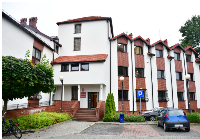
Za 1,3 mln zł zrealizowano inwestycję ekologiczną w Urzędzie Gminy, która doprowadziła do poprawy efektywności energetycznej – nowe oświetlenie, wymiana kotłów, drzwi, okien, ocieplenie ścian i dachu, montaż paneli fotowoltaicznych