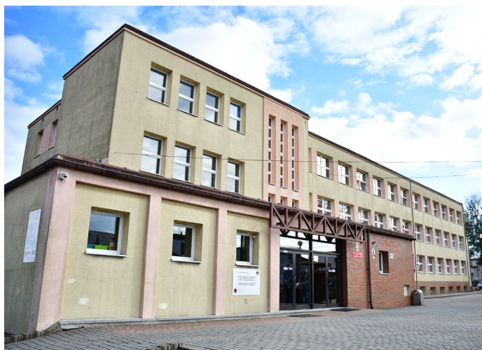
Ekologicznie także w Szkole Podstawowej nr 1! Za 2,6 mln zł w budynkach wymieniono okna oraz kotły. Zamontowane zostały pompy ciepła, a także panele fotowoltaiczne