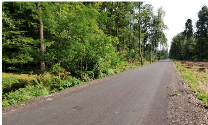
Nowa droga na długości 2331 mb, wymiana zniszczonego przepustu nad potokiem na nowy oraz wykonanie oświetlenia – to zakres prac na ul. Bór II za 1,7 mln zł