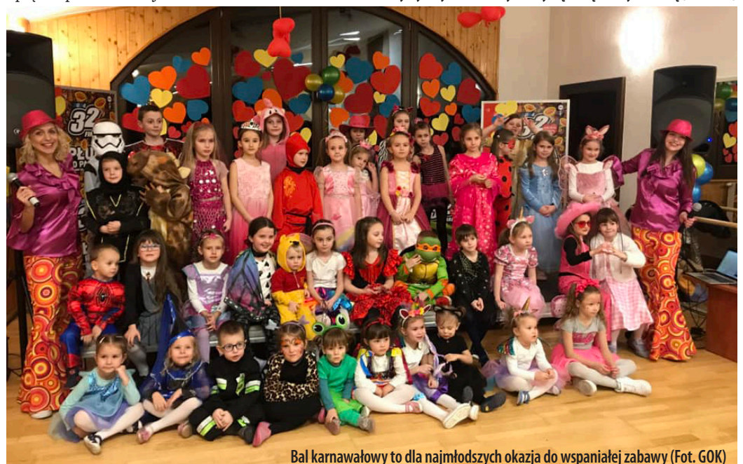
Bal karnawałowy to dla najmłodszych okazja do wspaniałej zabawy