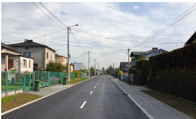
Na ul. Wiślniej przebudowano drogę, wybudowano chodnik, powstała też nowa kanalizacja deszczowa. Prace kosztowały 1,7 mln zł

Rekordowe nakłady na inwestycje na terenie Goczałkowic-Zdroju, ogromne środki zewnętrzne, które udało się pozyskać na realizację ważnych dla mieszkańców zadań – taka była kończąca się właśnie kadencja 2018-2024. Czas na podsumowanie, dlatego przypominamy najważniejsze inwestycje, które udało się wykonać w naszej gminie w ostatnich latach.