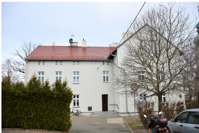
Budynek wielorodzinny przy ul. Szkolej ma docieplone ściany i dach, wymienione okna, a pobliski budynek gospodarczy – odnowioną elewację. Ekologiczna inwestycja pochłonęła 700 tys. zł