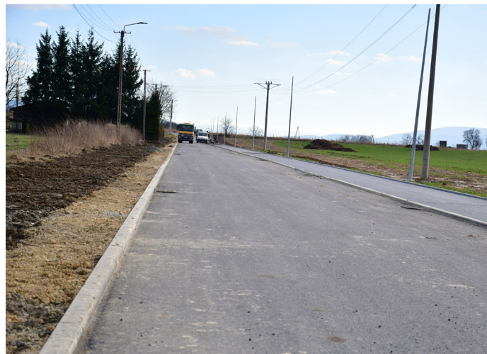
Na ukończeniu jest budowa nowej drogi na Kolonii Brzozowej za 5 mln zł. To połączenie ulic Źródlanej i Spokojnej wraz z drogą rowerową, odwodnieniem i oświetleniem