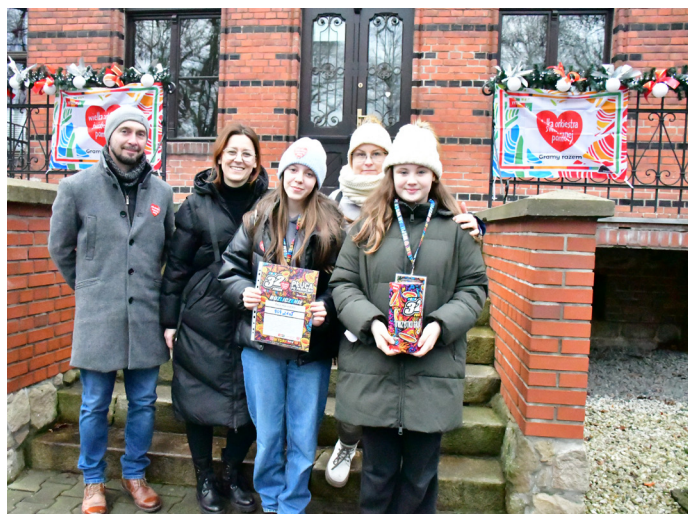
W naszej gminie kwestowało 12 wolontariuszy