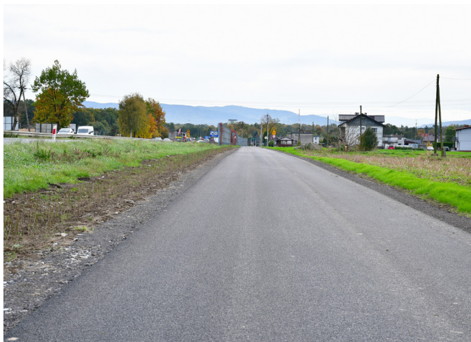
Dzięki dużej gminnej inwestycji za 4,5 mln zł mamy nową drogę wzdłuż DK 1, ul. Warzywną oraz przebudowany odcinek ul. Robotniczej