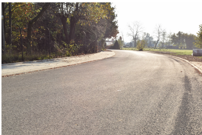
Inna ważna droga przebudowana na Kolonii Brzozowej to ul. Solankowa. Za prawie 1 mln zł prowadzono prace drogowe oraz związane z kanalizacją deszczową