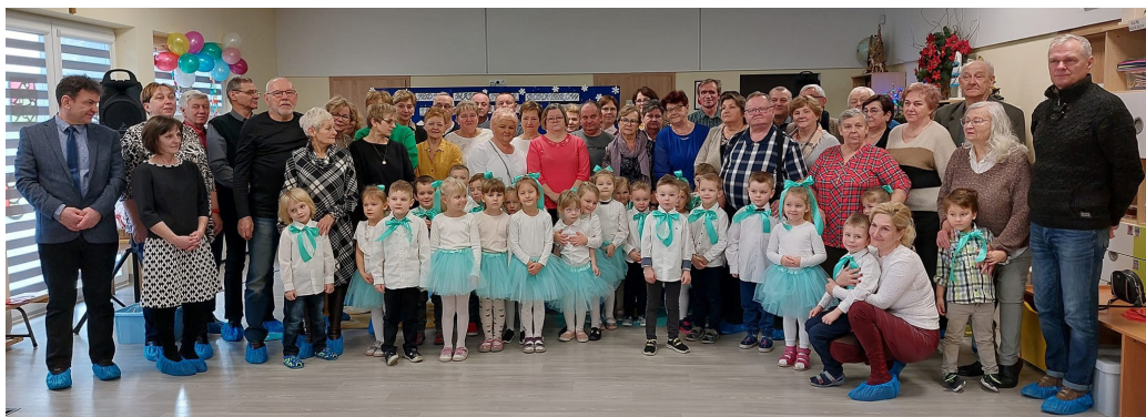
To była piękna uroczystość, zarówno dla dzieci, jak i ich babć i dziadków (Fot. PP 2)

W trakcie uroczystości Babcie i Dziadkowie mogli podziwiać swoje pociechy w różnych formach artystycznych. Każda grupa przygotowała swój indywidualny, niepowtarzalny program pełen wierszyków, piosenek i tańców. Był występ, w którym zaproszeni goście przenieśli się w czasy PRL, gdzie myśl o kolejkach, braku towarów, jeansach z Pewex-u i pralce Frani spowodowała wiele uśmiechu i pozytywnych wspomnień. W innym dniu dzieci pokazały m.in. choreografię z wykorzystaniem muzyki filmowej oraz zatańczyły twista.