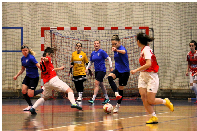
W turnieju goczałkowiczanki zajęły 2. miejsce