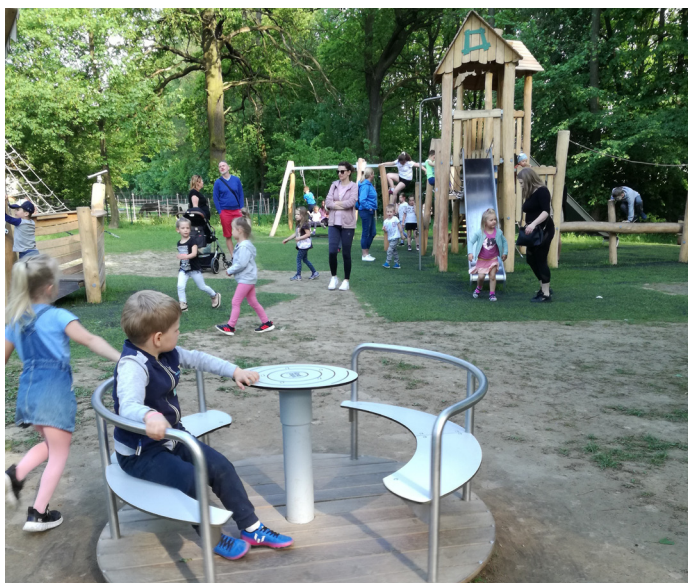
W Parku Zdrojowym, wśród drzew powstał bezpieczny plac zabaw. Koszt to niemal 500 tys. zł. Dzieci mogą bawić się i szaleć w pięknym otoczeniu przyrody