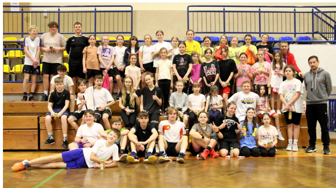
Na „Goczusiu” rozegrano turnieje koszykówki i futsalu