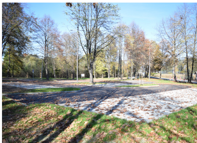
Na rogu ulic Uzdrawiskowej i Zielonej mamy nowy parking, wpisany w istniejący drzewostan. Powstało też oświetlenie i odwodnienie. Inwestycja kosztowała 1,6 mln zł