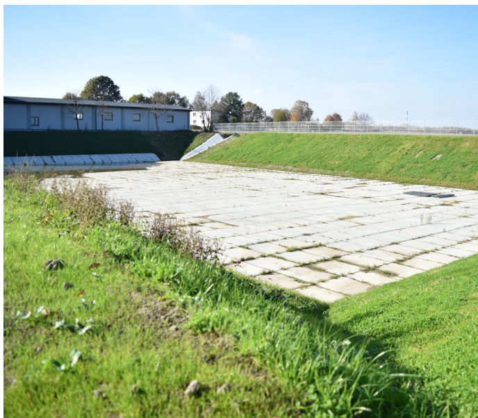
Zbiornik retencyjny w rejonie ul. Zimowej już spełnia swoją funkcję. Zbiera on wodę z większej powierzchni zlewni. Inwestycja kosztuje ponad 2 mln zł