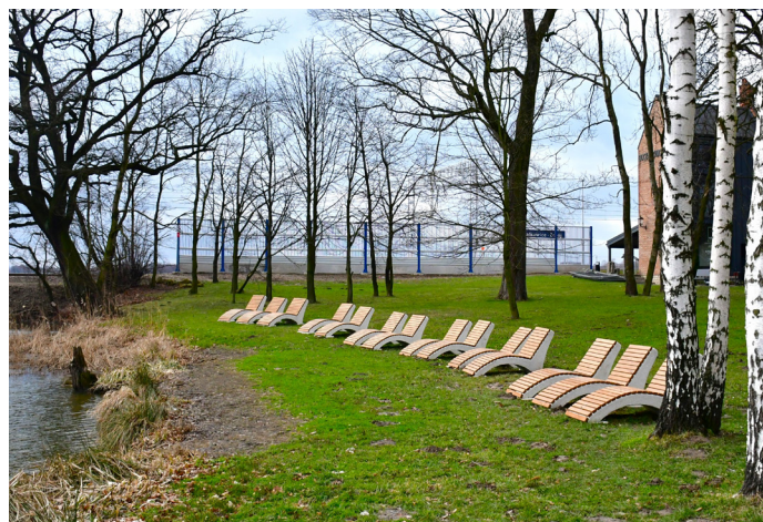
UG ▲ Zapraszamy do korzystania z leżaków (Fot. UG)

Zadanie było realizowane w ramach Programu Rozwoju Obszarów Wiejskich na lata 2014-2020. Gmina Goczałkowice-Zdrój pozyskała na ten cel dofinansowanie z Lokalnej Grupy Działania „Ziemia Pszczyńska”.