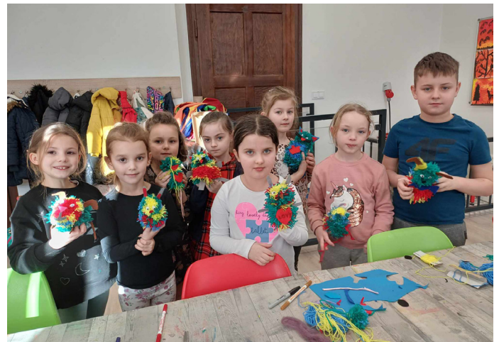
W ramach warsztatów artystycznych dzieci wykazały się dużą kreatywnością