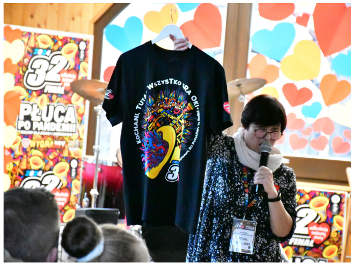
Dużym zainteresowaniem cieszyły się orkiestrowe aukcje