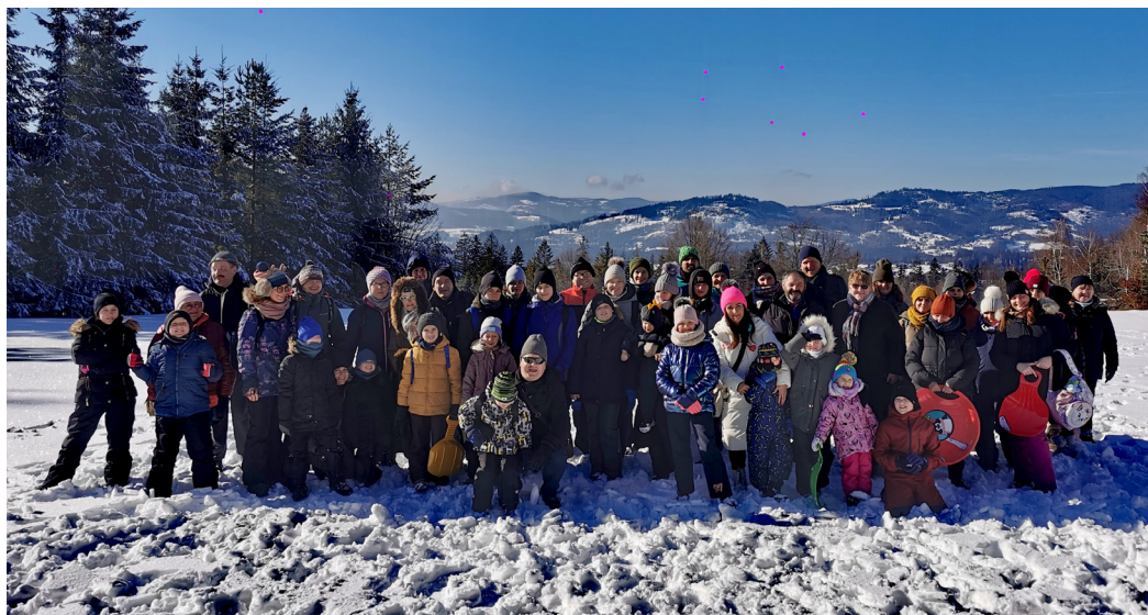
Ferie rozpoczęły się rodzinnym wyjazdem na kulig