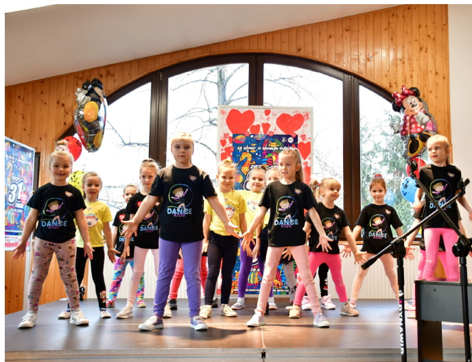
Na scenie w siedzibie GOK zaprezentowali się młodzi artyści