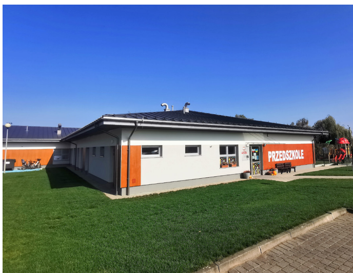
Dzieci mają wspaniałe warunki do nauki i zabawy, a to dzięki budowie nowej siedziby Publicznego Przedszkola nr 2, za prawie 4 mln zł