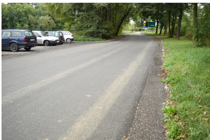
Droga powiatowa, ul. Zielona została wyremontowana ze środków przekazanych przez gminę Goczałkowice-Zdrój, prawie 200 tys. zł