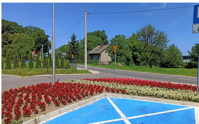
W tej kadencji powstał oczekiwany łącznik ulic Borowinowej i Zielonej wraz z oświetleniem, chodnikiem i parkingiem. Prace kosztowały niemal 1,6 mln zł