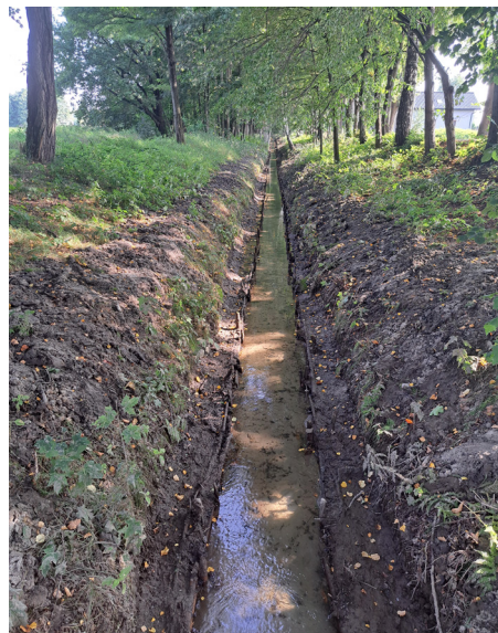
Kanał Kanar (rejon Rybaczówki), po konserwacji