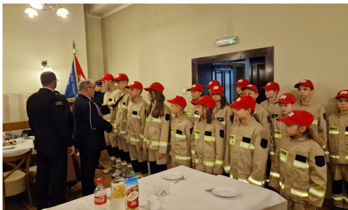
Podczas zebrania ślubowanie złożyli nowi członkowie Młodzieżowej Drużyny Pożarniczej