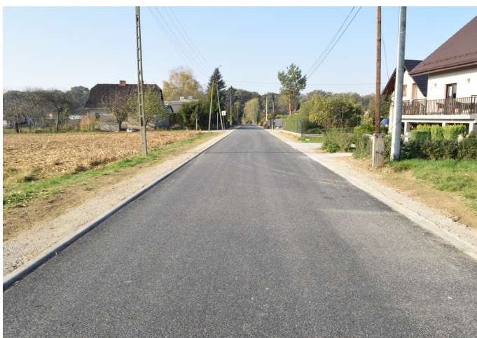
Prawie 1,3 mln zł pochłonęła inwestycja na ul. Sołeckiej. Zakres obejmował przebudowę jezdni oraz wymianę zniszczonego kolektora kanalizacji deszczowej