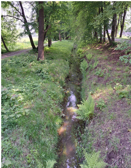
Kanał Kanar (rejon Rybaczówki), przed konserwacją

W 2023 roku opłaty na konserwację urządzeń melioracyjnych wynosiły: od posesji do 1 hektara: 20 zł, za każdy kolejny rozpoczęty hektar 15 zł. W 2023 roku Spółka wykonała konserwację sieci drenarskiej na łącznym obszarze oddziaływania sieci drenarskiej 3 ha i podała konserwacji rowy melioracyjne (tj. m.in.: koszenie, wycinka drobnych samosiejek, odmulanie dna, czyszczenie wylotów) na łącznej długości 3 km 63 m. Rowy poddane konserwacji to m.in. Kanał Kanar (od rzeki Wisły przez Uzdrowisko w kierunku Rybaczówki), rów R-B - rejon ul. Kolejowej, rów R-B-1 - rejon ul. Robotniczej, rów R-2 - Lasek Brzozowy, rów R-3 - rejon ul. Uzdrowskiej w kierunku ul. Czajkowskiego. Konserwacja sieci drenarskiej wykonana była w